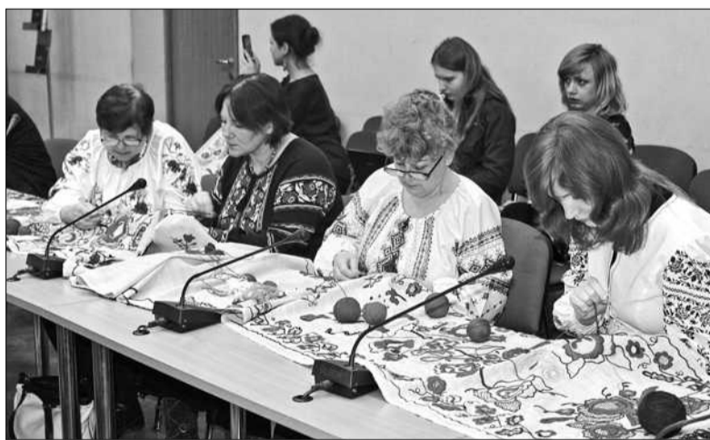
Вишивальницям, які не покидають до сьогодні голку із ниткою, вручила подяки перша леді держави Марина Порошенко

Експозиція буде працювати до кінця травня 2015 року у виставковому залі сферичного кінотеатру Atmosfera 360. Завдяки цьому проєкту люди зможуть повновою відкрити для себе тему космосу. У кожного є можливість надихнутися, дізнатися щось нове та цікаве, отримати неоціненний досвід. Адаже космос завжди в тренді! ■