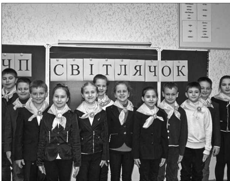
У школі створили черговий патруль «Світлячок», до обов'язків якого входить слідкувати за економією освітлення під час уроків, перерв та в позаурочний час