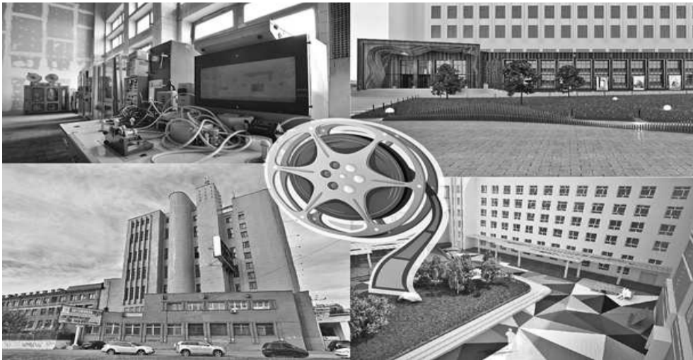
З великої споруди, яка не використовується на повну потужність (фото ліворуч), Національний центр Олександра Довженка прагнуть перетворити на сучасний культурний кластер (фото праворуч)