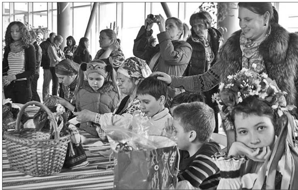
Наймолодші учасники акції разом із народними майстрами виготовляли ляльки-мотанки, малювали картини та розписували писанки, які потім виставляли на продаж, аби також долучитись до збору коштів для захисників України