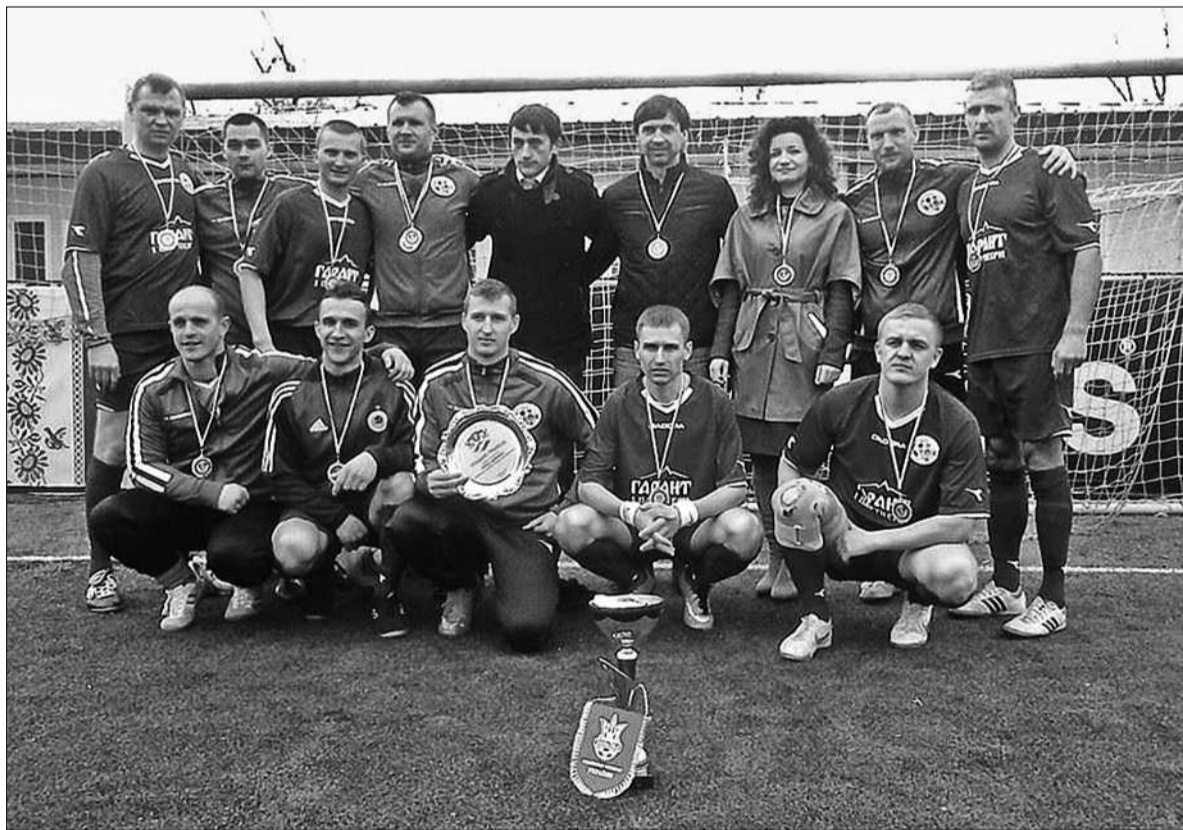
Збірна команда Збройних сил України стала переможцем турніру «За здоровий спосіб життя»

з рахунком 3:1 і вже за п'ять днів зіграють свій перший півфінальний матч. Там на них чекатиме переможець регулярного сезону — южненський «Хімік», який у цьому сезоні ще не зазнав гіркоти поразки ■