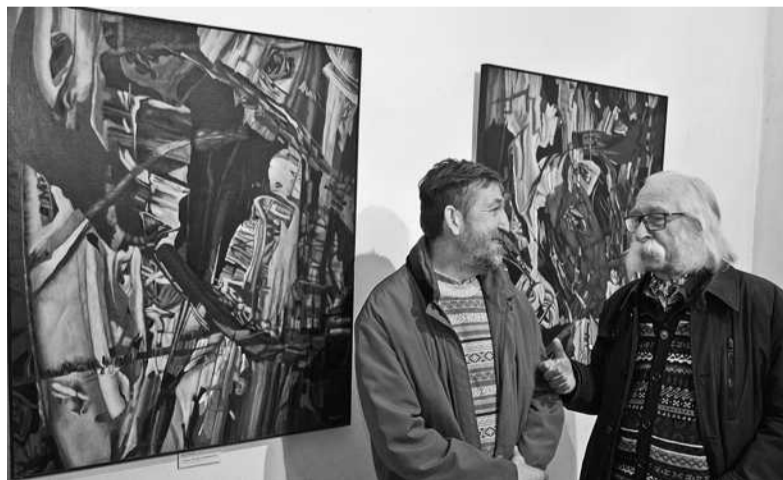
В експозиції репрезентована творчість багатьох майстрів абстракціонізму з усієї країни, серед яких народний художник України Іван Марчук

■ У місті триває виставка сучасного абстрактного живопису