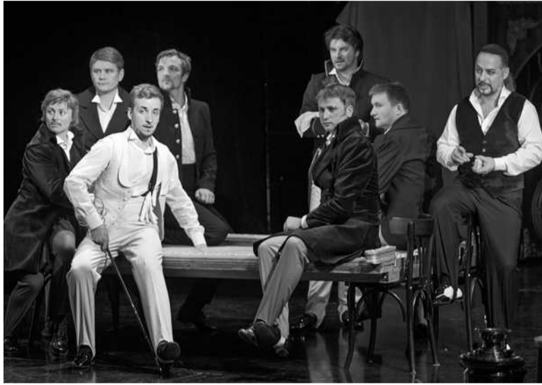
Епіграф Миколи Гоголя до п'єси «Ревізор» - «Не кивай на дзеркало, коли пика крива» — актуальний і сьогодні

Вистава «Ревізор» у Театрі на Липках йде українською мовою — у перекладі Остапа Вишні, який, як