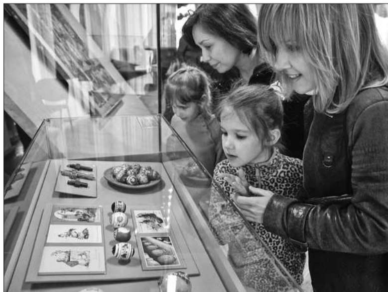
Неодмінним атрибутом великодніх виставок і ярмарків є писанки

З 7 по 25 квітня в Центрі української культури та мистецтва (вул. Хорива, 19-В) проходить виставково-мистецький проект «Сонячний Великдень — 2015», що представляє понад півтисячі творів декоративно-прикладного мистец-