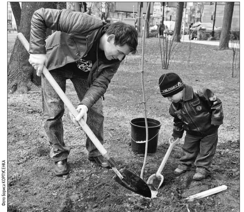
Столичні байкери проявили власну ініціативу і посадили в парку Шевченка алею кленів

ховувати дітей жити в чистоті. Чисто не там, де прибирають, а там, де не сміять. Було б добре, щоб молодь навчилася прибирати за собою в парках, викидати пляшки з-під пива, а не залишати їх. Тому зараз ці суботники — це благородна справа і вчить нас