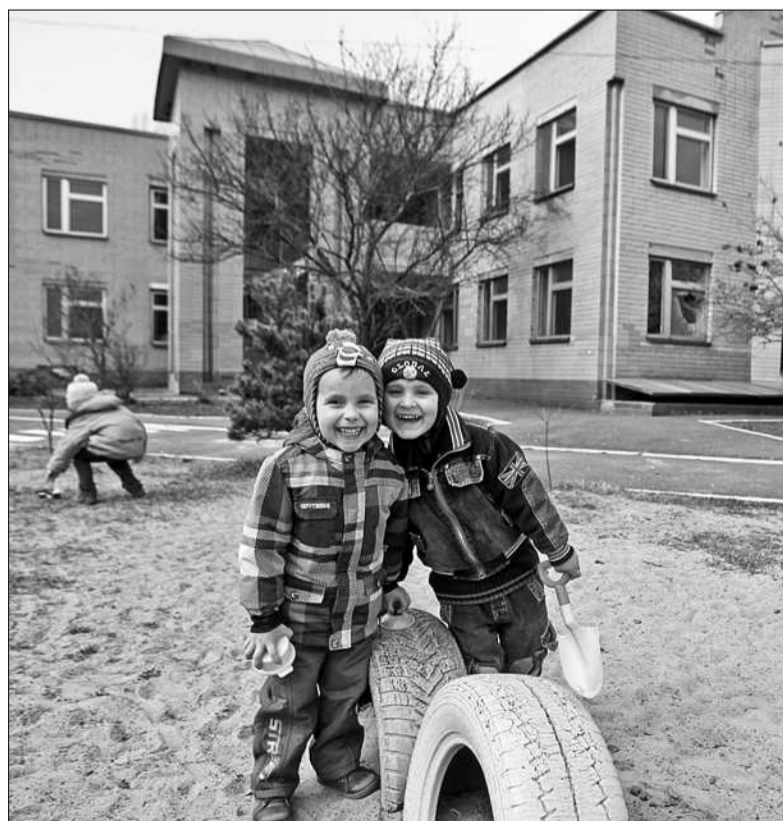
Уже з 1 вересня дитсадок № 305 Голосіївського району столиці має запрацювати на повну потужність

У суботу понад п'ять тисяч волонтерів долучилися до прибирання Києва