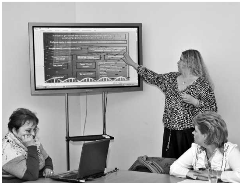
Учасники семінару наголосили, що потрібно планувати комунікаційні кампанії, формувати чіткі інформаційні стратегії

Учасники семінару підготували звернення до Міністерства охорони здоров'я України про системне запровадження тренінгів з комунікацій за європейським стандартами, впровадження в практику новітніх інформаційних технологій — зокрема, професійного спілкування у соціальних мережах ■