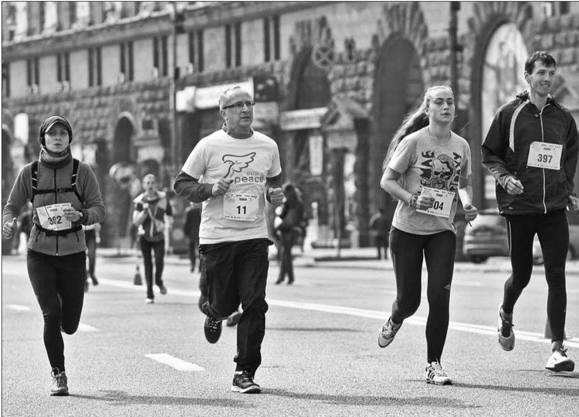
До учасників «Забігу миру» долучився голова Представництва ЄС в Україні Ян Томбінські (ліворуч)

У СТОЛИЦІ пройшов «Забіг миру», який об'єднав сотні різних за віком, родом заняття і захопленнями киян. Перед стартом прихильники здорового способу життя провели розминку, познайомилися і потанцювали. Потім розділилися на дитячу і дорослу команди. Для найменших було полегшене завдання — пробігти від Майдану Незалежності дистанцію в 300 метрів. Разом з малюками пробігся і міністр молоді та спорту Ігор Жданов.