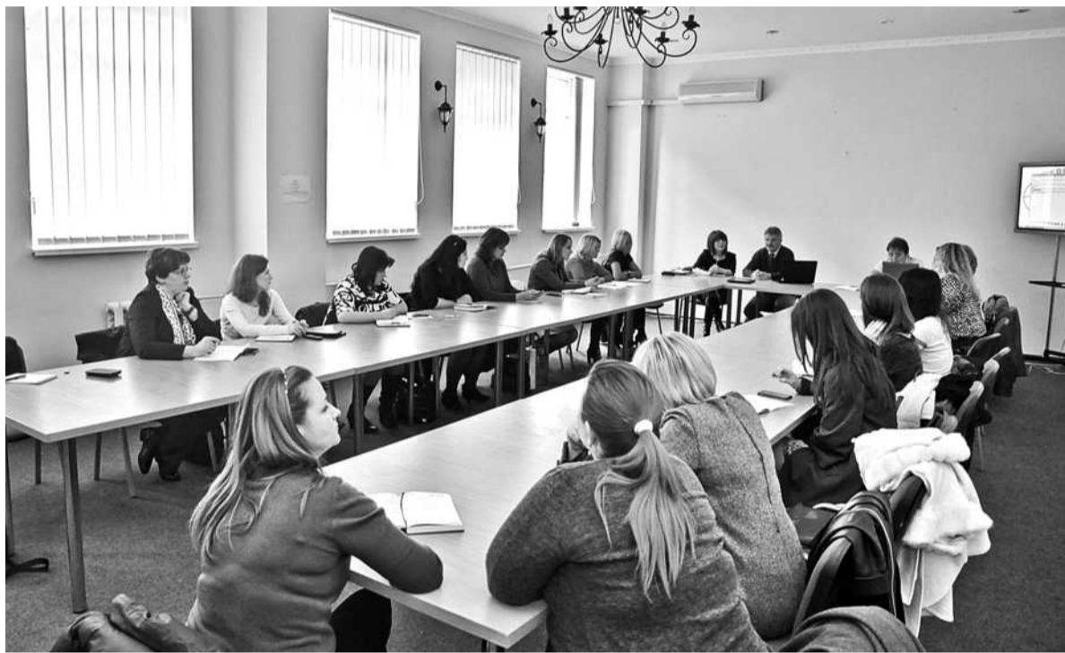
У столиці відбувся семінар для державних службовців, які працюють у сфері охорони здоров'я

Департамент суспільних комунікацій Київської міської державної адміністрації спільно з Інститутом системних комунікацій провели семінар-тренінг для державних службовців, які працюють у сфері охорони здоров'я.