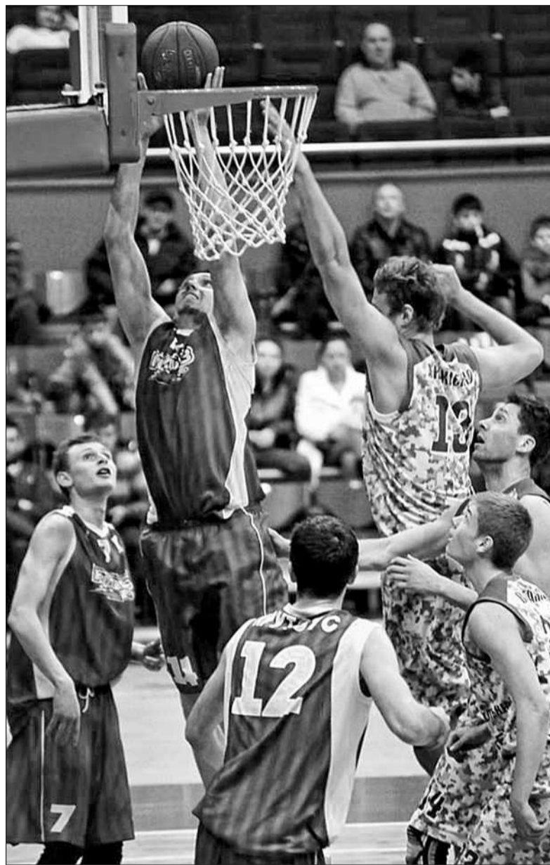
Третє протистояння сезону між «Будівельником» та «Київом» завершилося впевненою перемогою «Гладіаторів»