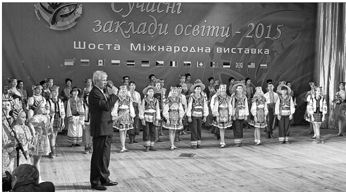
У столичному Палаці дітей та юнацтва провели VI Міжнародну виставку «Сучасні заклади освіти – 2015»

Освіту за кордоном представляли: ISM Університет економіки та менеджменту (Литва), SMK Університет прикладних соціальних наук (Литва), НТМі Інститут готельного та туристичного менеджменту (Швейцарія), Ризький університет права (Латвія), Технологіко-гуманітарний університет імені Казимира Пуласького в Радомі (Польща), Празький хіміко-технологічний університет (Чехія), Наглядова рада англійської частини Монреалу, яка пропонує навчання в професійно орієнтованих коледжах Канади за вибраною спеціальністю з можливістю працювати під час навчання, Університет Екології та Управління у Варшаві