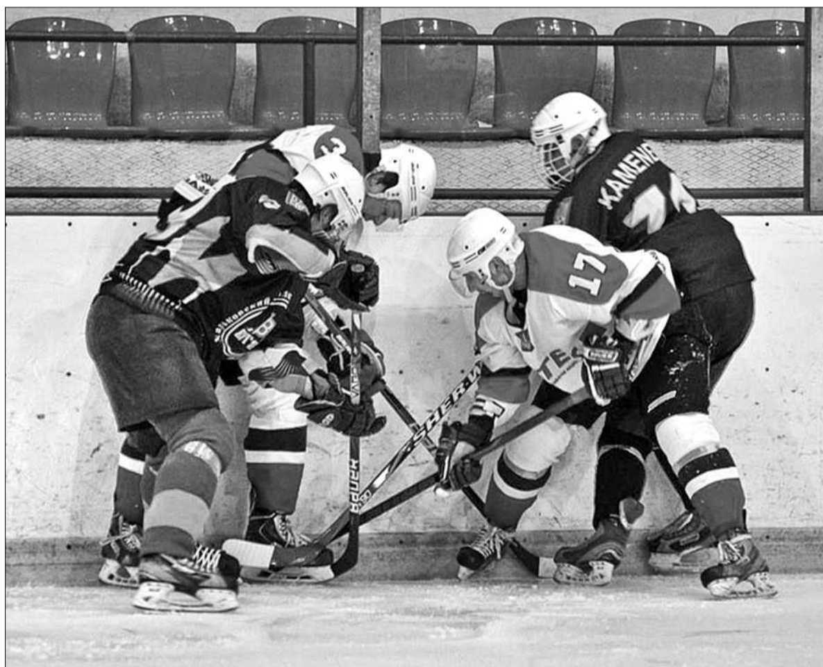
У безкомпромісному протистоянні столичний «Атек» переіграв «Дженералз» з рахунком 4:3

«АТЕК» стартує найважливішою перемогою, а серія переїздить у Бровари. 27-го березня о 19.00 там відбудеться другий поєдинок, який може стати останнім у разі перемоги команди Сергія Супруна. Якщо ж «Дженералз» візьмуть реванш, вирішальна третя зустріч команд відбудеться також в Броварах 28-го березня в суботу і також о 19.00 ■