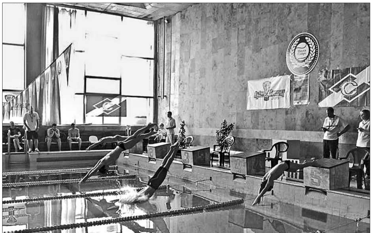
У змаганнях з плавання «Містер Батерфляй» взяли участь близько ста спортсменів

Самі ж змагання символізують тріумф молодості. Переможцями стали майбутні медики, студенти НМУ ім. О. О. Богомольця. Таким чином, команда «Київтрансгазу», поступившись у змаганнях з плавання, не втримала почесний трофей «Кубок Виклику» і урочисто вручила його переможцю змагань «Містер Батерфляй» — команді На-