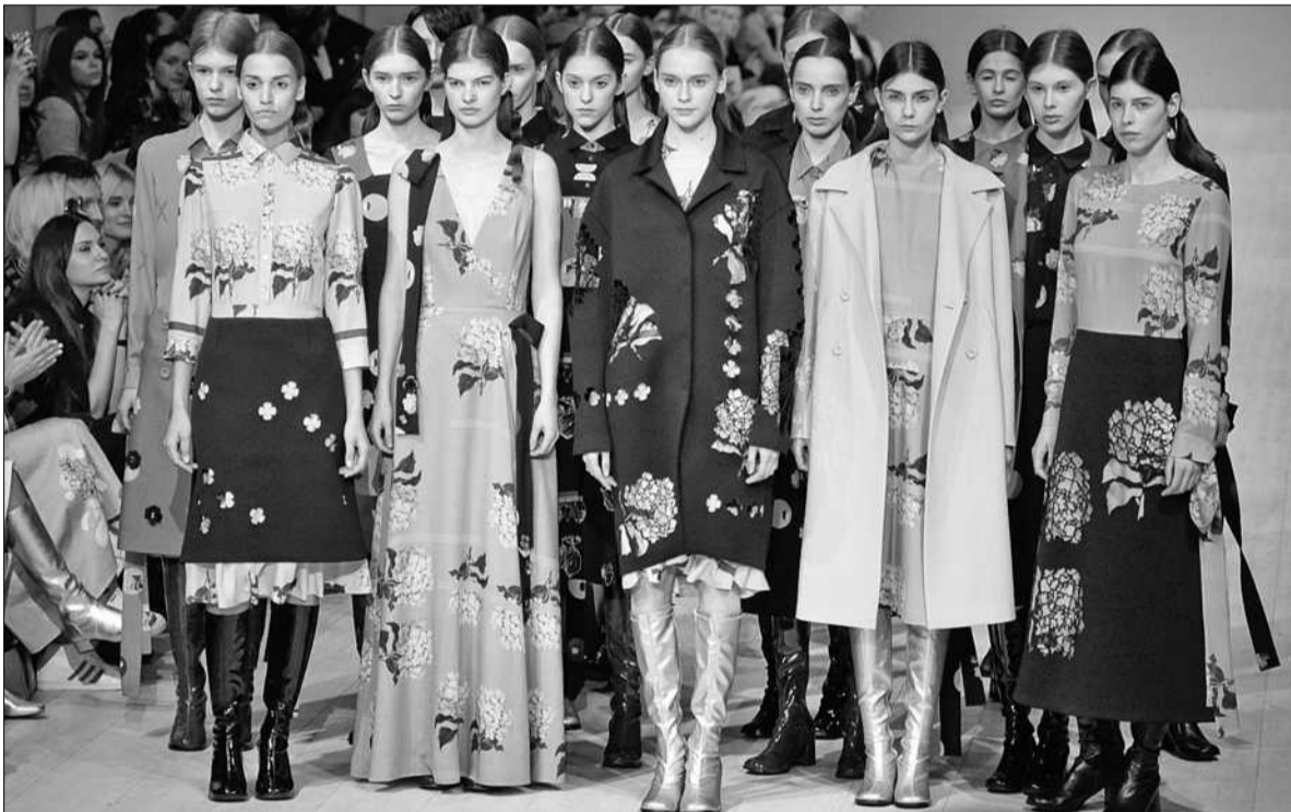
Головним принтом колекції POUSTOVIT зі сміливими комбінаціями кольорів та об'ємів стала гортензія