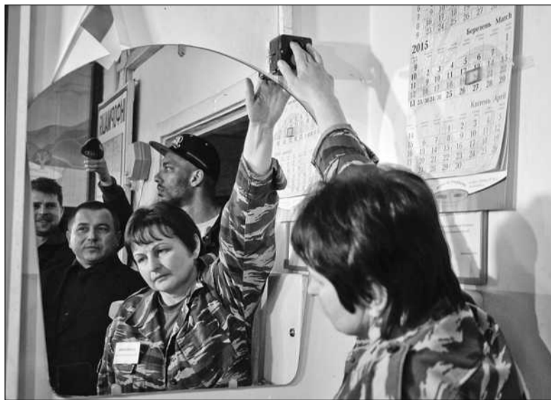
На підприємстві ПАТ «Київхліб» фхівці перевірили роботу сирени та дії персоналу у разі сигналу тривоги

Ярослава ЗОЛОТЬКО спеціально для «Хрещатика»