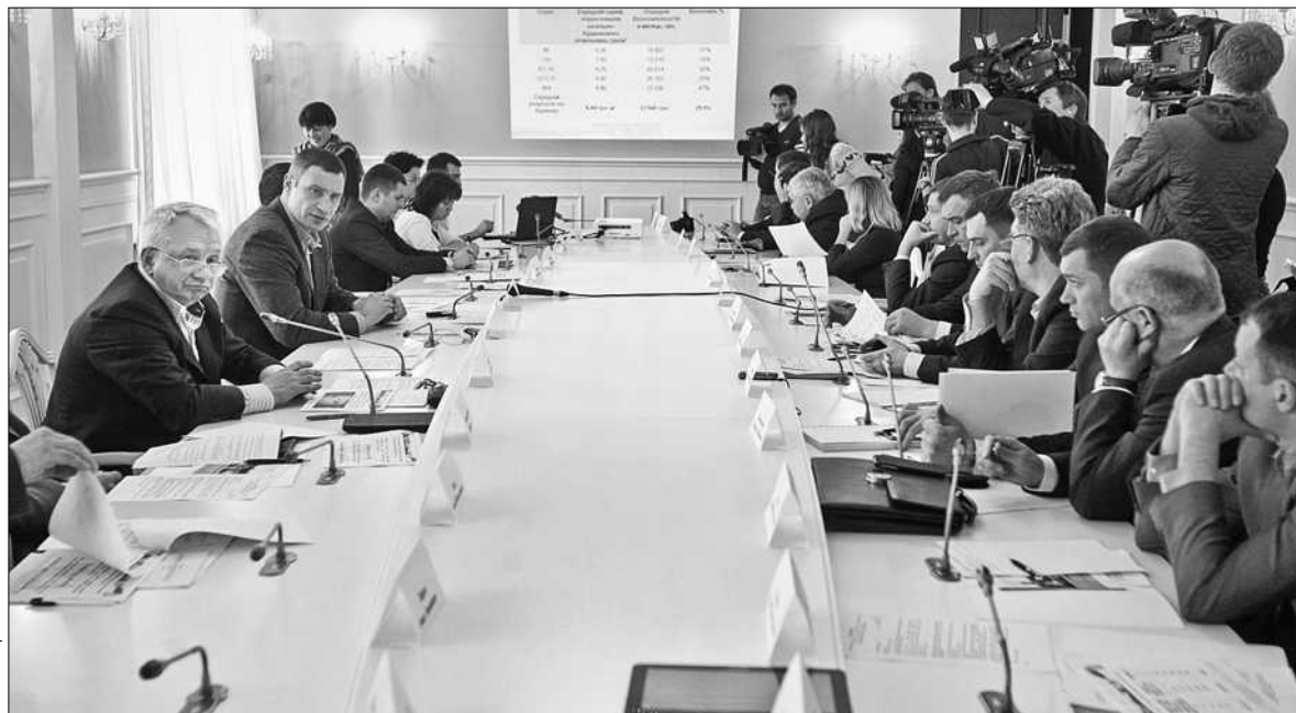
Енергозбереження залишається пріоритетом для столичної влади. Про це йшлося під час зустрічі експертної групи з питань енергозбереження

ЕНЕРГОЗБЕРЕЖЕННЯ залишається пріоритетом для столичної влади. Про це заявив Київський міський голова Віталій Кличко під час зустрічі експертної групи з питань енергозбереження. На ці заходи в міському бюджеті цього року виділено 150 млн грн. Серед першочергових планів – забезпечення лічильниками теплової енергії всіх будинків столиці. «Ми почали встановлювати лічильники теплової енергії, а також знайшли можливість застосувати лічильники, які були закуплені ще 2007-го року й які, на мою думку, абсолютно свідомо, в інтересах певних людей і всупереч інтересам киян тримали на складах», – зазначив мер столиці та додав, що завдяки заходам з регулю-