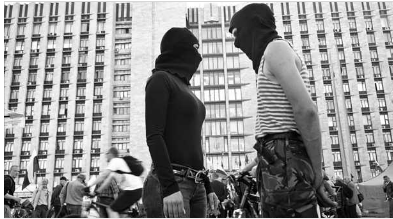
Фестиваль відкриється показом стрічки «ДНР, або Химерна історія країни-саморобки» британського режисера Ентоні Баттса

Українським реаліям на фестивалі присвячені спеціальний проєкт «Євромайдан. Енциклопедія громадських ініціатив із самоорганізації», програма про проблему енергозалежності України Досу/Енергія (погляди на права людей і природи, війна з енергетичними корпораціями), Досу/Україна (найсвіжіші стрічки від вітчизняних авторів, українська прем'єра фільмуесею «Вагріч і чорний квадрат» про відомого художника-концептуалі-