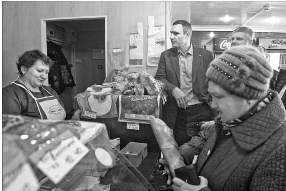
У Деснянському районі столиці мер Києва Віталій Кличко особисто перевіряв ціни на соціальні сорти хліба у спеціалізованих кіосках компанії «Київхліб»

ПРОДАЖ соціального хліба є збитковим для підприємства-виробника, але за рахунок додаткових товарів, запропонованих покупцям за ринковими цінами, компанія намагається балансувати на рівні нульового прибутку. Як повідомили «Хрещатику» представники компанії «Київхліб», щодня їхні кіоски продають близько тонни таких хлібопродуктів кожний (інших сортів – для порівняння – близько 40 кілограмів), намагаючись максимально задовольнити потреби мешканців мікрорайонів. Задля цього, згідно з графіком, до павільйонів хліб привозять тричі на день – вранці, вдень та ввечері, коли люди повертаються з роботи. Але зараз працює всього сім таких невеличких магазинів і ще 10 – в очікуван-