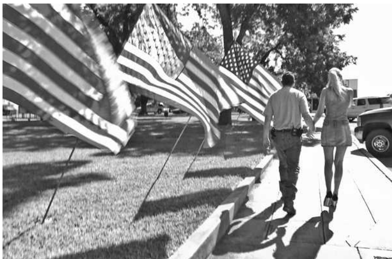
Українські жінки зацікавлені не стільки в американських чоловіках, як в надійному шлюбі, вважає режисер стрічки Джонатан Нардуччі

■ В столичних кінотеатрах показують фільм «Заміж за іноземця»