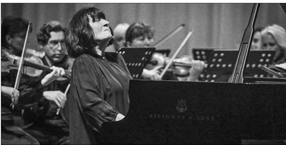
Ювілею Ріхтера присвячено п'ятничний концерт, де Елісо Вірсаладзе виступить у супроводі Академічного симфонічного оркестру Національної філармонії України

Детальна програма і розклад на сайті фестивалю http://docudays.org.ua ■