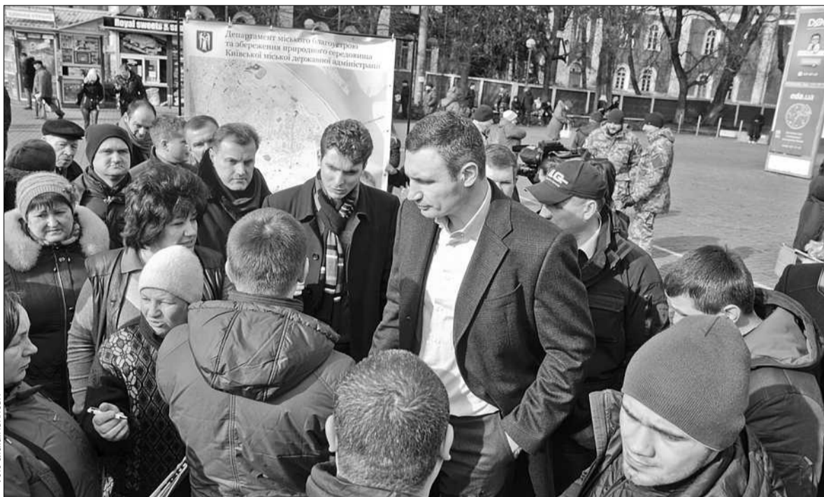
Під час інспекції території району Київський міський голова Віталій Кличко заявив місцевим мешканцям, що Печерськ повністю очищений від незаконних МАФів

ПЕЧЕРСЬКИЙ район повністю очищений від незаконних МАФів. Про це під час інспекції території району заявив Київський міський голова Віталій Кличко. «Ті, що залишилися, мають офіційний дозвіл на підприємницьку діяльність. Голова Печерського району відповідальний за те, щоб незаконних МАФів в районі більше не було. Якщо будуть встановлюватися нові кіоски, ви будете персонально відповідати», – попередив голову Печерської РДА Віталій Кличко.