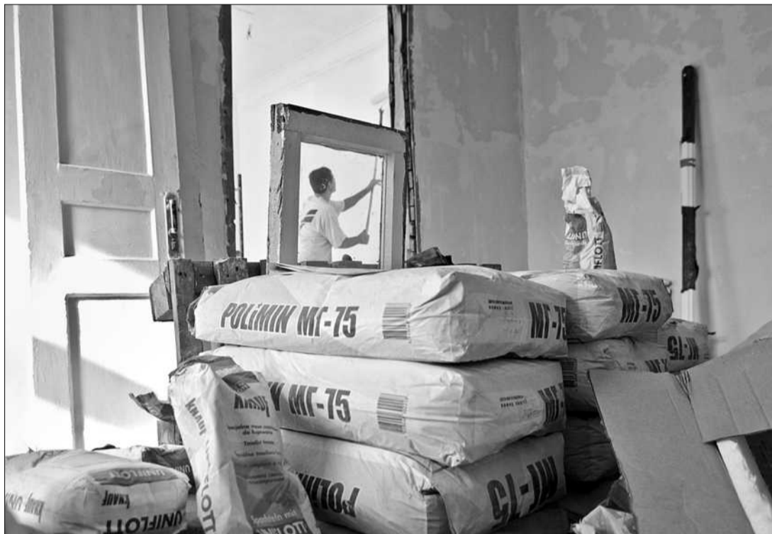
По вулиці Михайлівській, 12-в незабаром відкриється готель для бійців АТО, які повертаються додому через Київ

■ У столиці відкриють місце тимчасового перебування для воїнів-захисників