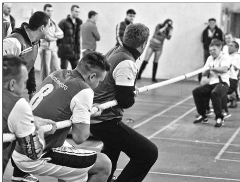
Один з чотирьох видів змагань у «Іграх захисників України» стало перетягування канатів

Щодо інфраструктури в Києві, то очільник міста запевнив, що для жителів та гостей столиці підготовлено багато сюрпризів. «У Києві нам багато чого потрібно зробити. Багато років у місті розцвітала корупція, було чимало перешкод до розвитку. Але сьогодні, незважаючи на складну економічну ситуацію, нам потрібно стабілізувати ситуацію в столиці, провести реформи. І один із ключових моментів – розвиток спорту. Ми впевнені, що всі змагання, які були заплановані в Києві, будуть проведені. Ми намагаємося залучити інвесторів. І у нас є приємні новини для тих, хто любить займатися спортом на свіжому повітрі. Невдовзі, а саме до Дня Києва, ми презентуємо новий спортивний проект», – зазначив Віталій Кличко ■