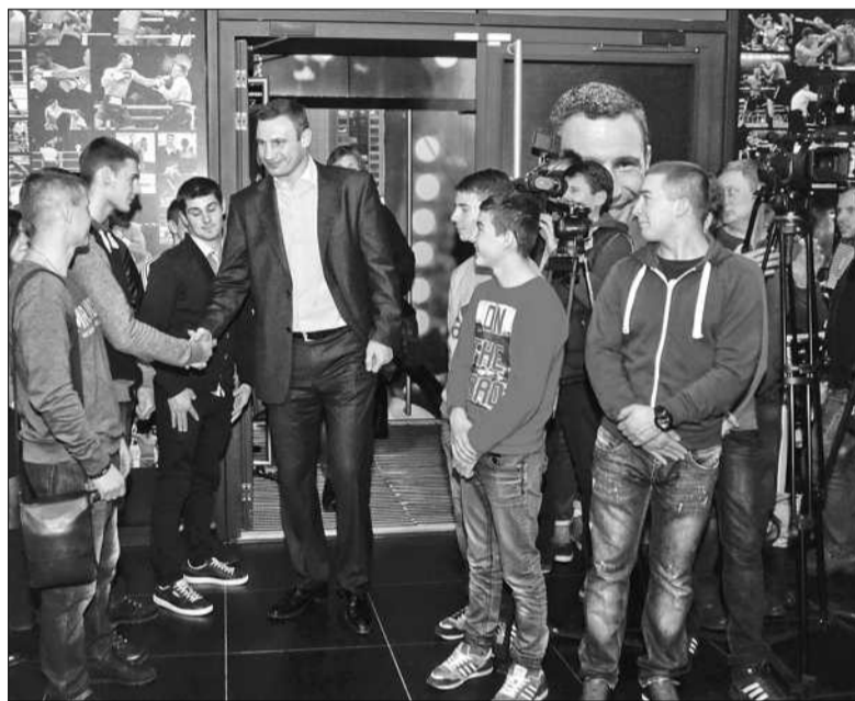
На презентації фільму «Бокс – мій шлях» Віталій Кличко привітає майбутніх учасників міжнародного турніру з боксу, який влітку пройде у Бердичеві

«Поєдинок проходитиме в Мецці боксу, на арені, де проходили легендарні боксерські поєдинки, в «Медісон Сквер Гарден» в Нью-Йорку. Цей поєдинок транслюватиме компанія НВО в США, понад 200 компаній вже викупили пра-