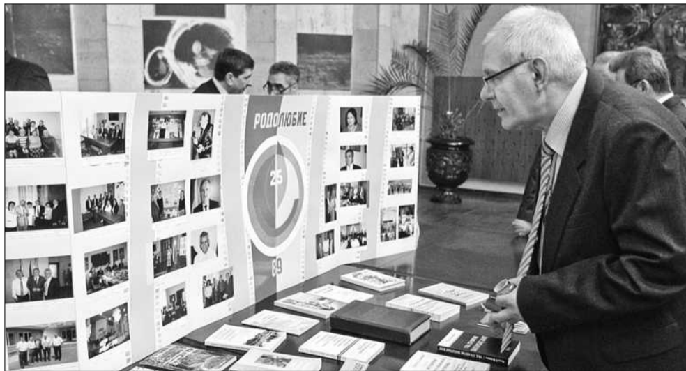
В приміщенні Посольства Республіки Болгарія відбулися урочистості з нагоди 25-річчя заснування Київського товариства болгарської культури «Родолюбіє-1989»