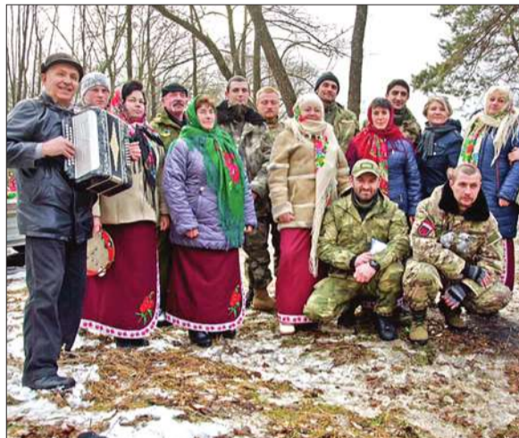
Загалом під час проведення ярмарку було зібрано 11 300 гривень, які будуть використані на закупівлю тактичних планшетів та біноклів ■

Він подякував усім за підтримку, зазначив, що без волонтерської допомоги бійцям на сході дуже тяжко.