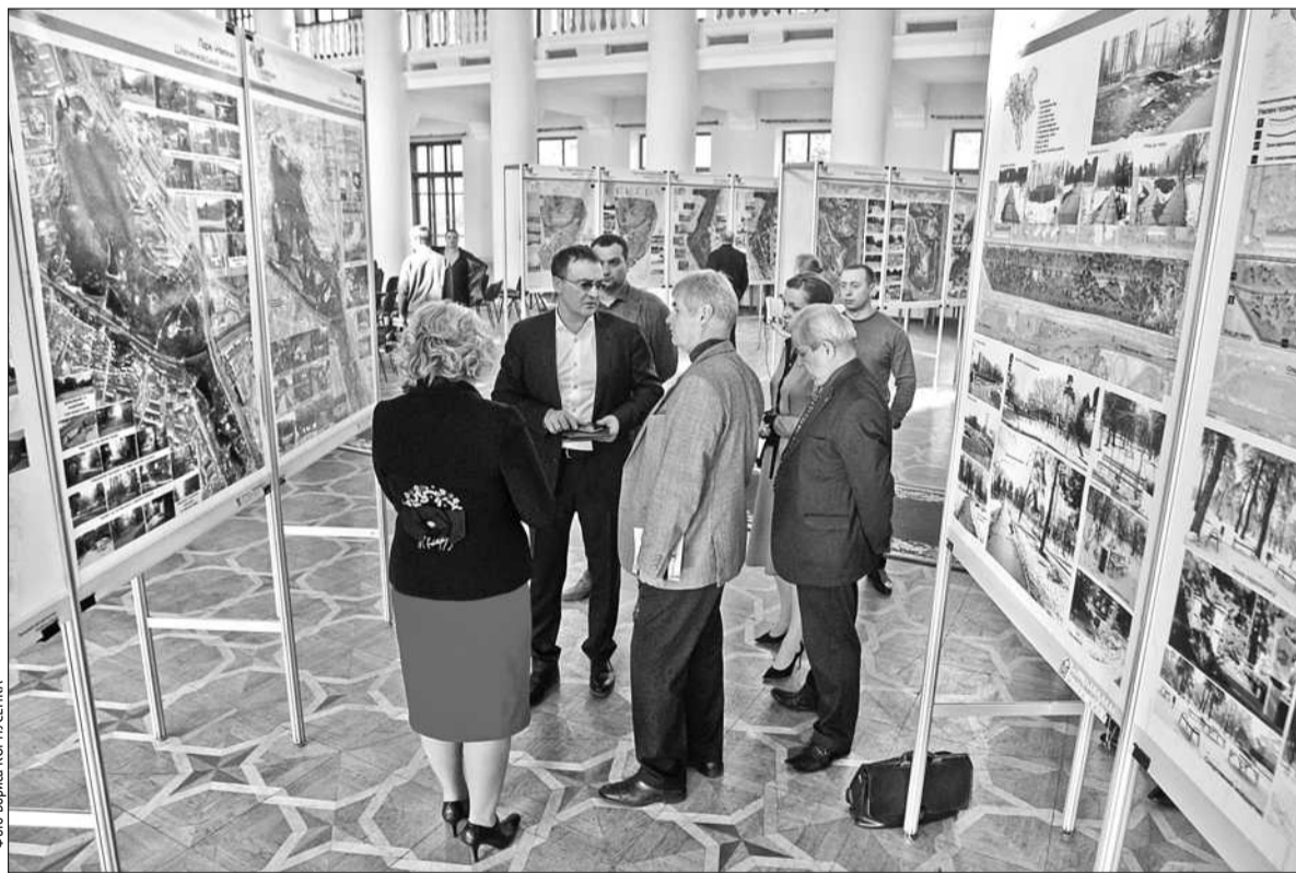
У столичній держадміністрації відбулася презентація проекту реформування міського паркового господарства «Київські парки»

Також мер Києва подякував меценатам, які посприяли, аби розпочалися роботи з реконструкції паркану вздовж Ботанічного саду імені Фоміна ■