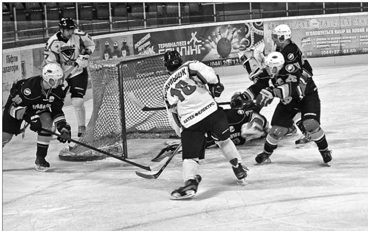
Матч між ХК «Кременчук» та київським «Дженералз» завершився впевненою перемогою клубу з Полтавщини — 5:1

■ Столичні клуби «Дженералз» та «Атек» зазнали поразок у чемпіонаті України з хокею