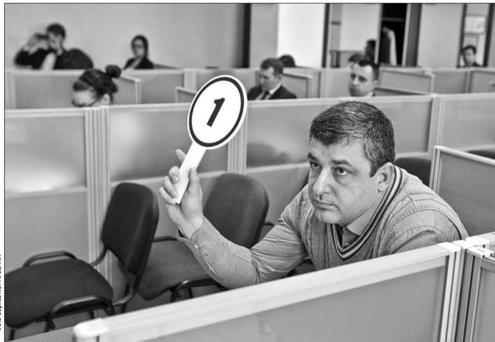
Вчора з молотка пішло право на оренду ділянки площею 0,25 га за адресою: вулиця Луначарського, 24-а, що в Дніпровському районі столиці

відсутній детальний план території (ДПТ). «Таким чином ця ділянка вже мала ДПТ, решта — ні. З точки зору містобудування — це слушна ідея, але для того, щоб зробити детальний план всього Києва, потрібно 1 млрд грн. Таких коштів в бюджеті міста нема», — додав пан Резніков.