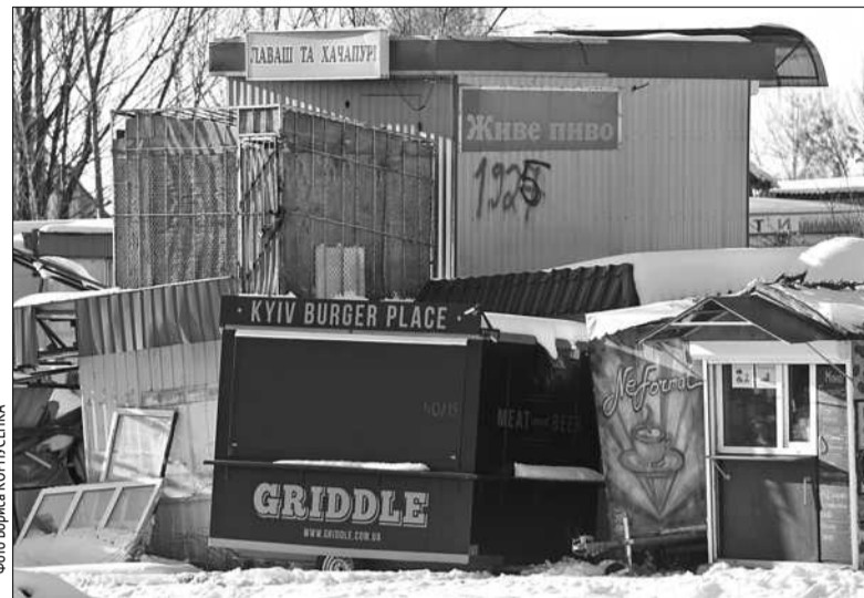
Найбільший штраф-майданчик кіосків, який в народі вже давно прозвали «кладовище МАФів», знаходиться на вулиці Народного ополчення, на території тролейбусного депо

Шукають посадовці і нові майданчики для складування кіосків-нелегалів, адже два наявних зможуть вмістити ще близько тисячі нелегальних торговельних точок. Утилізувати кіоски зможуть лише після трьох років зберігання. Також нині посадовці розглядають можливості вико-