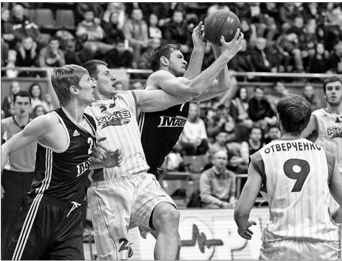
Проваливши старт матчу проти "Черкаських мавп", гравці БК "Київ" все ж таки спромоглися вирвати перемогу з рахунком 83:75

■ Столичні баскетбольні клуби продовжили успішні серії у Суперлізі