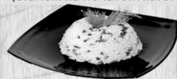
Рис – 19,67 грн/кг.

Середні ціни на соціально значущі товари у Києві (станом на початок лютого)