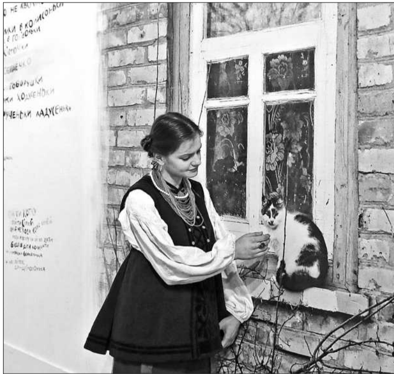
Відвідувачі мають змогу зануритися в минуле, ознайомитися з традиціями власного народу, відчути себе його частиною

■ В «Мистецькому Арсеналі» демонструють унікальні етнострої та світлини хатніх вікон