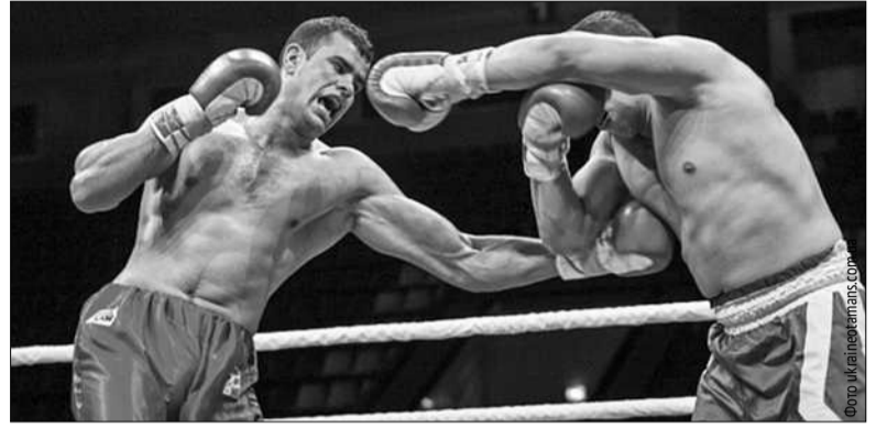
У п'яти видовищних поєдинках "Українські отамани" не змогли зламати опір "Марокканських левів" - 2:3