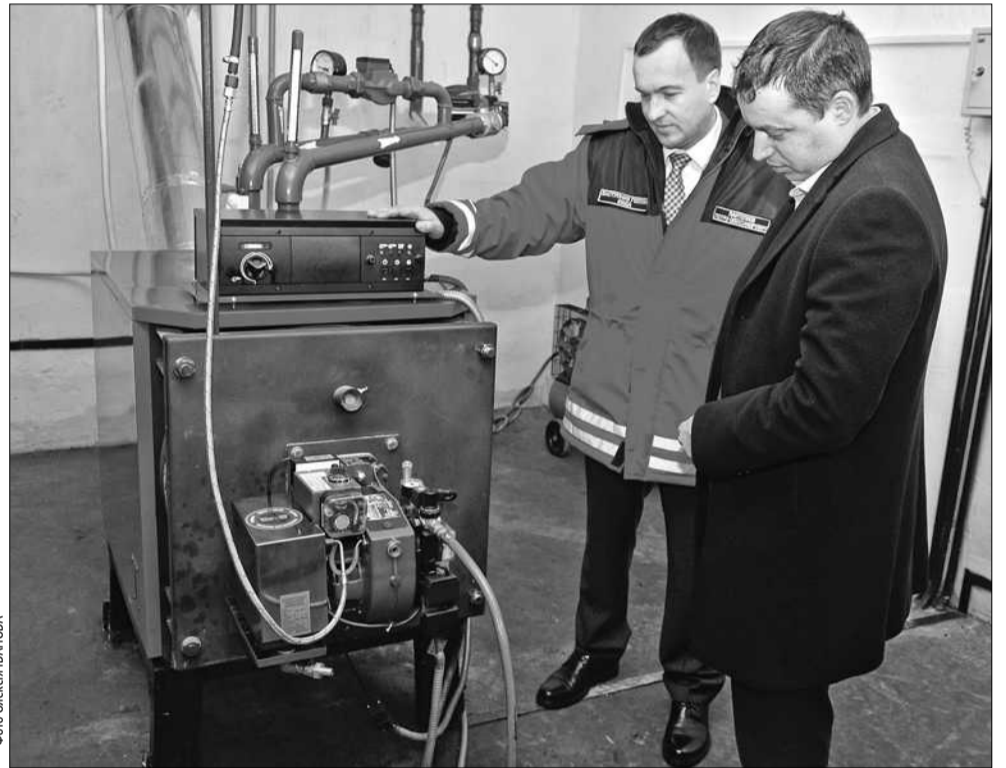
Заступник голови КМДА Петро Пантелеєв побував на презентації котла, який виробляє тепло з відпрацьованого мастила. За весь опалювальний сезон нагрівач дає можливість зекономити 140 тисяч гривень

Місто також планує переводити на альтернативні джерела опалення школи, дитсадки та лікарні, зазначив заступник голови КМДА Петро Пантелеєв. «Ми розробили план заходів зі зниження споживання природного газу — в тому числі й у соціальній сфері. Зараз взяли 16 об'єктів — це школи та дитячі садочки, де також будуть запроваджені котельні агрегати на альтернативних енергоресурсах, а саме — використовуватимемо