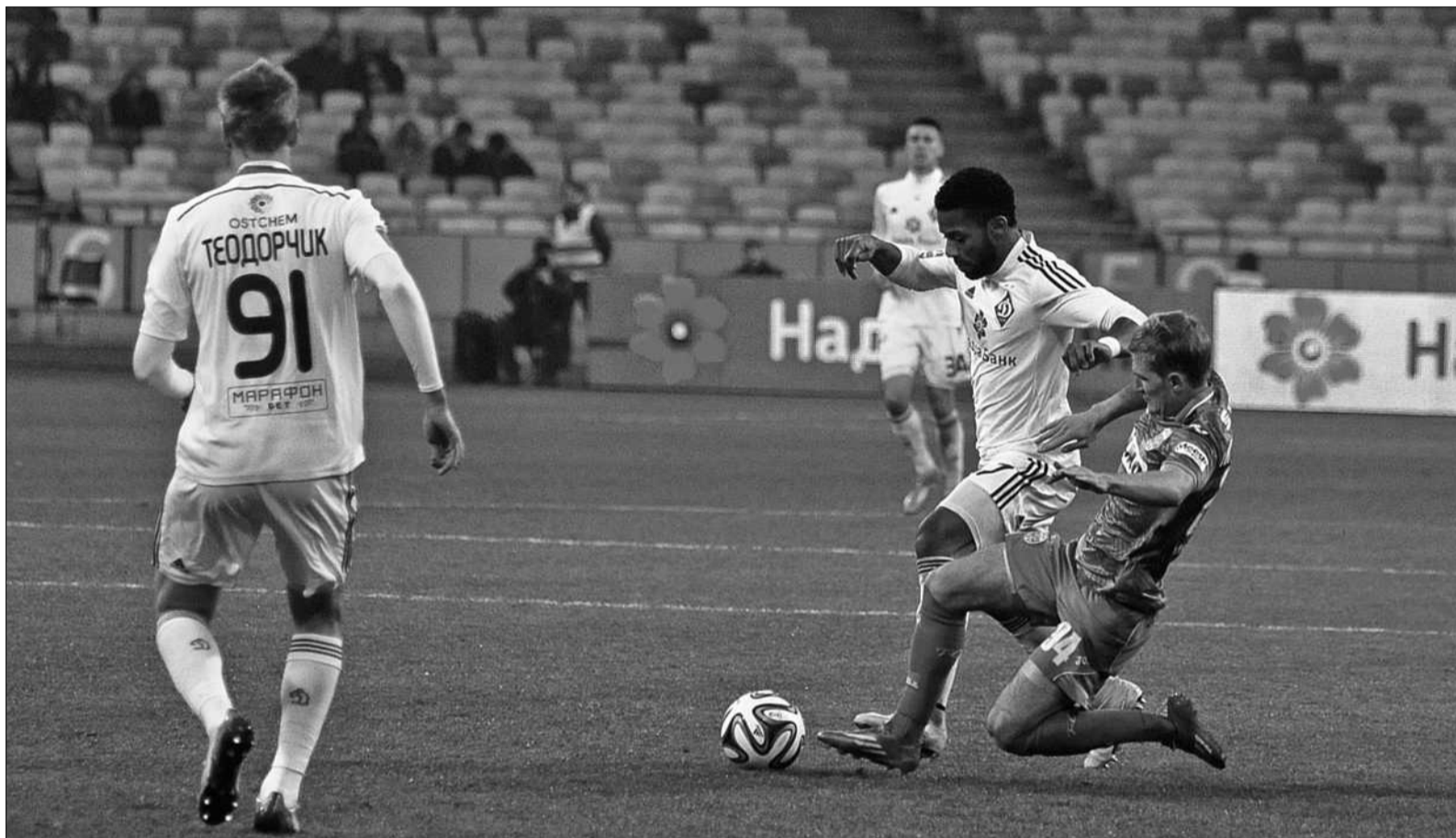
У першій частині чемпіонату київське «Динамо» не зазнало жодної поразки

Цікаві факти першої половини 24-го чемпіонату України