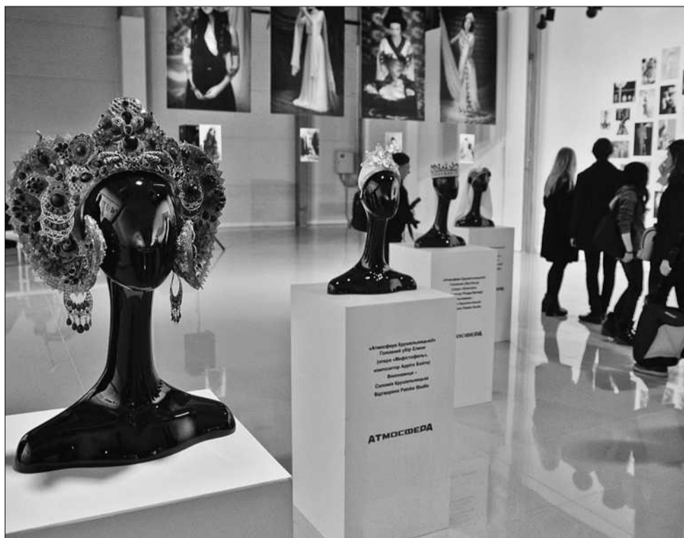
На виставці представлені кращі ілюстрації та фотографії, музика й книжки, а також історичні факти з життя Соломії Крушельницької

■ У Києві триває проект, присвячений видатній українській оперній співачці