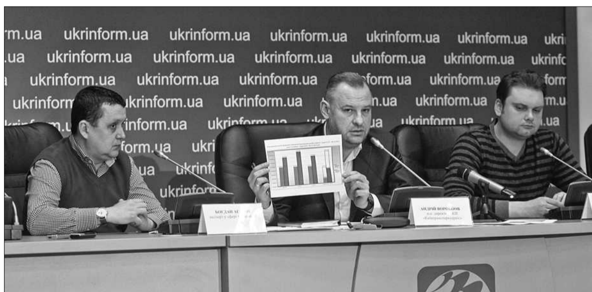
У «Київтранспарксервісі» стверджують, що внаслідок проведеної роботи лише за 4-й квартал цього року вдалося збільшити надходження до бюджету міста приблизно на 2,5 млн грн

деревину. На щастя, її в Києві вистачає. Наразі готується проектна документація. Вже наступного року будемо впроваджувати її в життя», — повідомив заступник голови КМДА. А вже ще на початку 2014-го Києву поставили завдання — знизити наполовину споживання газу. Поступово, крок за кроком, місто намагається впроваджувати альтернативні джерела опалення. Очікується, що наступного опалювального сезону дефіцит блакитного палива для столиці не стане великою проблемою ■