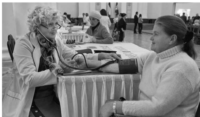
Під час акції кияни мали можливість безкоштовно визначити рівень цукру в крові, виміряти тиск, зробити ЕКГ

Цим чоловікам, які наразі лікуються в шпиталі, дуже потрібне просте людське спілкування і ваші листи: вони допомагають гоїти рани не гірше за ліки ■