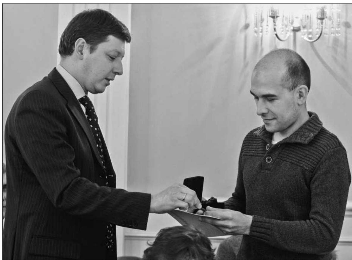
У Контактному центрі міста Києва найактивніших учасників конкурсу нагородили цінними призами

До слова, ПАТ «Київхліб» — лідер хлібопекарного ринку України. Історія підприємства налічує більше 80-ти років. Щодо підприємства випікає 500 тонн хлібобулочних виробів ■