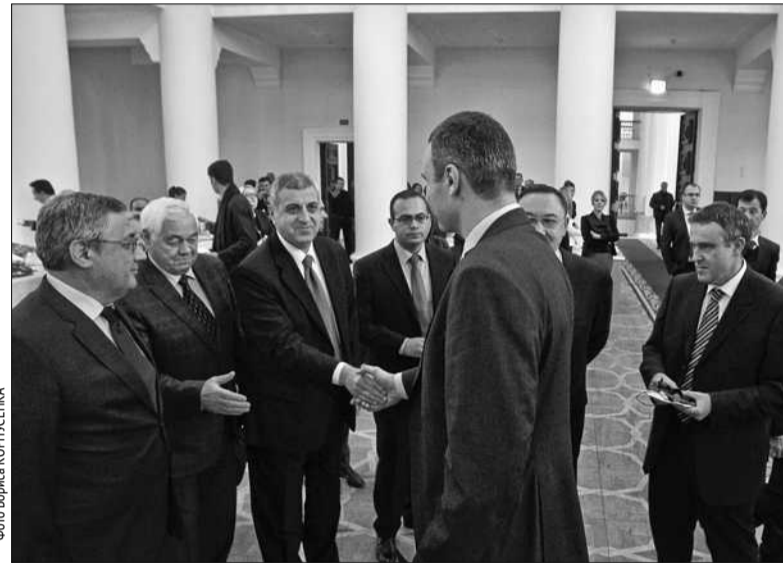
Під час зустрічі Віталія Кличка з іноземними дипломатами йшлося про створення в столиці України посольствами понад 50-ти держав своїх осередків культури: парків, скверів або ж пам'ятників з облаштованою поряд невеликою прилеглою територією

«Це для них така репетиція дорослого життя, щоб старшоклас-