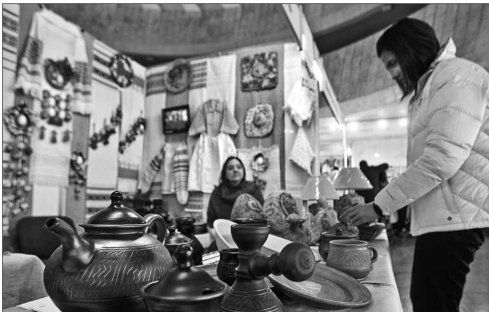
У виставці робіт народних майстрів взяли участь представники з п'ятнадцяти регіонів України

Родзинкою ж стали майстер-класи, де всі охочі могли навчитися в миттєві творити самим. І все за досить символічну плату: від 40-ка до 60-ти грн. Так, хтось приходив дізнатися секрети ткацтва, хтось — миловаріння, валяння з шерсті чи розпису на тканині олійними фарбами, були бажаючі і зробити ляльку-мотанку чи сплести виріб із соломи. І визнані майстри радо передавали свої вміння та навички різних технік народних ремесел киянам ■