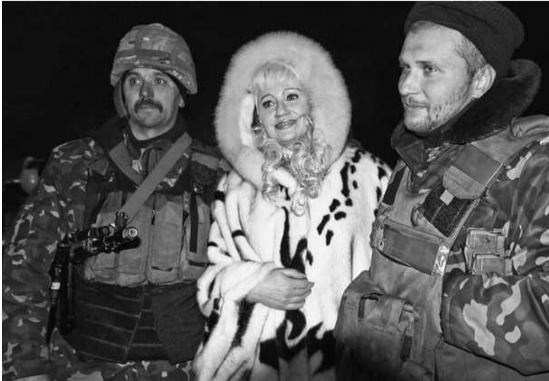
На відпочинку бійці 12-го батальйону перебуватимуть близько двох тижнів

Надворі стемніло, однак очі у всіх рідних сяяли радістю, бажанням нарешті обійняти своїх мужніх чоловіків. Зустрічати воїнів приїхало керівництво столиці України. Її очільник Віталій Кличко також радо вітав захисників Вітчизни. Вже близько 8-ї години киянські воїни прибули до військової частини у Десні. Їх зустрічали під оклики «Герої!». А українські дівчата — згід-