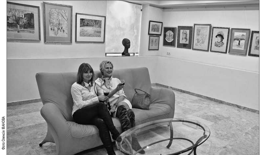
Столичний «Брей-club» покликаний стати місцем зустрічі шанувальників мистецтва