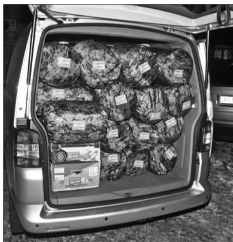
Військовим передано 20 спальників, 20 тактичних мішків, 15 пар гумових чобіт, 40 пар флісових рукавиць, пальчикові та мініпальчикові батарейки, зубні пастки, щітки, шампуні, засоби для гоління, інші предмети гігієни, цигарки, а також лимони, мандарини та яблука

ЗОКРЕМА було закуплено і передано бійцям 20 спальників, які витримують мороз до -30^{\circ}\text{C} , 20 тактичних мішків (рюкзаків об'ємом по 80 л), 15 пар гумових чобіт (витримують мороз до -30^{\circ}\text{C} ), 40 пар флісових рукавиць, пальчикові та мініпальчикові батарейки, зубні пастки, щітки, шампуні, засоби для гоління, інші предмети гігієни, цигарки, а також лимони, мандарини та яблука, — усе, на що був запит від військових. Загалом витрачено більше 50 тисяч гривень.