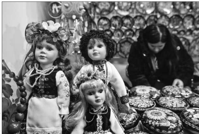
Іграшок на виставці було чимало, але, мабуть, чи не головними були традиційні українські ляльки-мотанки