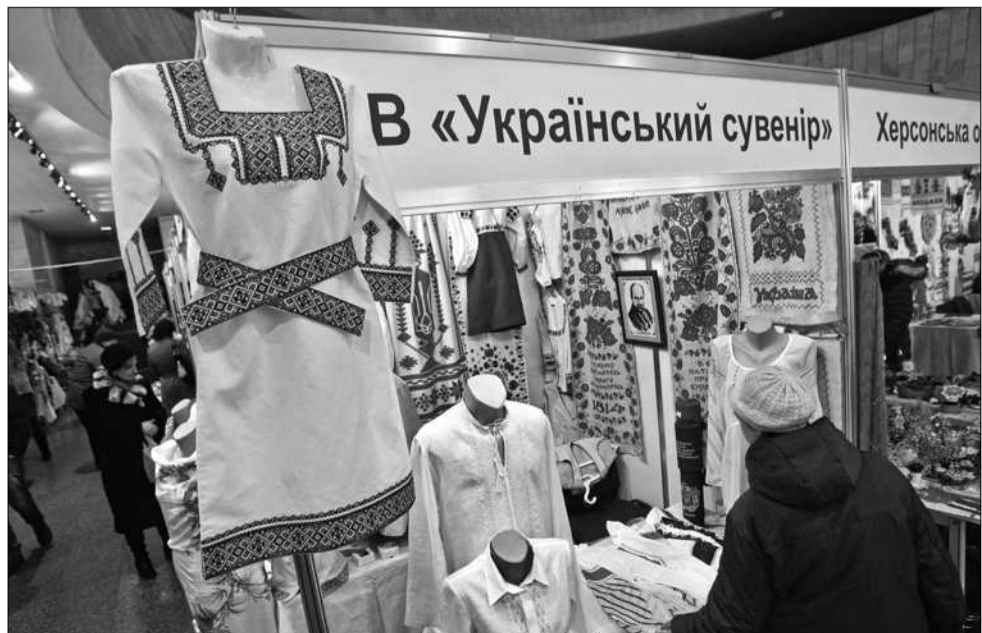
На виставці можна було придбати вишиті сорочки та сукні, картини, слов'янські обереги, сумки і листівки ручної роботи