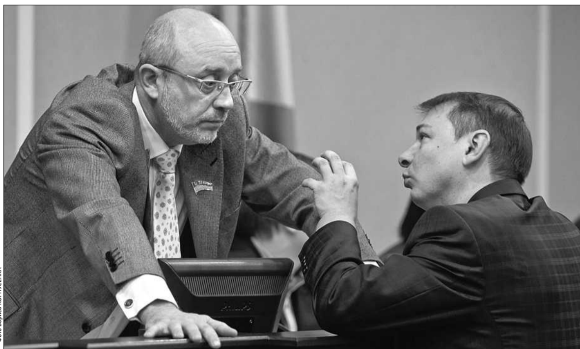
Депутати Київради оскаржують намір уряду вилучити в столиці 75 % ПДФО до бюджету-2015