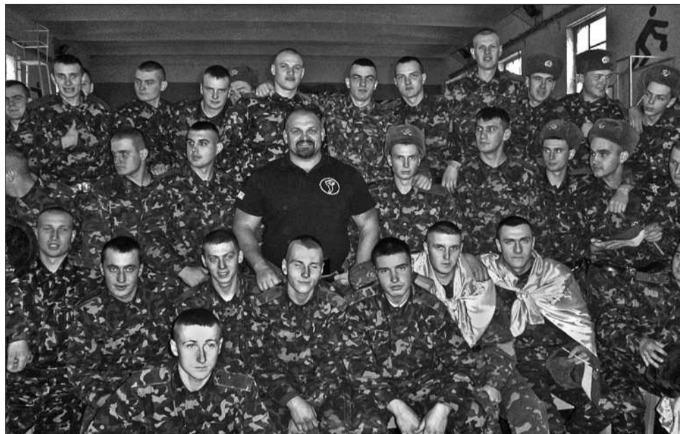
За підсумками змагань, переможці та учасники отримали призи та заохочувальні подарунки від благодійного фонду «Солом'янка» і мали можливість сфотографуватися з українським богатирем Василем Вірастюком

Військова частина А0139 отримує від фонду «Солом'янка» постійну шефську допомогу і дружню підтримку. «Солом'янци» знають про життя військових, переживають і радіють за них. Через два дні після провідів бійців в АТО відбулися змагання з багаторського багатоборства з нагоди Дня Збройних сил України. «Ігри богатирів», в яких