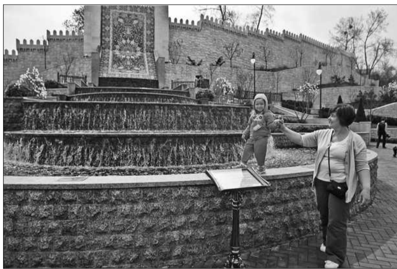
Серед реалізованих в столиці міжнародних проектів — парк Гейдара Алієва, який на вулиці Глибочицькій відкриває посольство Азербайджану

би підніжжя старовинної бакинської фортеці. Від неї — каскади водоспаду, символ життя й чистоти. Він витікає прямо з викладеної на стіні муранським склом та керамікою копії килима «Шейх Сафі». Це восьме диво світу створено в 1524 році й зберігається зараз у Британському музеї. Ну і, звісно, зустрічає відвідувачів парку пам'ятник самому Гейдару Алієву. Можливо, не такі масштабні, але точно прекрасні куточки з усіх країн світу з'являться незабаром у Києві. Про це йшлося на зустрічі міського голови Віталія Кличка із представниками іноземних по-