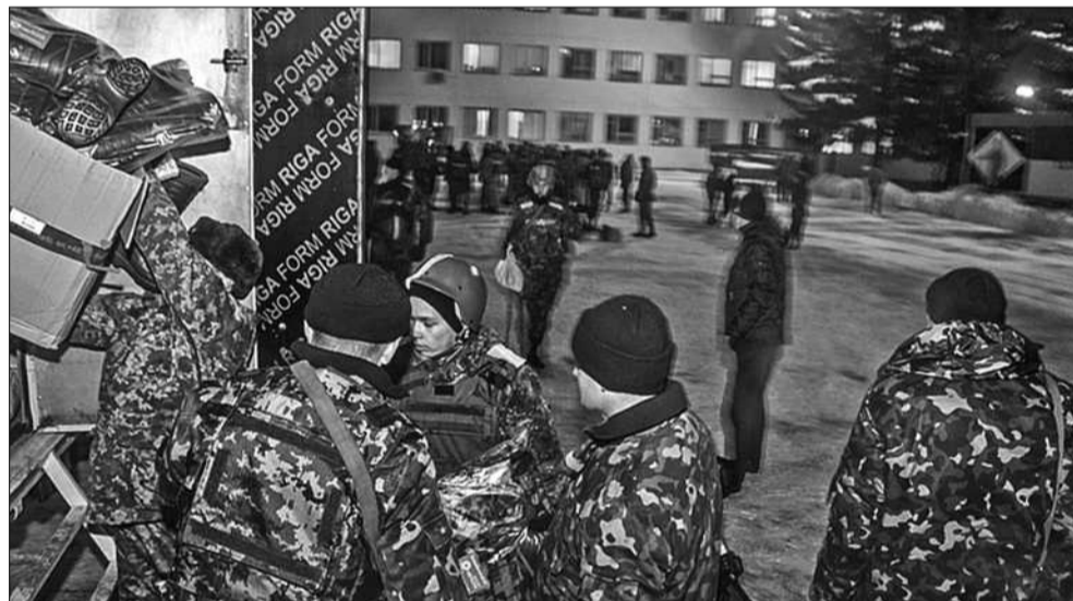
Спорядження та інші речі, які полегшать військовим службу у зимовий період, закупили активісти БФ депутата Київради Вячеслава Непоп «Солом'янка» для бійців в/ч А0139, які вирушили в зону АТО

взяли участь військові та цивільні, були організовані 101-ю окремою бригадою охорони Генерального штабу ЗСУ та військовою частиною А0139 за підтримки благодійного фонду «Солом'янка» та Федерації найсильніших атлетів України і перетягування канату. Почесний гість та суддя змагань — найсильніша людина планети Василь Вірастюк.