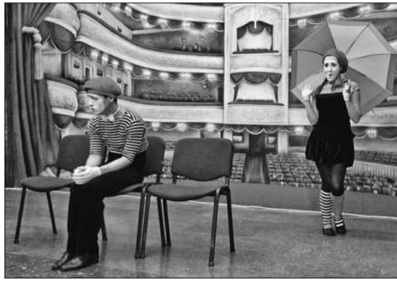
Умови та детальну інформацію про конкурс можна дізнатися за тел.: (063) 345-50-55 ■

Так, з 7 грудня 2014 року до 28 лютого 2015 року (щонеділі з 11.00 до 18.00) безпосередньо біля 3D малюнку на станції метро «Театральна» кожен охочий зможе проявити свій творчий потенціал — виконати пісню, показати театральну мініатюру, прочитати поезію або поєднати ці жанри у власному творчому баченні. Кожен виступ може тривати 5 хвилин. Найкращі ролики будуть розміщені у Youtube, соцмережах та транслюватимуться на телебаченні. Переможці отримають подарунки!