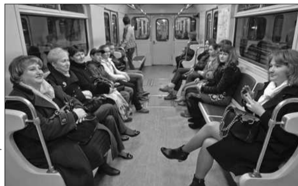
на прибуток не варто, оскільки вартість проїзду має забезпечувати нульову рентабельність ■

Його підтримує і колишній міністр транспорту Йосип Вінський. Більше того, він переконаний, що, підвищуючи тарифи, метрополітену орієнтуватися