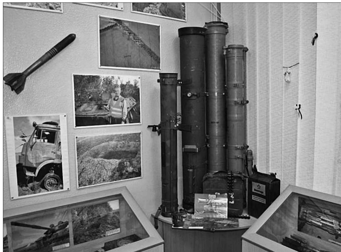
Силами пошуковців МАІФ «Цитадель» було зібрано матеріали для виставки, присвяченій війнам — минулій і нинішній

Зокрема школярі взяли участь у проекті з таких напрямків: дитячі малюнки «Новорічна ця ялинка нагадає вам домівку», листівки бійцю «Новорічно-Різдвяне побажання», збір гуманітарної допомоги «Теплі обійми». Педагогічні колективи ЗНЗ спільно з батьківською громадськістю та учнівським самоврядуванням (9-11 класи) організували збір гуманітарної допомоги. Насамперед це теплі речі — шкарпетки, рукавиці, шарфи, шапки (нові, темного кольору); чай та кава у пакетиках (стікерах); цукор (рафінований).