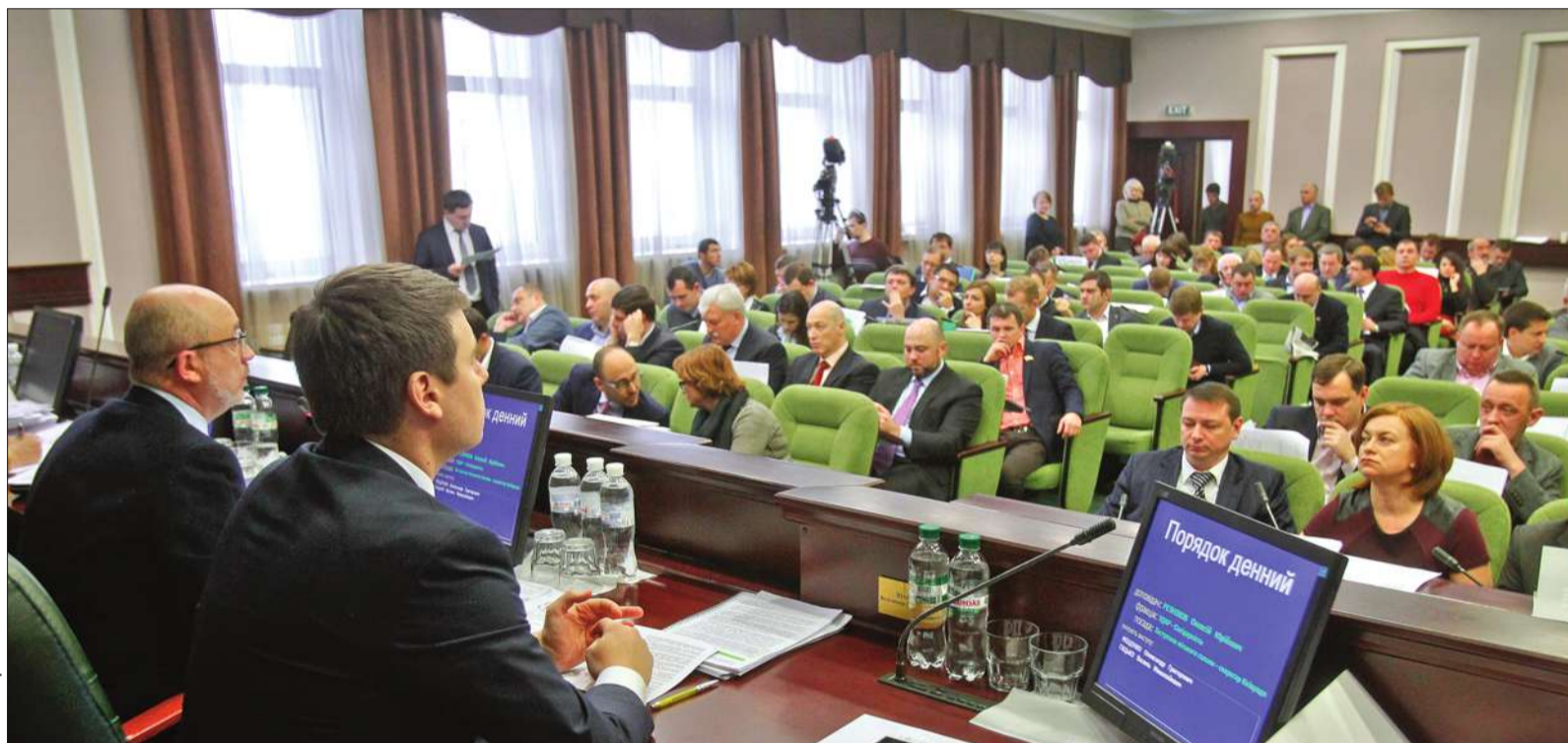
Учора депутати Київської ради прийняли рішення про те, що киянам — учасникам АТО нарешті компенсуватимуть від 340 до 1080 гривень щомісяця на сплату комунальних послуг

■ КМДА зупинила розкрадання з казни 290 тис. грн на день