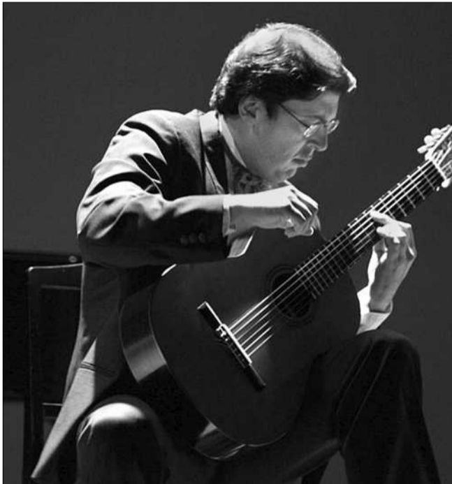
На київському фестивалі виступить один із найцікавіших сучасних італійських гітаристів Джованні Пудду

12 грудня фестиваль гітарної музики «Київ-2014» відкриє виступ лауреата міжнародних конкурсів Франсиско Берньєра (Іспанія). Він виконає твори Ф. Сора, Й.-С. Баха, А. Г. Абрілья, І. Альбеніса, А. Барріоса та Ф. Таррегі. У суботу один з найцікавіших італійських гітаристів Джованні Пудду, який, окрім сучасного матеріалу, захоплюється маловідомими творами XIX століття, підготував програму з музики С. Л. Вейса, Й. К. Мерцца, А. Барріоса, Б. Бріттена, М. Джуліані. У заключному концерті фестивалю, 14 грудня, візьмуть участь обидва виконавця, заслужений артист України Андрій Оста-