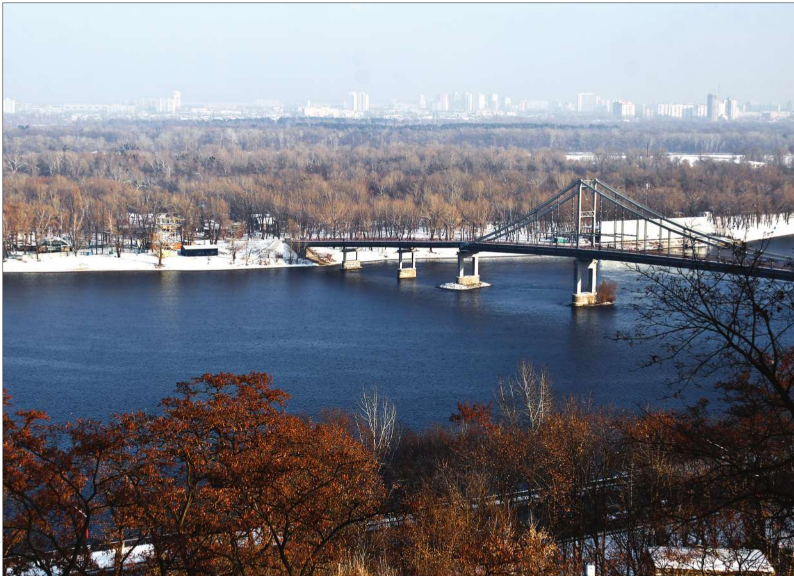
Активісти обіцяють створити на Трухановому острові сучасну інфраструктуру для занять різними видами спорту, велодоріжки та велопрокат, бігові доріжки, триатлонну базу, залучаючи при цьому не бюджетні, а інвесторські кошти

■ За співпраці влади та громади острів стане справжнім місцем відпочинку для мешканців столиці