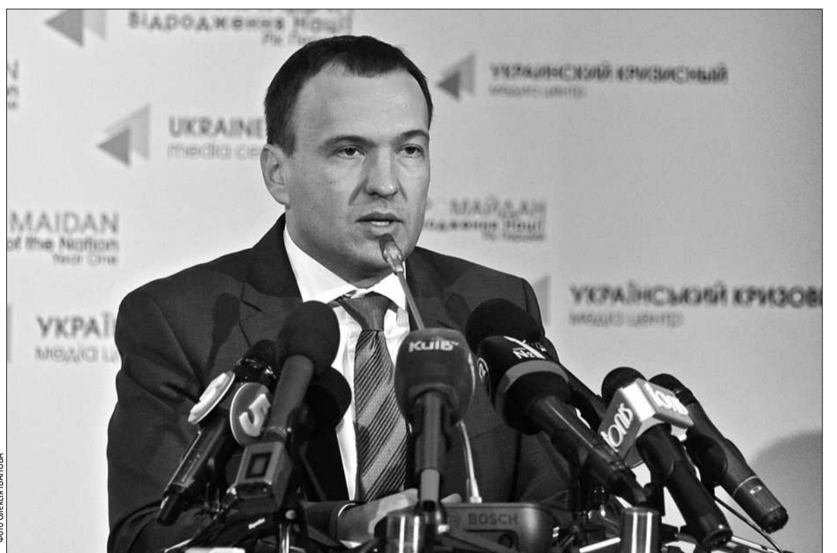
Заступник голови КМДА Петро Пантелеєв наголосив, що наразі жорстко стоїть завдання на місцях навести порядок в наявній системі житлово-комунального господарства міста та забезпечити надання якісних послуг киянам

садовець, — оскільки існує розрахунковий принцип забезпечення штату обслуговуючої організації: певну кількість будинків за нормативами повинні обслуговувати відповідна кількість дворників, майстрів, слюсарів та інших працівників. Однак буде скорочено керівний склад та їхні службові витрати. ЖЕКи ж залишаться за звичним для киян територіальним розташуванням», — пояснив він.