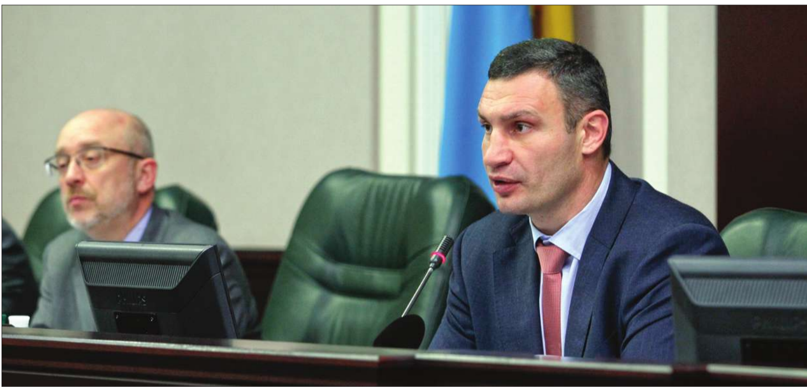
За словами Віталія Кличка, заборгованість Кабміну перед столицею за захищеними статтями нині досягла 153 млн грн. Тому одна з умов підписання коаліційної угоди, яку висуває міська влада, — щоби 100 % податку на доходи фізичних осіб залишалися у Києві

■ Київрада вимагає залишити у столичному бюджеті зароблене містом, оскільки через недофінансування вже постає питання «життя і смерті»