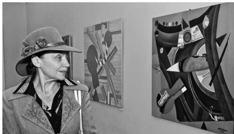
Розшифрувати візуальні коди та символи, що лежать в основі багатомірних робіт майстра - справа непроста

Виставка «Діалоги» триватиме в Національному музеї Т. Шевченка (бул. Т. Шевченка, 12) до 23 листопада, вт. - нд, з 10.00 до 18.00. Вартість квитка: 15 грн, для школярів, студентів, пенсіонерів — 7 грн ■