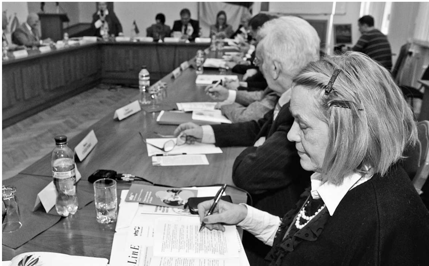
Крім обговорення актуальних проблем, проведення пленарних засідань та виставок, було підписано угоду про співпрацю між НАПН України та представництвом Інституту з міжнародного співробітництва німецької Асоціації народних університетів (DVV International)