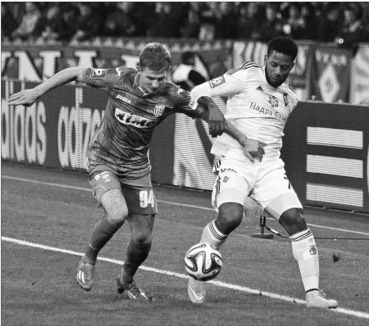
У пертій боротьбі ані футболісти «Динамо», ані гравці «Карпат» так і не змогли відкрити рахунок