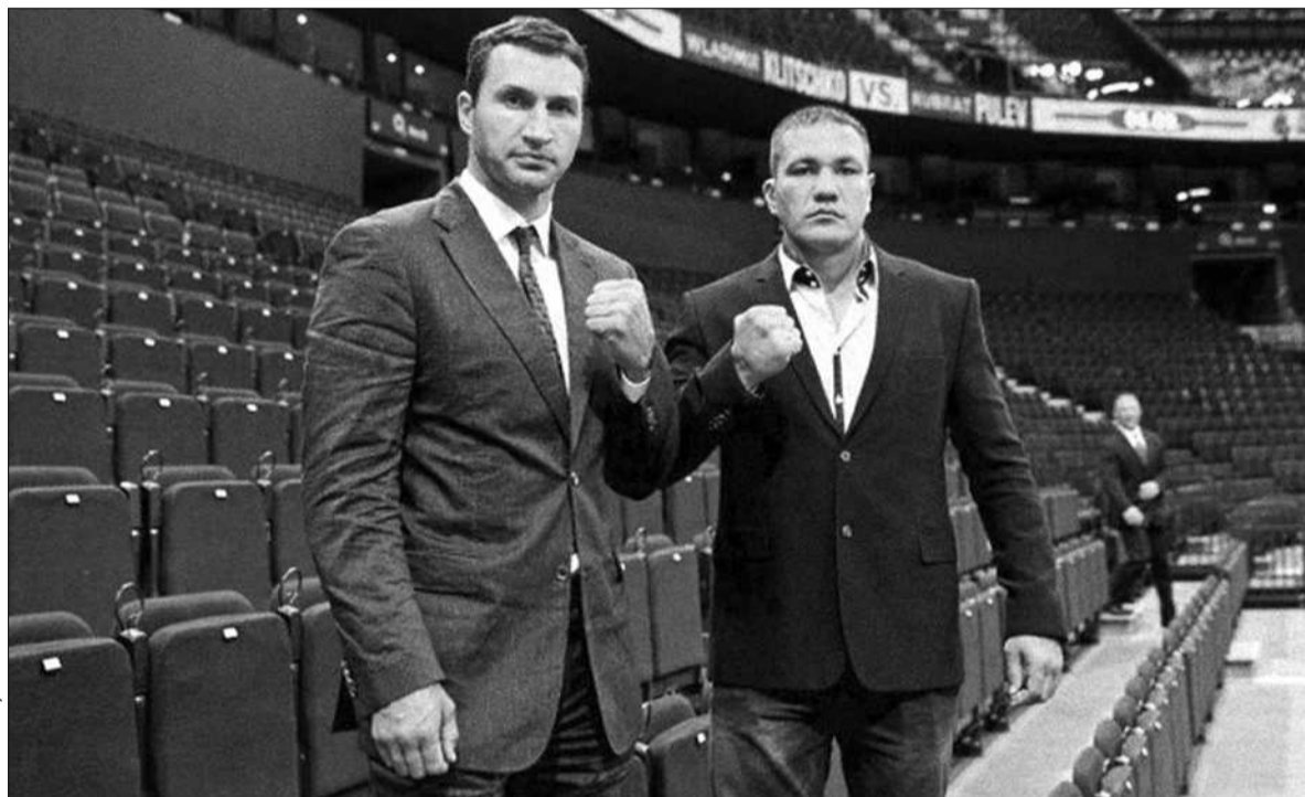
Українець Володимир Кличко і болгарин Кубрат Пулев позмагаються одразу за 4 чемпіонські пояси: WBO, WBA, IBF, IBO

Слова про відсутність страху перед іменитим суперником підтвердив і сам Кубрат Пулев. «Я був біля рингу, коли Володимир захищав свої пояси. Це була для нього «прогулянка в парку». Можу сказати, що коли Кличко зустрі-