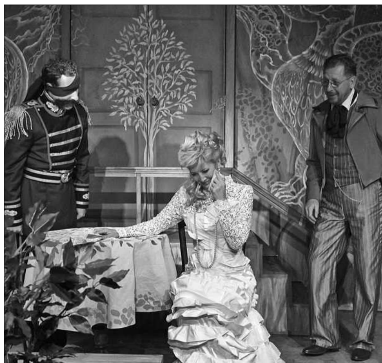
В маєтку поміщиці Гурмижської герої спектаклю плетуть інтриги, зваблюють і заважають щастю закоханих

річчя якого від дня народження, між іншим, відзначають сьогодні в Україні і в світі), Сонату на три частини Ігоря Стравінського та Шість прелюдій (із першого зошита) Клода Дебюссі. Початок концерту 15 листопада о 19.00. Вартість квитків 45-130 грн ■