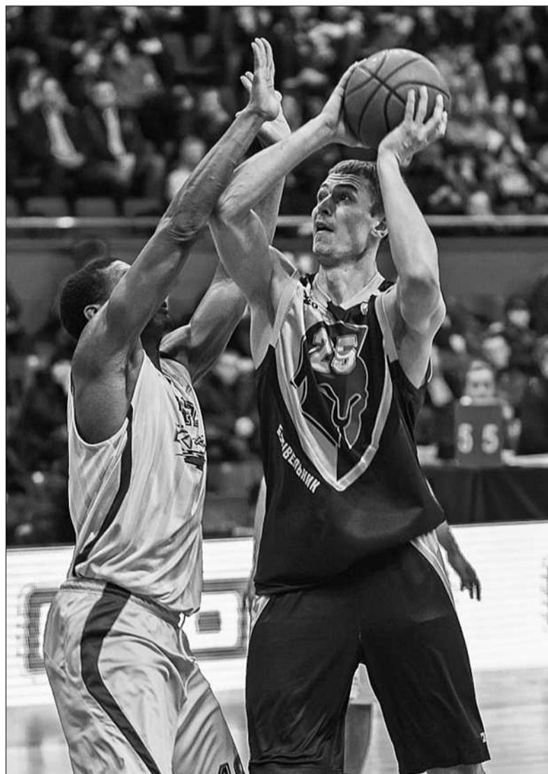
Після невдалого старту у Суперлізі чинний чемпіон першості «Будівельник» продовжує впевнено перемагати суперників

Нагадаємо: раніше бій Кличко-Пулев був перенесений через травму українського спортсмена з 6 на 15 листопада ■