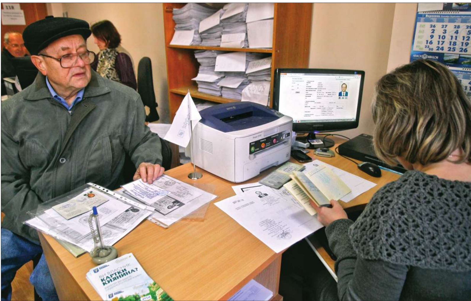
На сьогодні вже понад 101 тисяча пільговиків, які мають право на безоплатний проїзд в метрополітені, отримали «Картку киянина». Ще 6 тисяч одиниць соціального «пластику» — в процесі видачі. Всього отримати його мають 126 тисяч киян

Понад 100 тисяч мешканців столиці вже отримали «Картку киянина» для безоплатного проїзду в метро