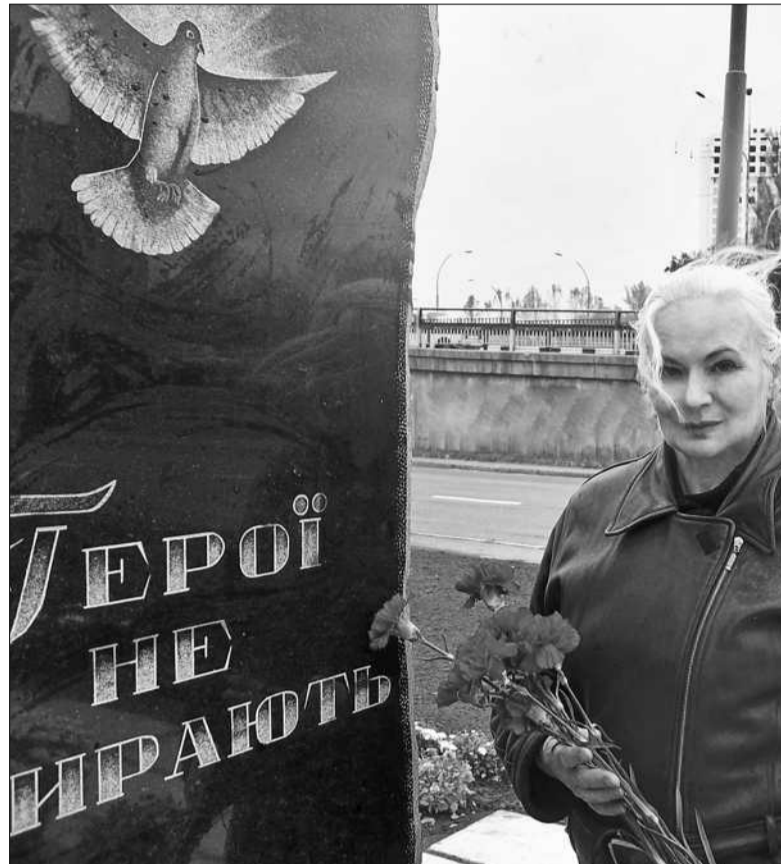
У Голосіївському районі столиці на Теремках-1 урочисто відкрили пам'ятник Героям Небесної Сотні

з визначних подій у їхньому житті. Вчили вірші, які декламували на урочистостях: дівчатка були у вишиванках та віночках, а хлопці у камуфляжу — як справжні військовики. Чимало з них були свідками трагічних зимових подій. І хоча Теремки є досить віддаленим, тихим «спальним» районом від подій у середмісті, ніхто цієї зими не лишився осторонь. Мешканці його були не лише свідками, а й активними учасниками Євромайдану. Вони розповідали, що майже щодня приходили на Майдан. Зокрема 18 лютого, коли зупинили метро, багато кілометрів пішки діставались до мівки, а на ранок — знову до центру міста (вже на маршрутках, яких