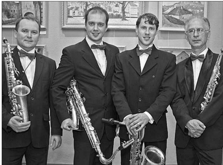
У середу перший сезон проекту "Нова філармонія" відкриє концерт Київського квартету саксофоністів

ПРИНЦИПОВО нові проекти у сфері класичної музики — явище рідкісне. Хороші проекти — явище ще більш незвичне. Тому будь-яка ініціатива в цій царині, як мінімум, заслуговує на повагу. Погодьтеся, претендувати на статус «нової філармонії», отже, у певному сенсі, альтернативної і конкурентоздатної до філармонії вже діючої є серйозною заявкою. Організатори визнають, що «Нова філармонія» — амбітний проект, і стверджують, що «головну мету своєї діяльності вбачають у підтримці талантів України і у формуванні нової генерації слухачів класичної музики через їхнє залучення до світової та української музичної спадщини». Благородна мета. Але чим вона принципово відрізняється від мети будь-