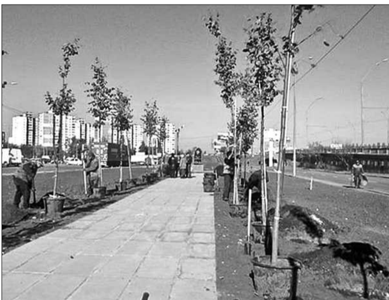
Поряд з монументом мешканці облаштували затишний скверик

Світлана БАДЕРА спеціально для «Хрещатика»