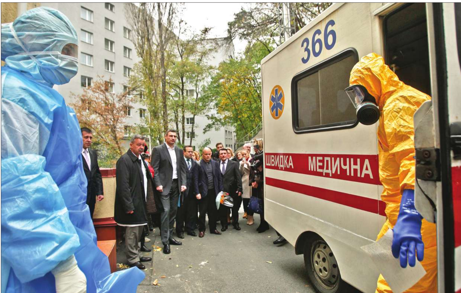
Вчора столичні медики разом з працівниками всіх дотичних служб міста на практиці тренувалися максимально швидко та ефективно приймати хворого з підозрою на Еболу

■ У столиці провели навчання щодо локалізації вірусу