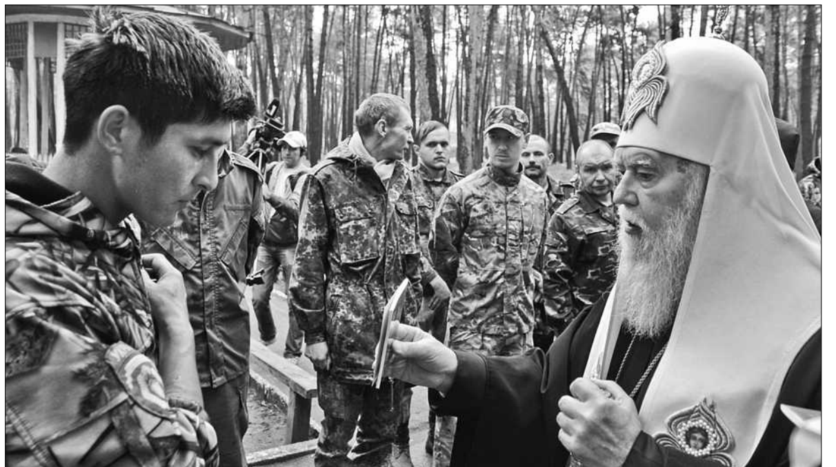
Святійший Патріарх Київський і всієї Руси-України Філарет передав бійцям добровольчого батальйону «Донбас» теплий одяг та молитовники, а також провів молебень за перемогу над ворогом

Раніше Київський Патріархат допомагав армії фінансово — через Міністерство оборони, проте згодом досвід показав, що передавати матеріальну допомогу безпосередньо у підрозділи швидше та ефективніше ■