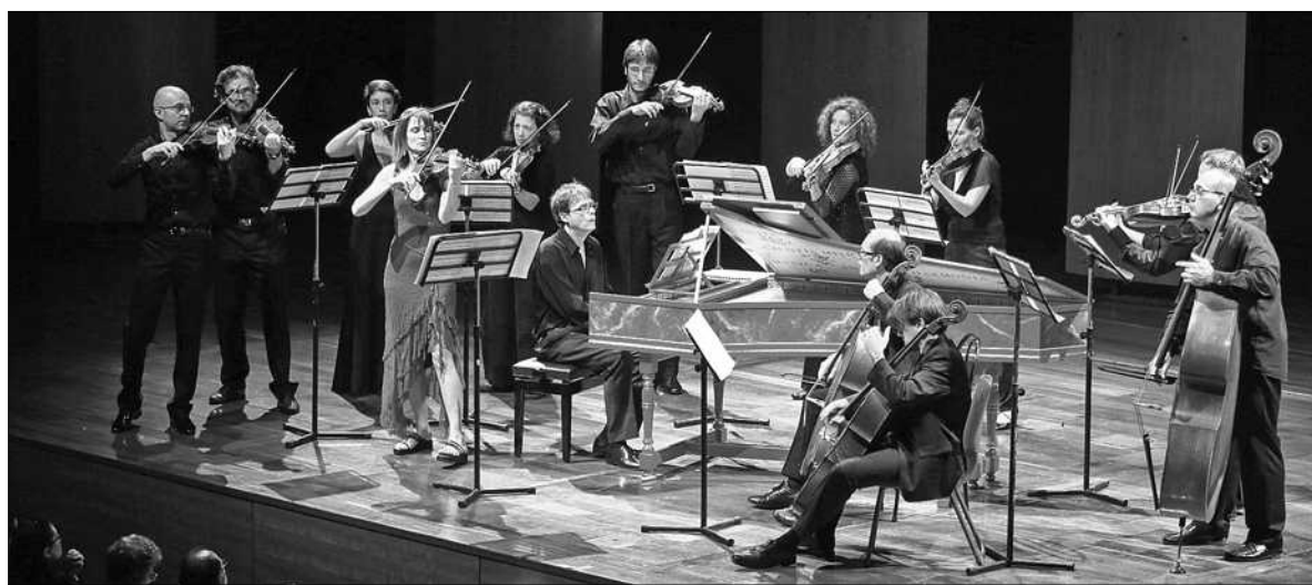
Відкриє фестиваль концерт ансамблю "Accademia Bizantina", на якому прозвучать твори Кореллі, Вівальді та Локателлі

Головна перевага «Italia Festival Barocco» однак не в тому, що у нас