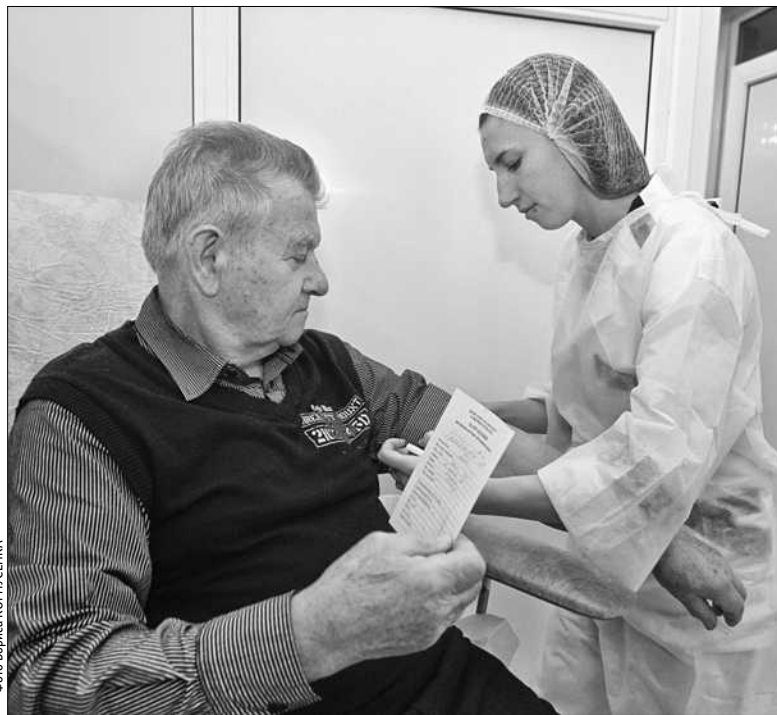
Впровадження моделі муніципального страхування захищатиме права не лише пацієнтів, а й лікарів

Забезпечувати таке страхування буде муніципальна компанія,