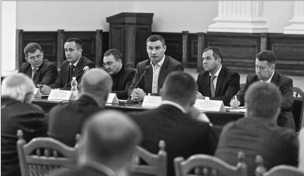
Під час засідання регіональної ради столичних підприємців мер Києва Віталій Кличко зазначив, що міська влада має намір проводити зустрічі з бізнесменами регулярно

Власники малого та середнього бізнесу шукали домовленості з керівництвом міста