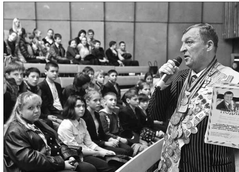
На зустріч з легендарним фехтувальником Юрієм Чижом прийшло близько 400 школярів столичних шкіл

Цього тижня «Чемпіонський урок» завітав до Київського палацу дітей та юнацтва, де на нього чекали близько 400 дітей. Окрім традиційної розповіді про свої спортивні здобутки, Юрій Чиж презентував дуже актуальний музичний кліп-звернення «Повертайся живим». Він присвячений бійцям АТО, які, не шкодуючи ані сил, ані своїх життів, боронять нашу країну від агресорів. Варто зазначити, що в кліпі знялися зви-