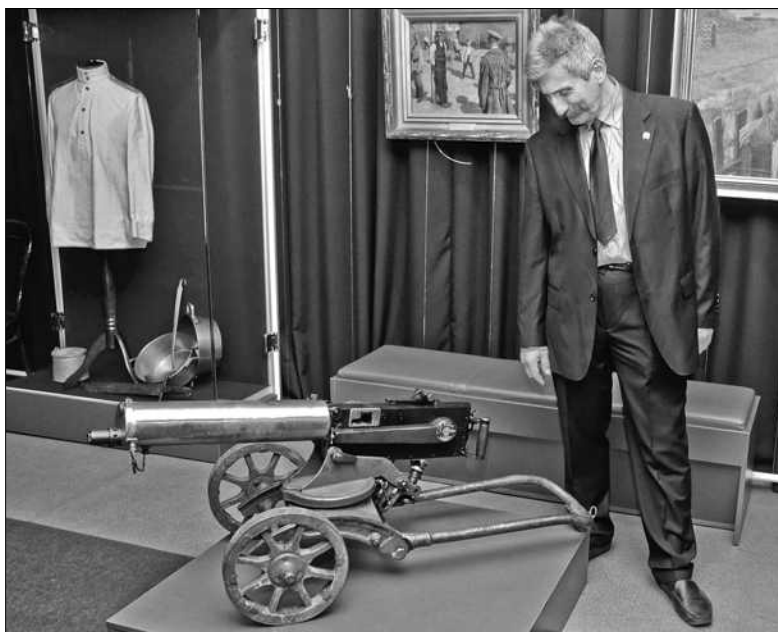
Історію сторічної давнини розповідають унікальні експонати: документи, світлини, одяг, побутові речі та навіть зразки зброї