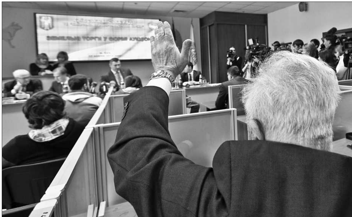
Відчора столична влада відновила в Києві земельні торги з продажу ділянок комунальної власності

ЗЕМЕЛЬНІ торги у формі аукціону — явище для бізнесменів Києва трохи підзабуте, адже останні в місті проводилися аж шість років тому. Тож і довіри до них небагато — на аукціон було винесено шість ділянок загальною площею 23,16 га, які схвалила Київрада, однак достатня кількість заявок надійшла лише на одну з них. «На жаль, не так багато заявок від учасників. Очевидно, багато киян не можуть уявити, що столичну землю можна купити прозоро і публічно на відкритих торгах», — зазначив перед відкриттям аукціону Київський міський голова Віталій Кличко.