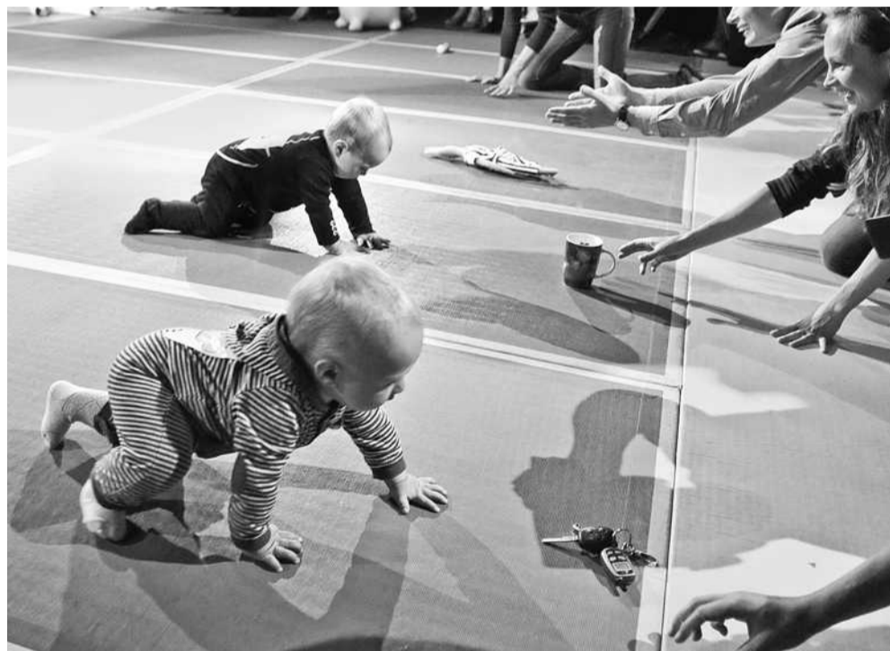
Мами і тата підбадьорювали учасників «гонки», використовуючи для цього іграшки і телефони, і навіть справжні ключі від автомобілів

Радість зустрічей та смак перемоги роблять цей фестиваль неповторним і спонукають їхати на «ЗОСю» знову і знову ■