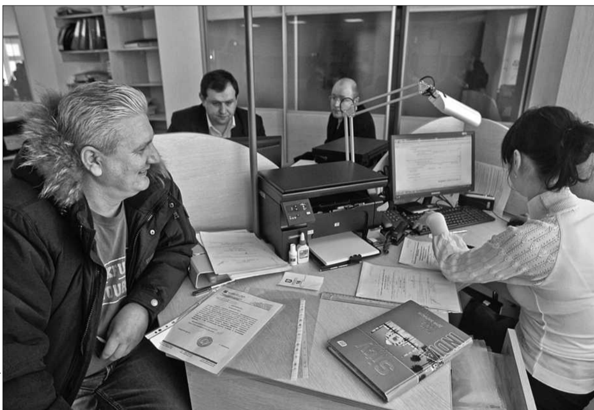
В центрах надання адміністративних послуг міста Києва з 1 жовтня можна отримати або обміняти паспорт, отримати послуги з реєстрації місця проживання

■ Центри надання адміністративних послуг продовжують працювати у посиленому режимі