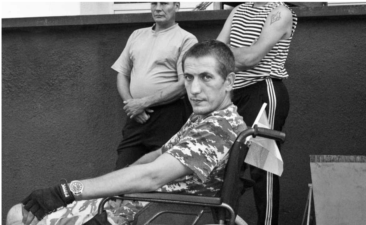
До Харківського шпиталю потрапляють в основному бійці з важкими пораненнями і травмами

Він додав, що евакуація здійснюється двома способами. Важкі хворі, як правило, перевозяться вертольотами. Частину евакуюють до Ізюмської центральної районної лікарні, а звідти їх вивозять санітарним транспортом. Більшість гелікоптера-