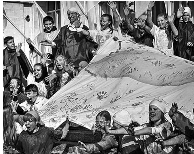
Цьогорічний фестиваль прийняв тисячу учасників з України, Білорусі, Польщі. Найчисельнішими були команди з Києва і Славутича

Три дні наполегливого пошуку інформації, творчих експериментів, майстер-класів та зустрічей із професіоналами у своїй справі