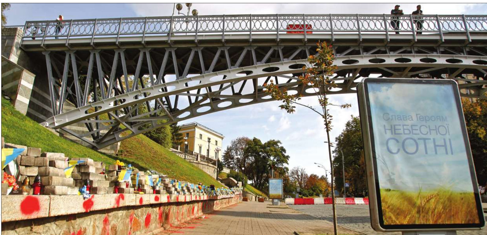
До 20 жовтня в столиці тривають слухання щодо перейменування вулиці Інститутської в Героїв Небесної Сотні, і на сьогодні переважна більшість киян, які взяли участь в обговоренні й голосуванні, виступили за перейменування вулиці Інститутської

■ У Києві планують відновити історичні назви вулиць та позбутися спадку тоталітарного минулого