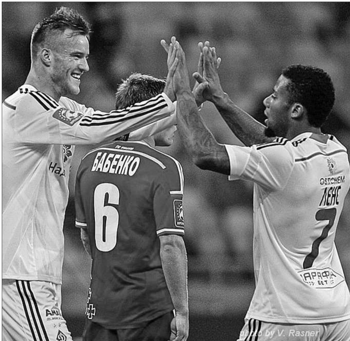
Завдяки впевненій перемозі над луцькою «Волиньню» київське «Динамо» наблизилось до лідерів чемпіонату на відстані 1-го пункту