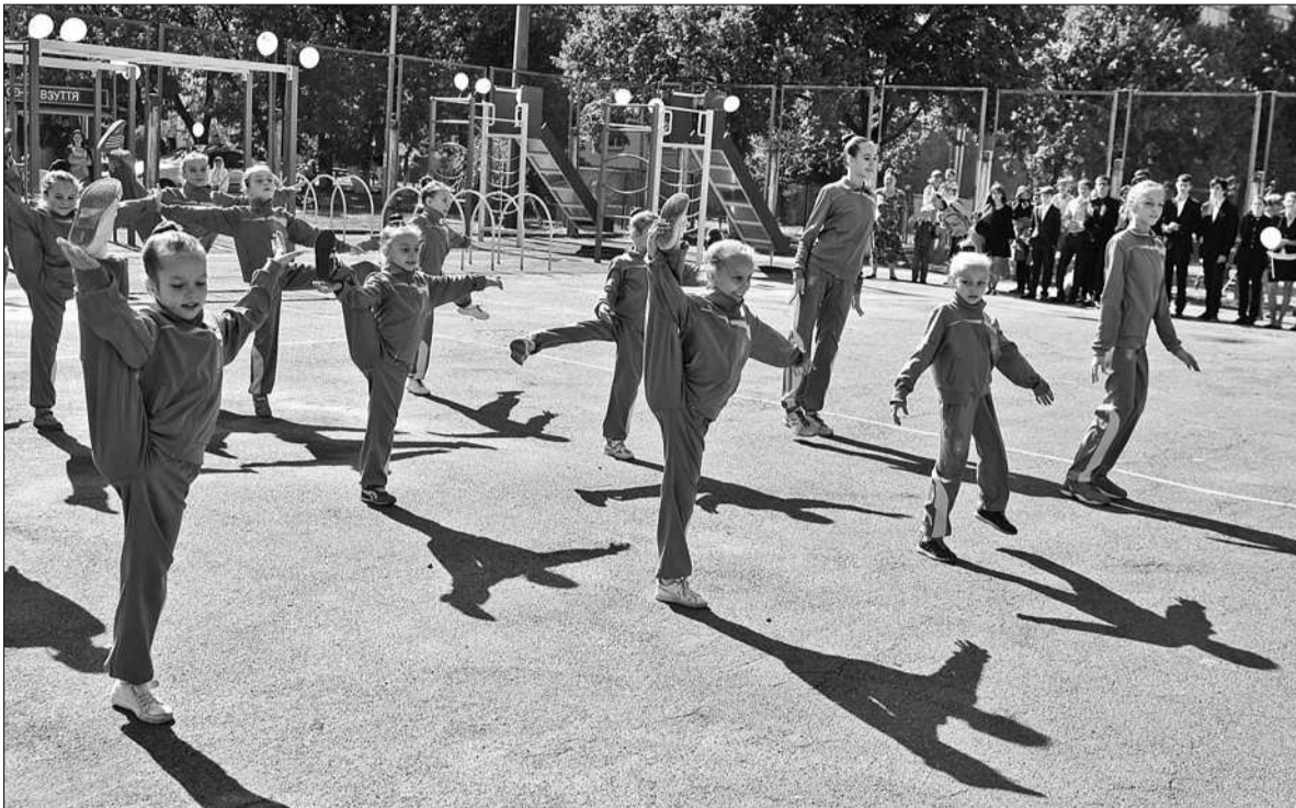
Дирекція школи та спонсори проекту не виключають можливості проведення повномасштабних спортивних заходів не лише між класами учбового закладу, а й навіть між школами міста та України