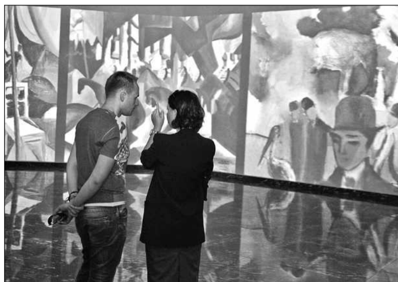
Завдяки великим масштабам проєкції — від підлоги до стелі — відвідувачі мають змогу роздивитися твори до найменших дрібниць

Вхід на усі заходи фестивалю, окрім спеціально зазначених випадків, вільний. Розклад концертів шукайте на сайті Національної спілки композиторів ( www.composersukraine.org ) ■