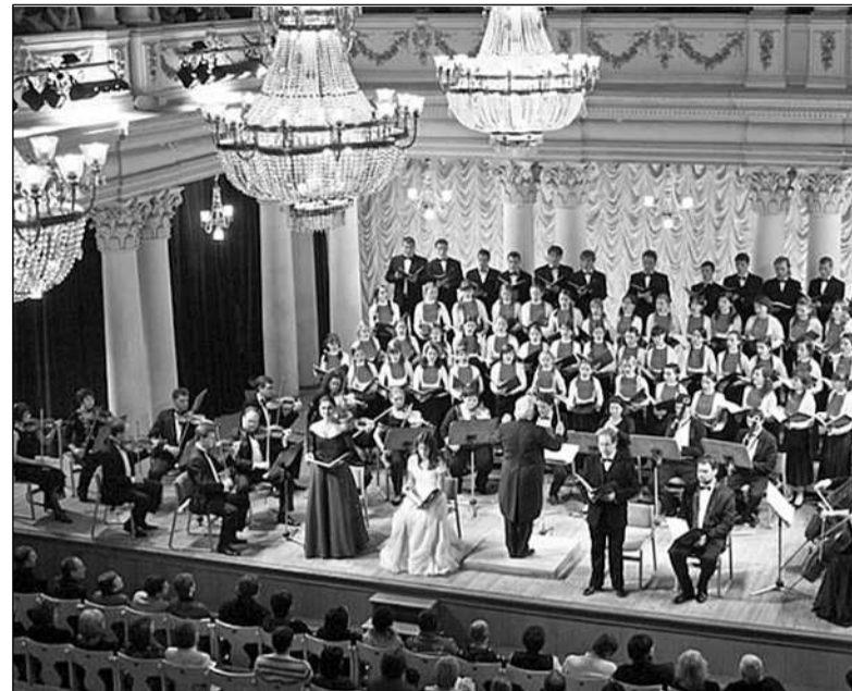
В програмі фестивалю — 20 концертів, серед яких 4 симфонічних, 2 вокально-симфонічних, 5 хорових та 7 камерних

4 жовтня в рамках проекту «Сучасна музика країн Балтії» (Будинок вчених НАН України, 16.00) прозвучать твори литовських і естон-