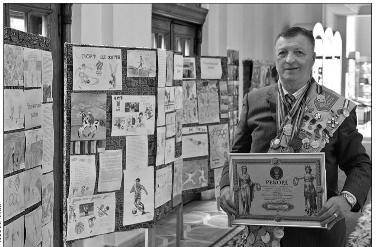
Легендарний вітчизняний фехтувальник Юрій Чиж провів вже понад 1300 зустрічей з дітьми

Примітно, що такі уроки дають можливість забути про жахи, які пережили біженці з зони АТО, а саме: з Донецька, Харцизька, Первомайська, Червонограда, Горлів-