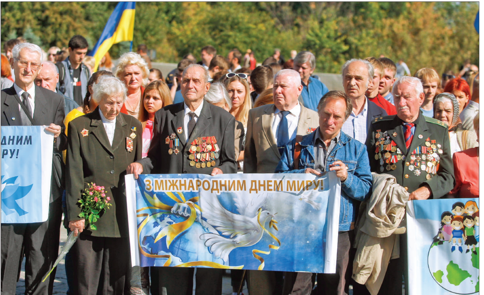
У столиці участь в марші миру взяли представники різноманітних громадських організацій, молодь, ветерани ВВВ, депутатський корпус Київради та міські посадовці

Весь світ підтримав Україну в прагненні до спокою