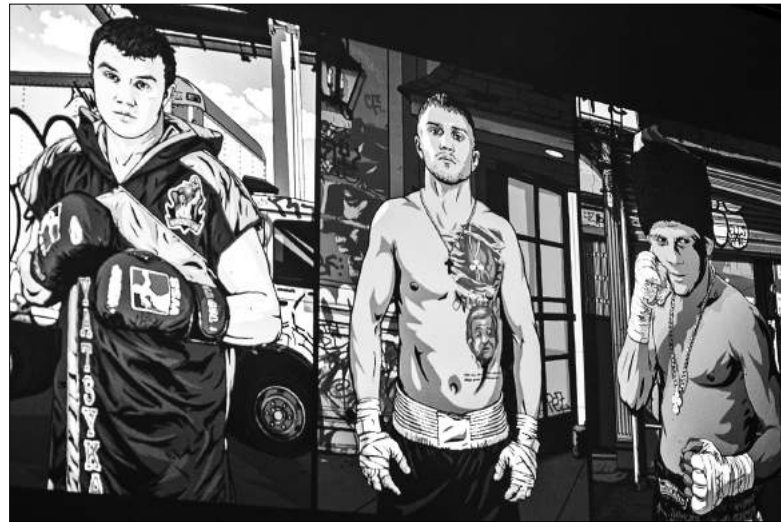
Перші календарі HEROES присвячені людям, які своє життя цілком присвятили спорту

Я кожен день зустрічаюся з різними людьми з різних сфер життя. Управлінці, вчителі та лікарі, працівники ЖКГ та спортсмени. Серед них багато здібних, чуйних, добрих