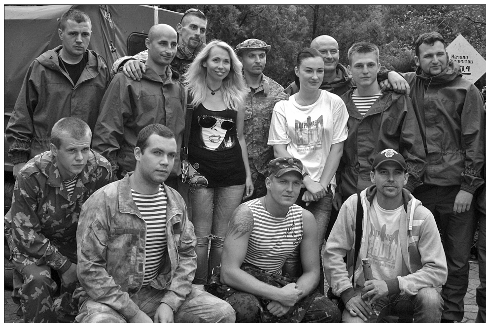
Приїзд артистів із Києва викликав справжній фурор серед військових

«Один офіцер просто плакав. У нього душа боліла всередині. У нього було 33 бійці, а залишилися — 8... Поранені й убиті... Чоловік, людина, воїн, метр вісімдесят на зріст, а плаче, як дитина. І все питає в мене: «Батьюшко, що робити? Як жити?!». Я, як міг, заспокоїв його, він попросив помолитися, освятити його бійців. Ми разом помолились, освятили. І було видно, що йому стало легше, якийсь тягар з його душі спав. Але бувають випадки, коли ти просто не можеш дати відповідь. Я поговорив з солдатом, офіцером і відчуваю, що не зміг до нього достукатися, і біль, тривога продовжують крутитися у нього всередині. За солдатів молюсь не лише я, а й усі священники, й ці молитви їм теж допоможуть. А наше суспільство, я думаю, взагалі змінить ставлення до військових. Престиж військового повинен бути дуже високим. Я бачив по телевізору кілька дуже хороших рекламних роликів, вони піднімають дух патріотизму, гордості за нашу армію. І я пишаюся нашими солдатами».