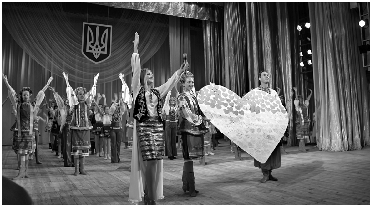
У столичному Палаці дітей та юнацтва відбулася благодійна акція «Діти - дітям!», покликана підтримати дітей-переселенців зі сходу нашої країни