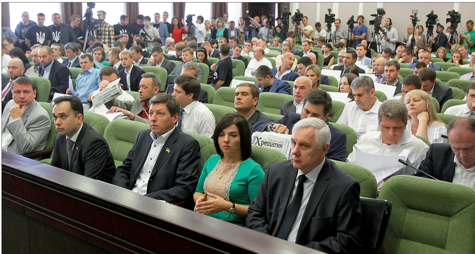
На вчорашній сесії Київради найбільше ажіотажу викликали земельні та «кіоскові» питання

■ На сесії Київради найбільше ажіотажу викликали земельні та «кіоскові» питання