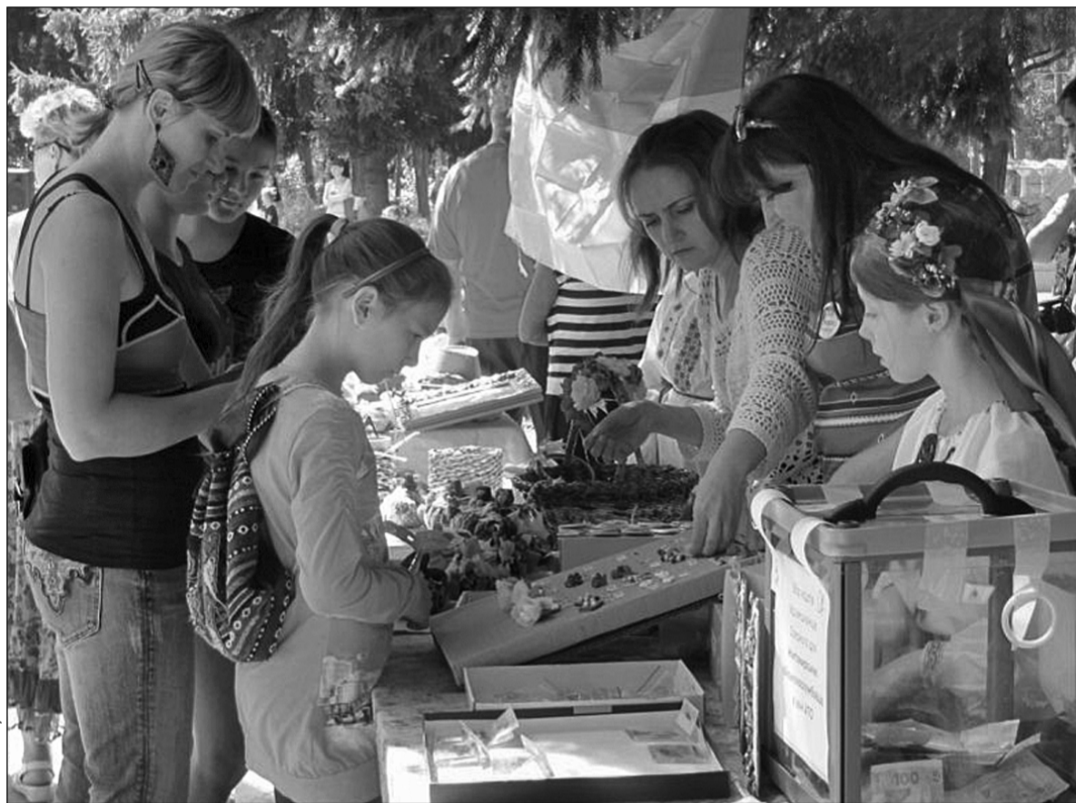
Відвідуючи різні події, кияни мають змогу надати фінансову та іншу підтримку хворим, переселенцям із зони АТО та військовим

7 вересня у козацькому селищі «Мамаєва Слобода» організують благодійну акцію з підтримки української армії. В програмі заходу: виступи кобзаря Олександра Гончаренка, композитора Алли Мігай, Київського академічного театру українського фольклору «Берегиня» та кращого кінного каскадерського підрозділу українських козаків під орудою наказного отамана Олега Юрчишина.