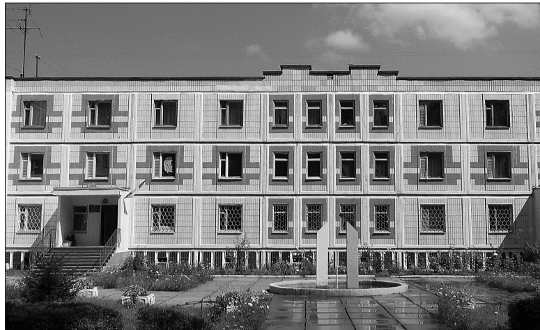
Пілотний проект з утеплення, опалення, забезпечення гарячим водопостачанням дитячого садка «Пролісок» буде здійснено за допомогою альтернативних джерел енергії