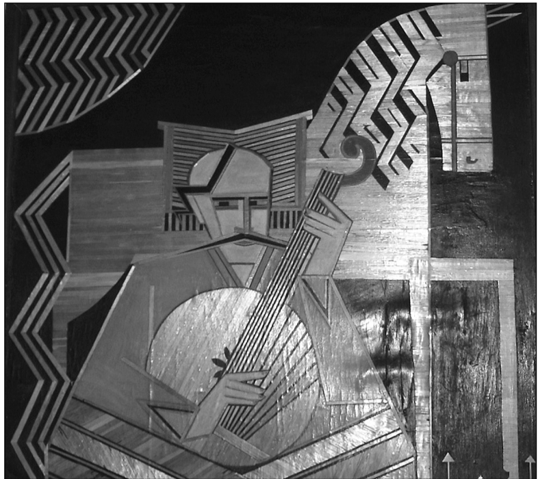
В рамках проекту виставлена електронна копія роботи Олександра Саєнка "Козак Мамай" 1928 року

ЦДАМЛМ України — без перебільшення найбагатше в державі сховище культурного профілю. Сьогодні в архіві-музеї зберігається 1 403 фонди, більша частина яких — особові документи письменників, музикантів, мистецтвознавців, художників, архітекторів, скульпторів тощо. Зокрема музейних експонатів (особистих речей, предметів побуту), які потрапляють на зберігання до архіву-музею разом з документальною спадщиною митців, сьогодні налічується понад 17 тисяч.