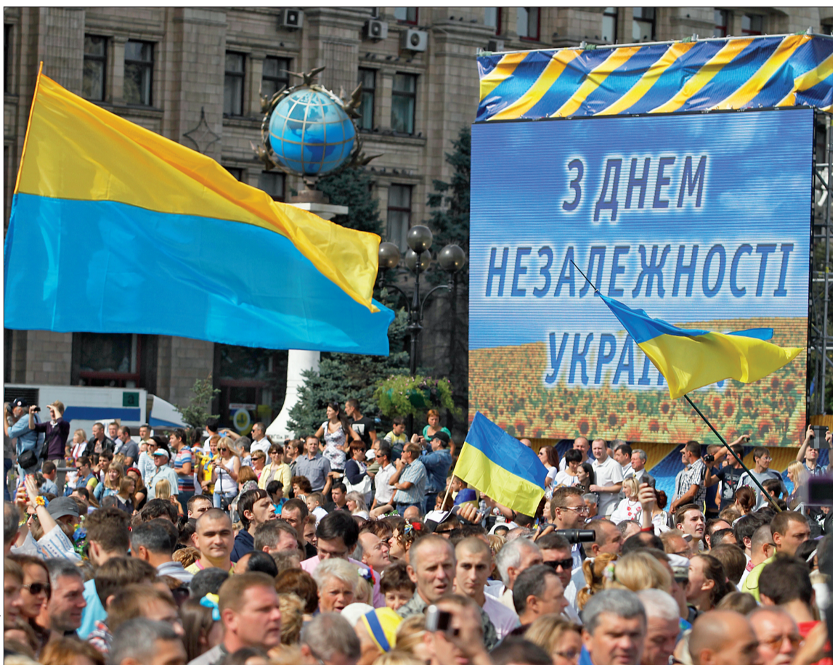
На День незалежності цього року столицю та всю країну охопила справжня святково-патріотична ейфорія

Презентацію боєготовності нашого війська оцінювали перші особи держави та її столиці.