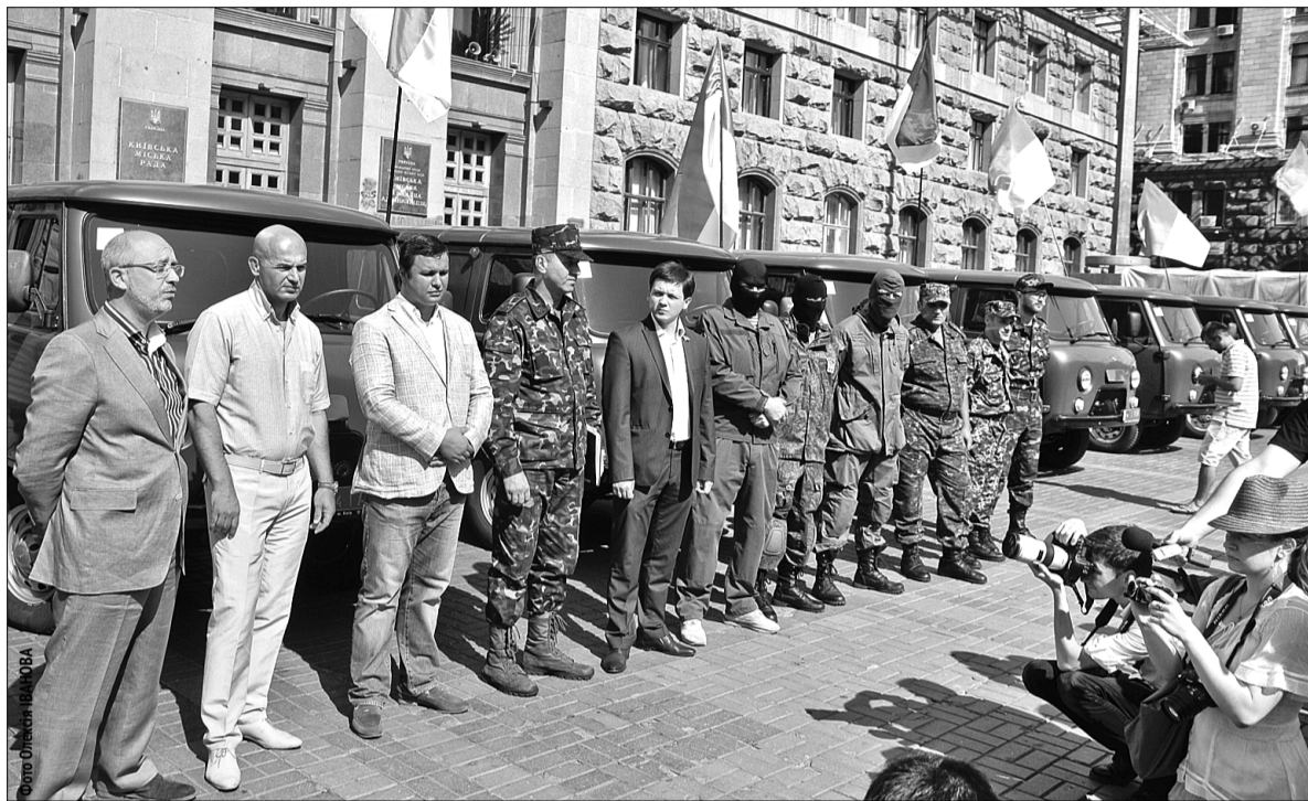
Депутати Київради з фракції «УДАР - Солідарність» днями передали на потреби військовим десять автомобілів

■ Київські депутати купили автомобілі для потреб військових