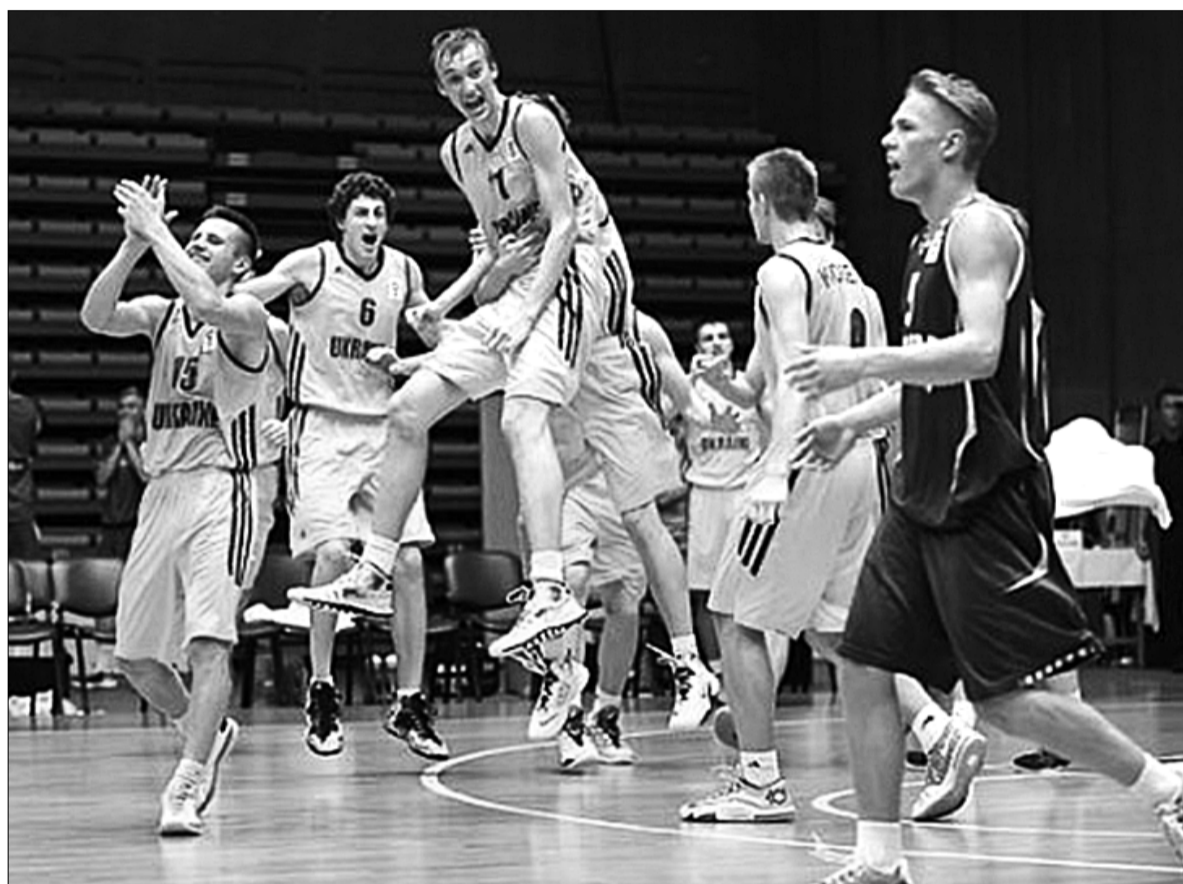
Юнацька збірна з баскетболу U-18 виграла 7 з 8 матчів на перших двох групових етапах