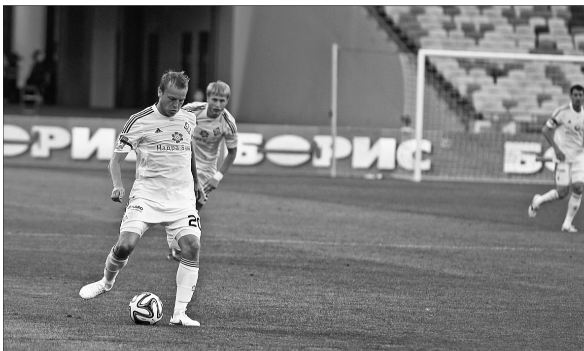
У центральному матчі 2-го туру чемпіонату України кievське "Динамо" на виїзді здолало харківський "Металіст" з рахунком 2:1