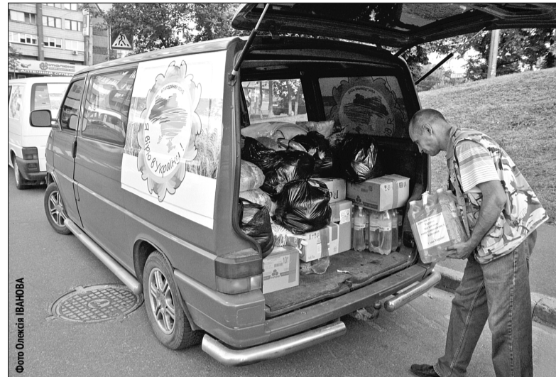
Нещодавно з Голосіївського району столиці у зону проведення антитерористичної операції відправили чергову колону гуманітарного вантажу, вага якого перевищила 25 тонн

До речі, нині в АТО беруть участь майже 3,5 тисячі киян ■