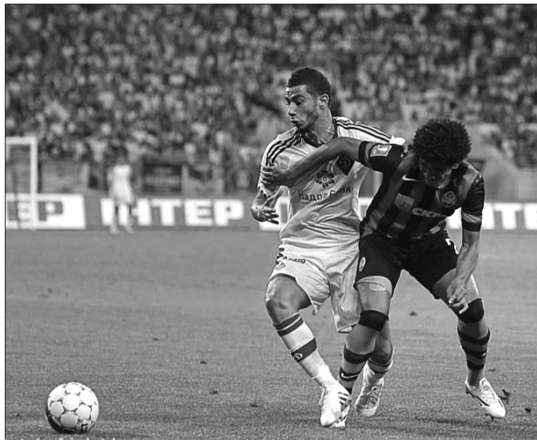
Київське «Динамо» не змогло порадувати своїх вболівальників перемогою над принциповим суперником