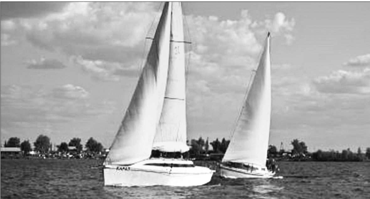
Упродовж тижня юні мореплавці подорожували Дніпром, відвідуючи цікаві історичні пам'ятки, розташовані на його берегах

Наталія ПЛОХОТНЮК | спеціально для «Хрещатика»