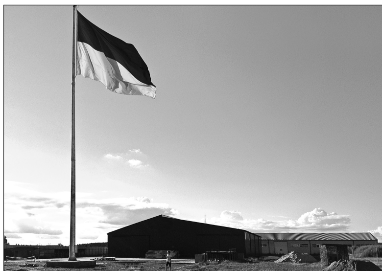
На Київщині підприємці встановили найбільший в Україні національний стяг

■ Приватні підприємці підтримують національну ідею