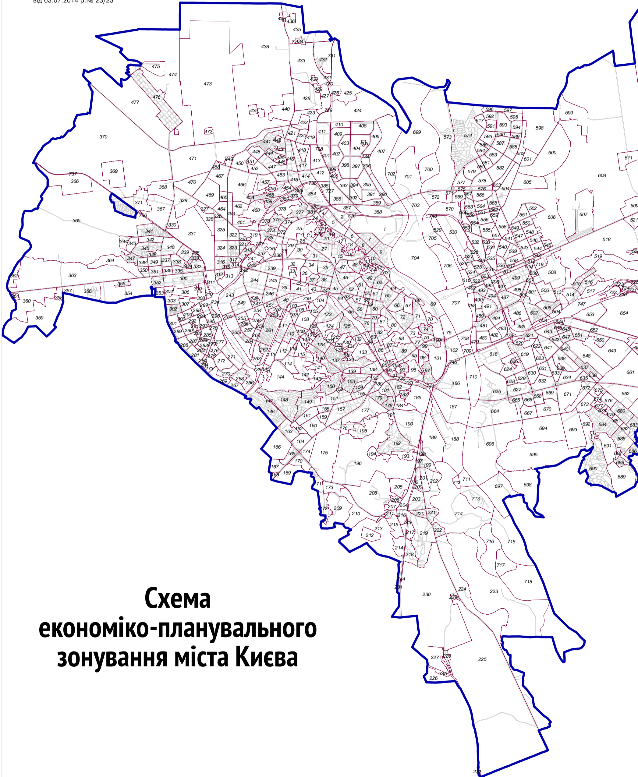
Схема економіко-планувального зонування міста Києва

додаток 1 до рішення Київської міської ради від 03.07.2014 р.№ 23/23