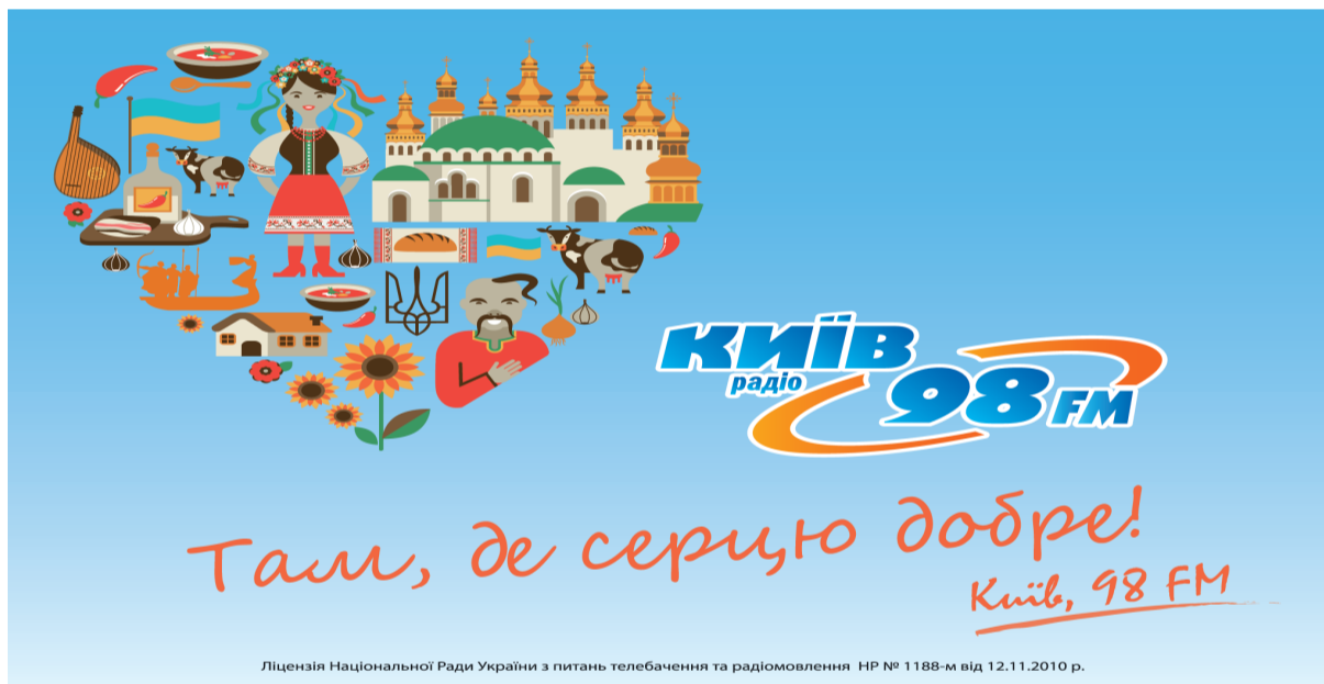
Ліцензія Національної Ради України з питань телебачення та радіомовлення НР № 1188-м від 12.11.2010 р.

1976 — почав роботу Канадський інститут українських студій в Едмонтоні.