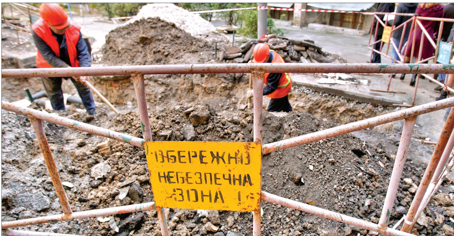
Зношеність трубопроводної мережі Києва сьогодні вже перевищує 60 %, що є критичним рівнем

■ У столиці занепокоєні можливим зривом робіт з підготовки до опалювального сезону