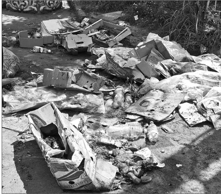
Через несанкціоновану торгівлю на проїжджій частині, яка «розквітла» на вулиці Електротехнічній ще кілька років тому, тут ні пройти ні проїхати, а від смороду у повітрі нічим дихати

Уже кілька років з несанкціонованою торгівлею під вікнами робочих кабінетів безуспішно бо-