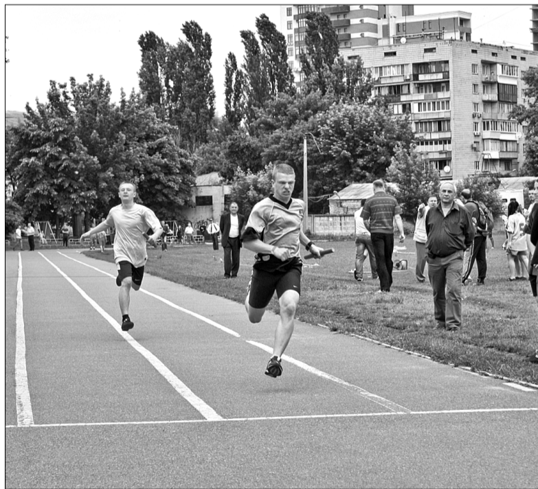
На столичному стадіоні «Старт» змагалися 28 команд професійно-технічних навчальних закладів міста Києва

Над пропозиціями і тим, як вирішити питання, учасники наради думатимуть десять днів. Наразі, щоб стихійна торгівля не повернулася на проїжджу частину, біля ринку чергуватимуть правоохоронці ■