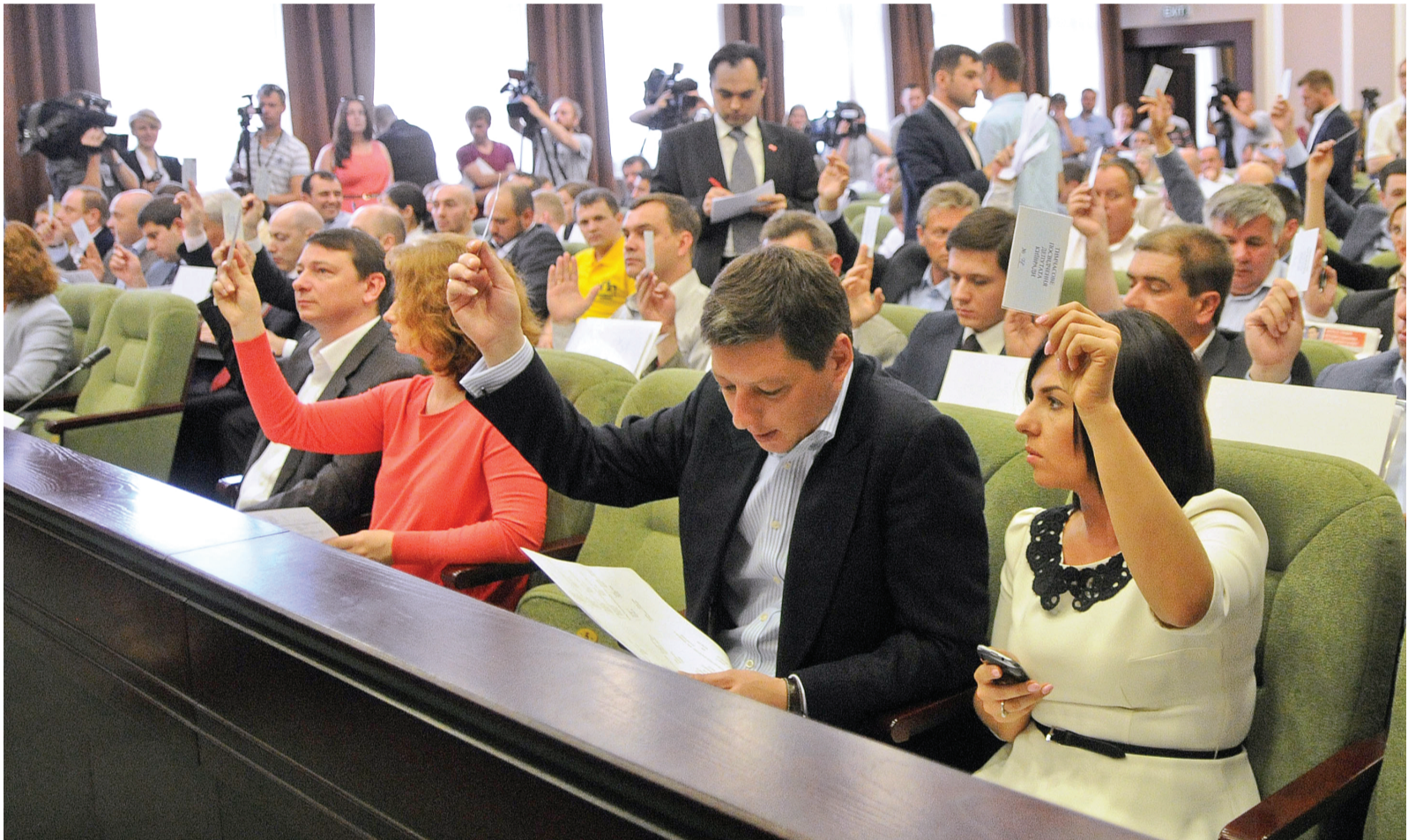
Столичні депутати обрали секретаря Київради та затвердили склад постійних комісій

Столичні депутати працюватимуть в «польових умовах» ще місяць-півтора