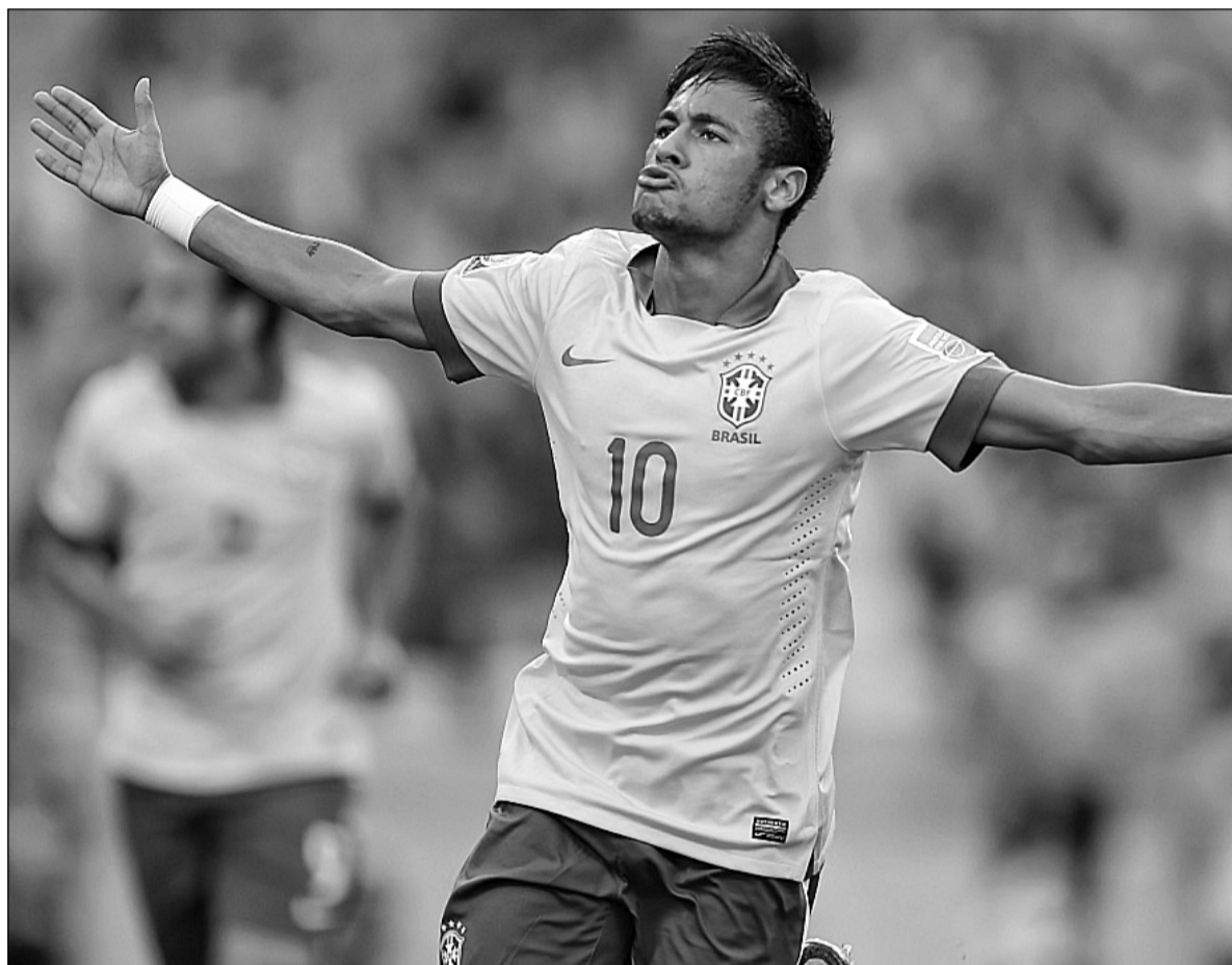
Гравець каталонської "Барселони" бразилець Неймар стане головною "ударною силою" у складі своєї збірної

УСІ КОМАНДИ-УЧАСНИЦІ чемпіонату світу розбиті на 8 груп по 4 колективи. Звичайно, кожен квартет неповторний по-своєму, тому «Хрещатик» спробував виокремити, на що варто звернути увагу на груповій стадії чемпіонату світу.