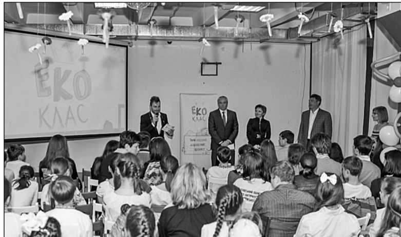
У столичному музеї популярної науки "Експериментаніум" відбулося нагородження переможців I Всеукраїнського конкурсу "ЕКОклас", присвяченого Міжнародному дню екологічної освіти

■ У столиці підбили підсумки I Всеукраїнського конкурсу «ЕКОклас»