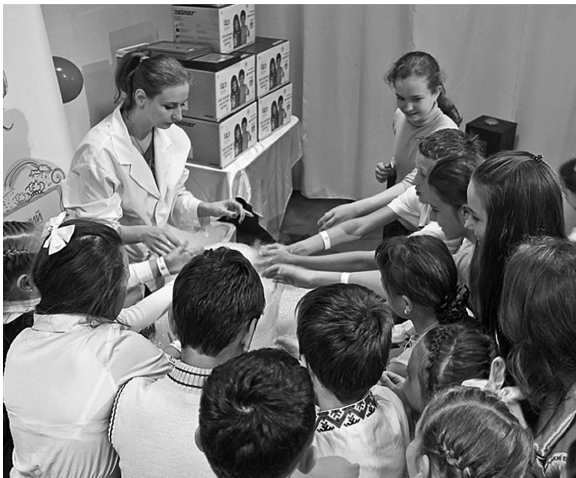
Шкільні команди з Києва та різних областей України захищали свої проекти, створені у рамках соціального проекту "ЕКОклас" та відстоювали їх у наукових дискусіях з членами журі

За словами організаторів, проект має на меті об'єднати спільні зусилля дітей, батьків і вчителів заради поліпшення екологічної ситуації своєї малої батьківщини. До проекту залучено експертів з Міністерства екології України та Міністерства освіти і науки України. Стейкхолдерами «ЕКОкласу» вже