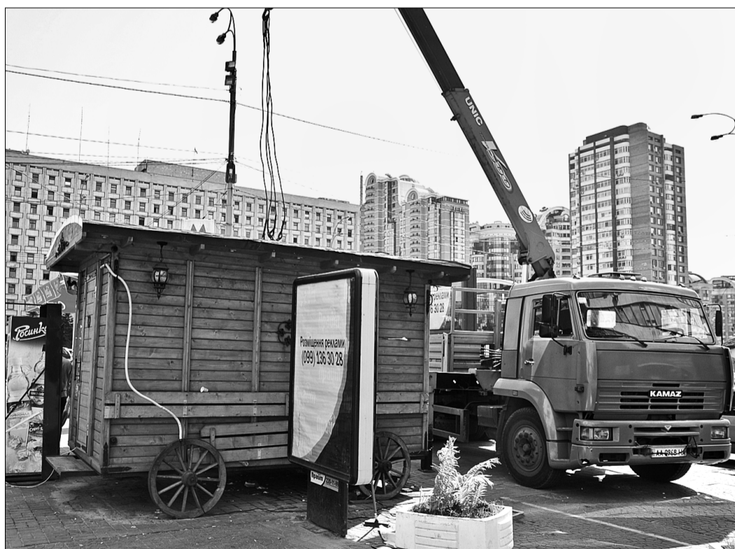
Наразі місто продовжує боротися із незаконними кіосками — деякі МАФи зносять, деякі переміщують

Леся КЕСАРЧУК | спеціально для «Хрещатика»