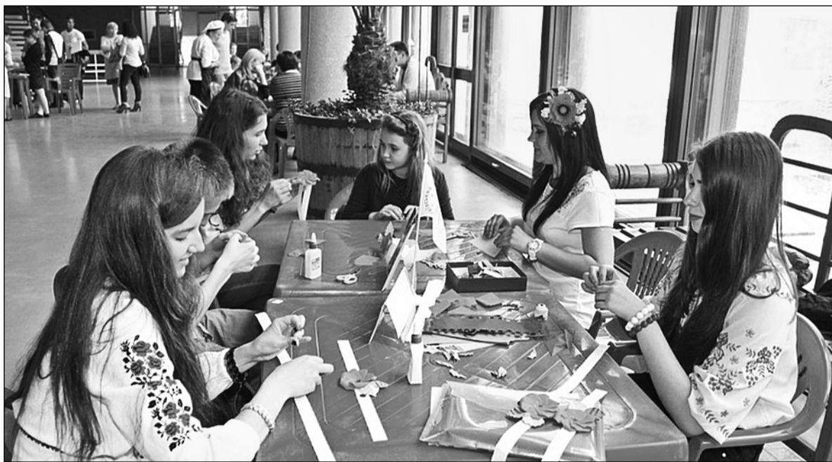
Учасники фестивалю продемонстрували свої таланти: майстер-класи з флористики, пласко-рельєфної різьби по дереву, ліпки з різних видів тіста, художній розпис нігтів і багато іншого