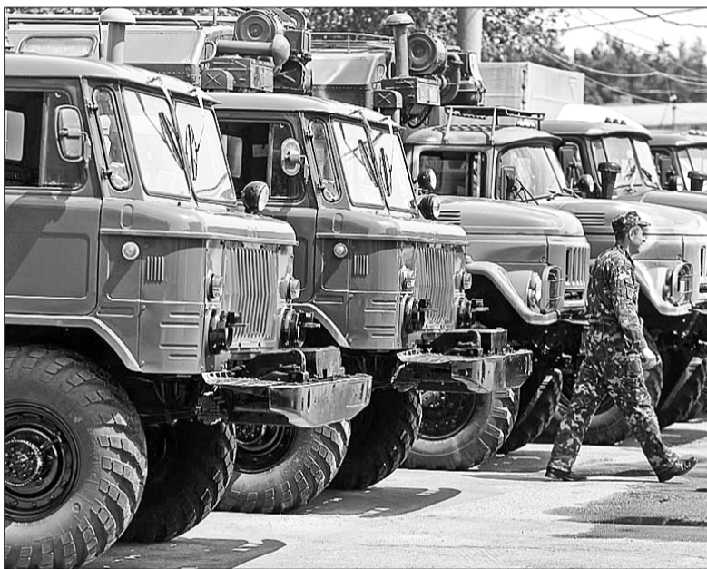
Столичні підприємства відремонтували і передали для Київського батальйону територіальної оборони військову техніку

ла отримана за нарядами Міністерства оборони України. Силами Департаменту транспортної інфраструктури КМДА вже відремонтовано 12 таких машин, всього батальйон отримає 70 одиниць техніки.