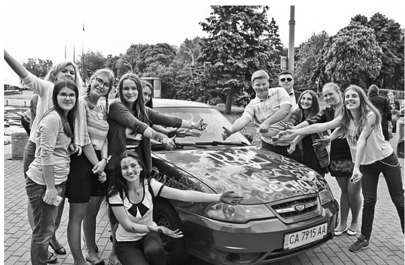
Справді новаторським став розпис учасниками фестивалю автівок, які потім проїхались автопробігом центральними вулицями Києва