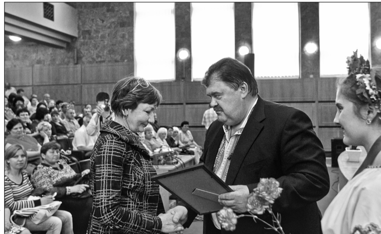
Голова КМДА Володимир Бондаренко нагородив Почесними грамотами найактивніших учасників двомісячника благоустрою Дарницького району столиці

Заходи проводяться під егідою КМДА за підтримки КП «Центр ідентифікації тварин».