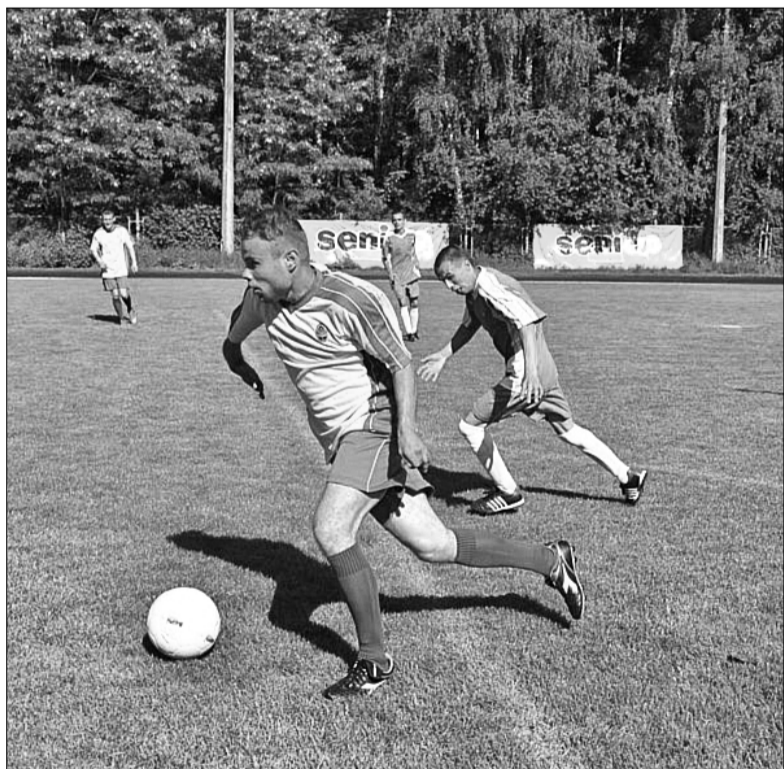
В рамках турніру «Seni Cup» було зіграно 16 яскравих матчів

славляють нашу державу. На передовій у такий важкий час вони були героями і завоювали медалі. Ми завжди раді таким ініціативам, адже це приклад того, що нас цінують» ■