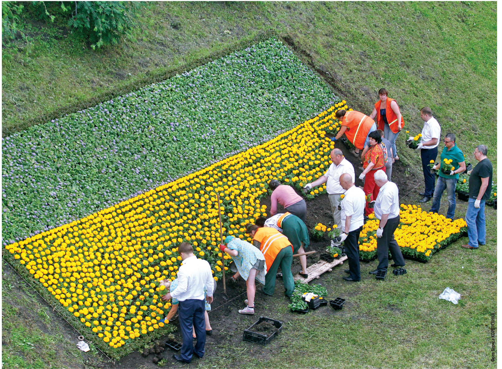
Як видно на фото, верхня частина стягу поки ще зелена, квіти не повністю розпустилися. Однак комунальники заспокоюють: вже за декілька днів квітковий національний символ набуде "правильних", звичних для нас кольорів

МАЙЖЕ 6 тисяч саджанців, висаджених на рекордній площі близько 60 кв. метрів, утворюють найбільший в Україні державний прапор. Квітковий стяг з'явився на алеї Героїв Крут, поблизу столичного парку Вічної Слави. Таку патріотичну акцію за підтримки КМДА вирішили провести працівники КО «Київзеленбуд».