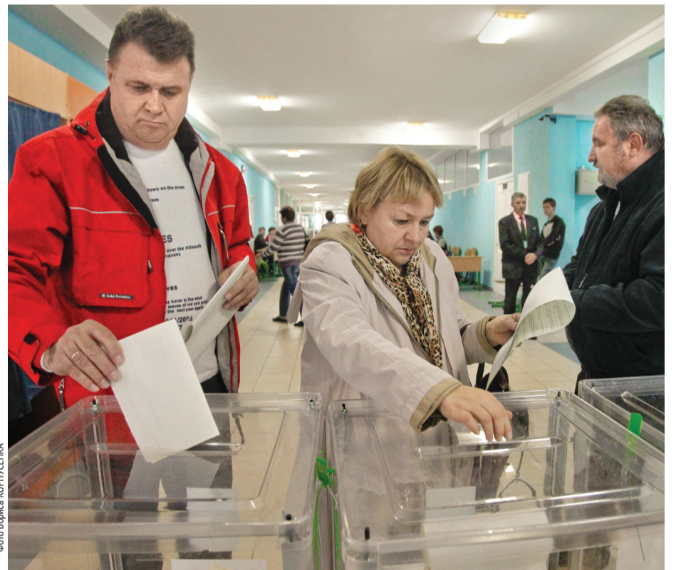
Післязавтра кожен, хто має право голосу, відведе частину свого вихідного дня — неділі — для візиту на виборчу дільницю

Синоптики обіцяють на 25 травня сонячну, безхмарну погоду. Що ж, добре, якби кліматичне «ясно» стало ще й «ясно» політичним. Заради вільного неупередженого вибору киян КМДА перенесла День Києва. Та насправді, для киян найголовніше цієї неділі — вибори. Оскільки саме від їхніх результатів залежить, якими будуть столиця та Україна ■