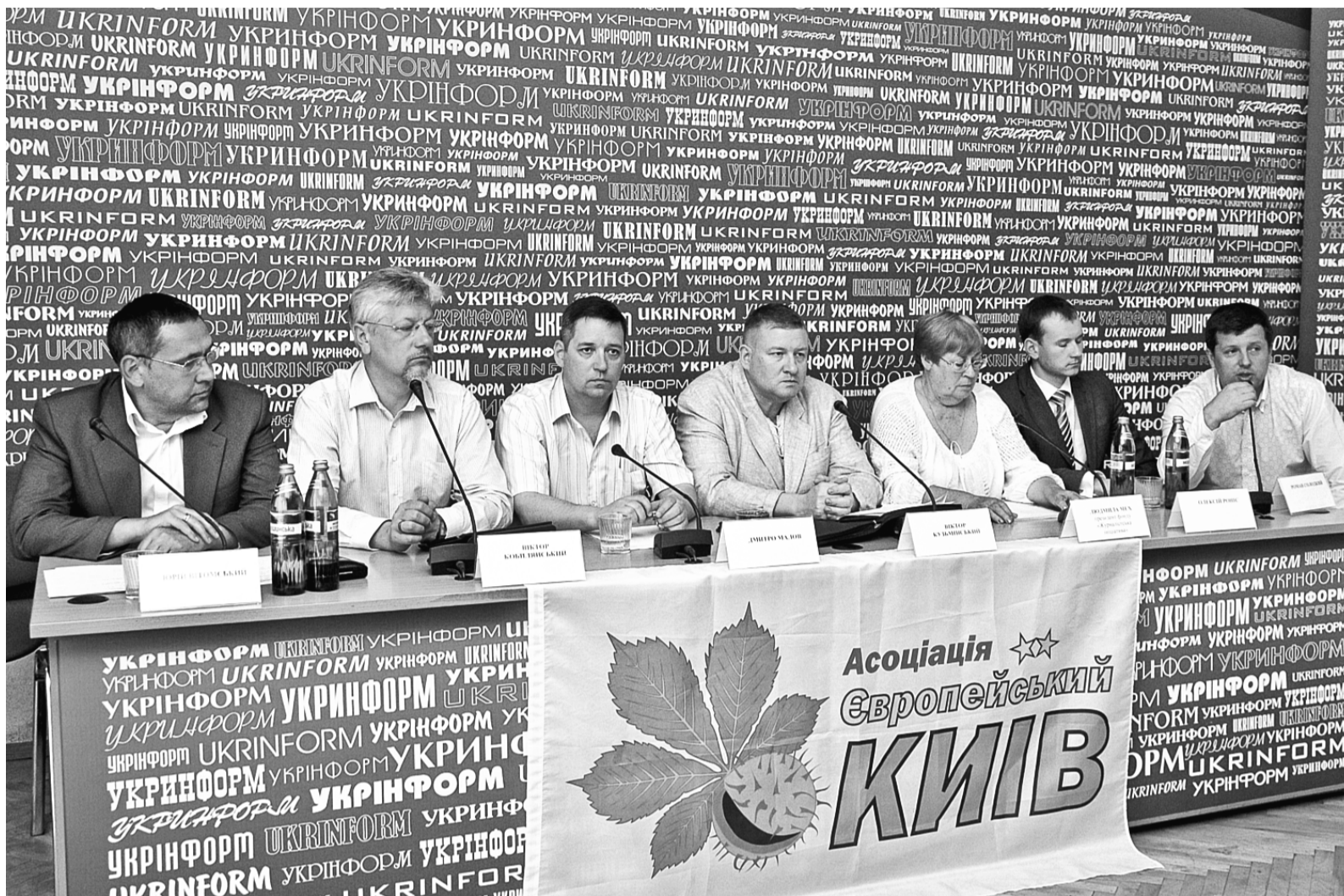
Проевропейські громадські організації столиці створили «Асоціацію Європейський Київ», головна мета якої — дійове сприяння і контроль за реформами в місті

У клубі за місцем проживання «Молоді серця» Печерського району відбувся святковий концерт, присвячений Дню матері та Міжнародному дню сім'ї. З радісною ноткою у серцях розпочався святковий концерт, в якому взяли участь діти та молодь з інвалідністю, а також вихованці клубів за місцем проживання Печерського районного центру соціальних служб для сім'ї, дітей та молоді. Виступи маленьких талантів викликали неабияке захоплення у глядачів і створили атмосферу щирого родинного тепла. Спеціалісти Центру та фахівці з соціальної роботи привітали всіх мам з Днем матері та вручили подарунки, які надала районна організація товариства Червоного Хреста.