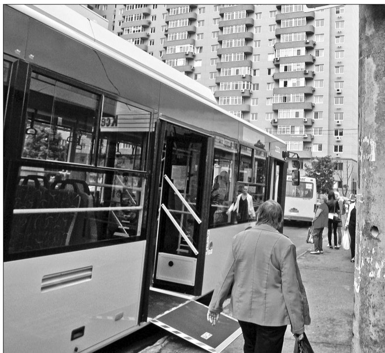
Новий тролейбусний маршрут №6 курсуватиме від зупинки «Діагностичний центр» до метро «Лук'янівська»

Присутній на відкритті нових тролейбусних маршрутів голова КМДА Володимир Бондаренко зазначив, що транспортна система