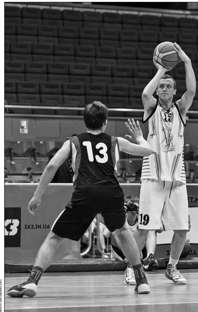
У фінальній частині Всеукраїнської шкільної баскетбольної ліги 3x3 взяли участь 25 команд дівчат і 25 команд юнаків

Отже, дівчата з Бердянська та хлопці з Кривого Рогу здобули історичні перемоги в першому сезоні чемпіонату України з баскетболу 3x3 серед команд юнаків та дівчат загальноосвітніх навчальних закладів. Кривий Ріг узагалі зібрав усі можливі нагороди фіналу — золоті медалі, MVP та перемоги в конкурсах дальніх кидків і слем-данків ■