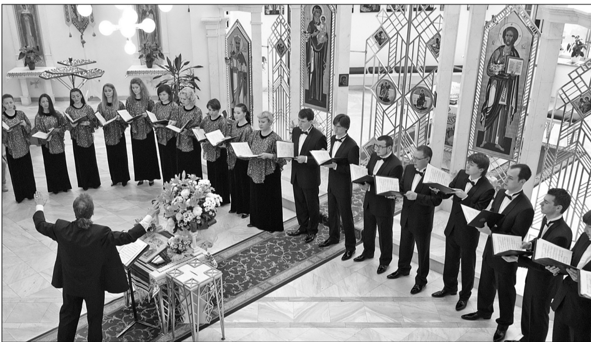
Концерти фестивалю проходять на різних майданчиках: виступ хору "Київ" відбудеться вже цієї суботи в храмі Святого Василя Великого

Олеся НАЙДЮК | спеціально для «Хрещатика»