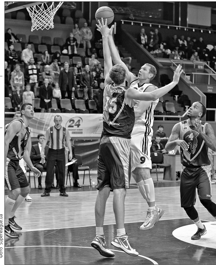
“Будівельник” святкував перемогу в обох матчах 1/4 фіналу Суперліги

У заключній чверті баскетболісти Айнараса Багатскіса спокійно довели матч до логічного завершення. Фінальна сирена застала команди за рахунку 68:90 — “будівельники” здобувають більш