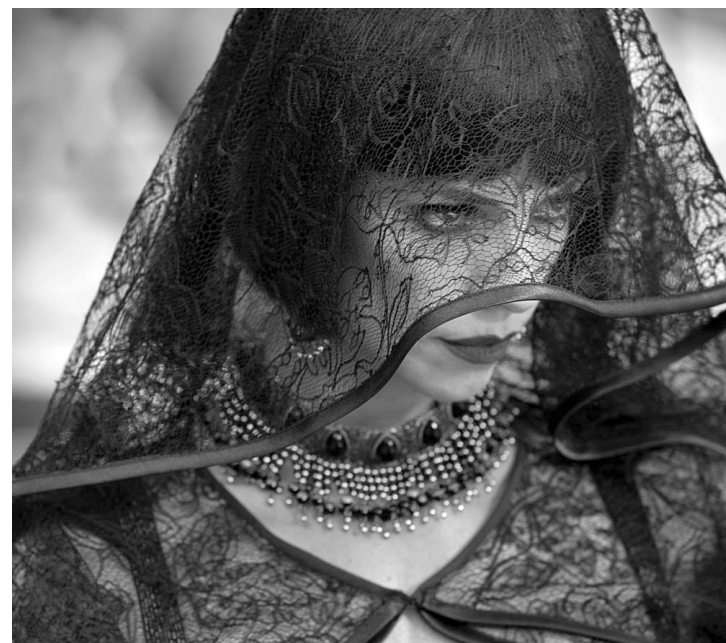
На фестивалі покажуть сміливу інтерпретацію “Білосніжки”, що торік стала кращою іспанською кінокартиною

Гарний настрої глядачам подарує переможць фестивалю комедій у Монте-Карло — “Ще