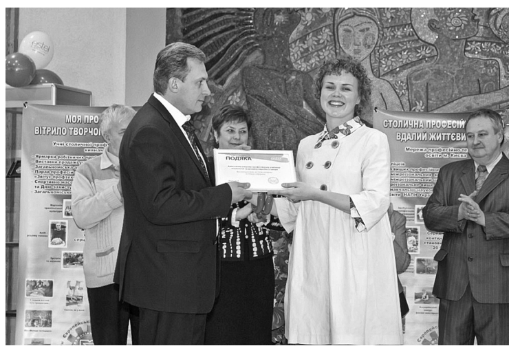
За підсумками "Вернісажу педагогічної творчості" у Київському міському палаці дітей та юнацтва відбулося нагородження найкращих училищ у кількох номінаціях

"Ми маємо унікальну можливість ознайомитись з роботою педагогічних колективів, інноваційними підходами до виробничого та практичного навчання", — зазначив директор Департаменту професійно-технічної освіти Міністерства освіти і науки, молоді та спорту В'ячеслав Супрун. Він