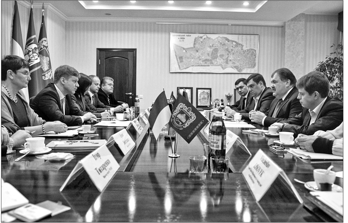
Під час зустрічі голови КМДА Володимира Бондаренка з мером Праги Томашем Гудечком йшлося про обмін досвідом у різноманітних питаннях функціонування двох столиць

"Наші міста мають багато спільного, бо і Київ, і Прага є столицями країн. І якщо ми зможемо якось досвідом вам допомогти — будемо дуже раді. Ми домовилися, що спеціалісти з Києва приїдуть до нас набратися досвіду. Це наша перша така співпраця. Київ — одне з тих міст, з яким ми хочемо продовжувати нала-