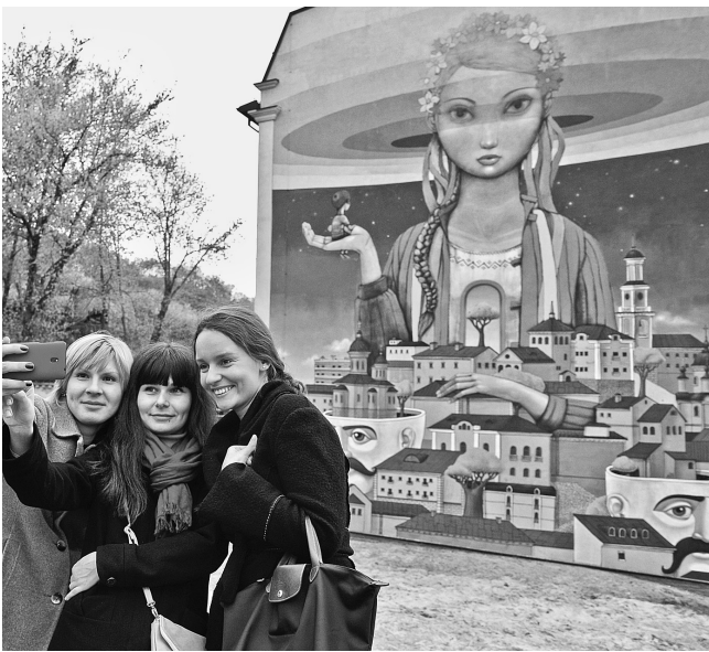
Малюнок, темою якого стало відродження, поєднує образ України із зображенням історичного міста

С пільна робота французького художника-мураліста Жюльєна Маллана з українським колегою Олексієм Кісловим з’явилася на торці 5-поверхового будинку на розі Андріївського узвозу та Боричевого Токчу. На створення 15-метрового зображення пішло 11 днів, 60 літрів акрилової фарби та понад 100 аерозольних балончиків. “Хрещатик” дізнався, що означають деталі малюнка та що планують створити поряд.