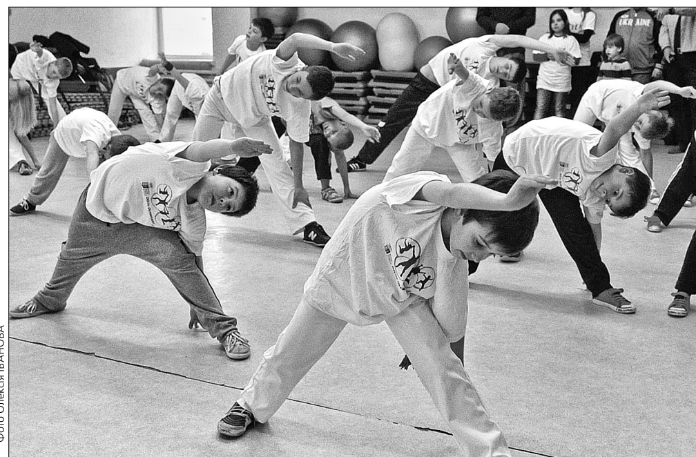
На спортивних заходах акції “Do like OLYMPIANS” діти разом із відомими спортсменами виконують спеціально розроблені вправи

Цього дня цікавий урок фізкультури провели олімпійський чемпіон з легкої атлетки Віктор Бураков та перший заступник голови КМВ НОК України, заступник директора Департаменту освіти, науки, молоді та спорту — начальник управління сім’ї, молоді та спорту КМДА Вадим Костюченко. Діти, які брали участь у заході, гарно провели час та з користю для здоров’я — це зазначають батьки хлопців