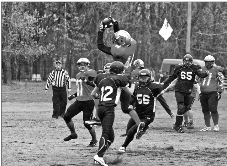
В історичному для вітчизняного американського футболу фіналі Кубка Києва перемогу з рахунком 18:13 святкувала команда "KievBandits"

12 квітня на стадіоні "Дніпровець" відбувся перший фінал Кубка Києва з американського футболу. Любітелі справжньої чоловічої боротьби стали свідками прекрасної та безкомпромисної гри за участю найкращих столичних клубів — "KievBandits" та "Слов'ян". Матч дійсно став окрасою турніру, адже тримав уболівальників у напружі аж до фінального свистка. У підсумку з рахунком 18:13 престижний трофей здобули "KievBandits".