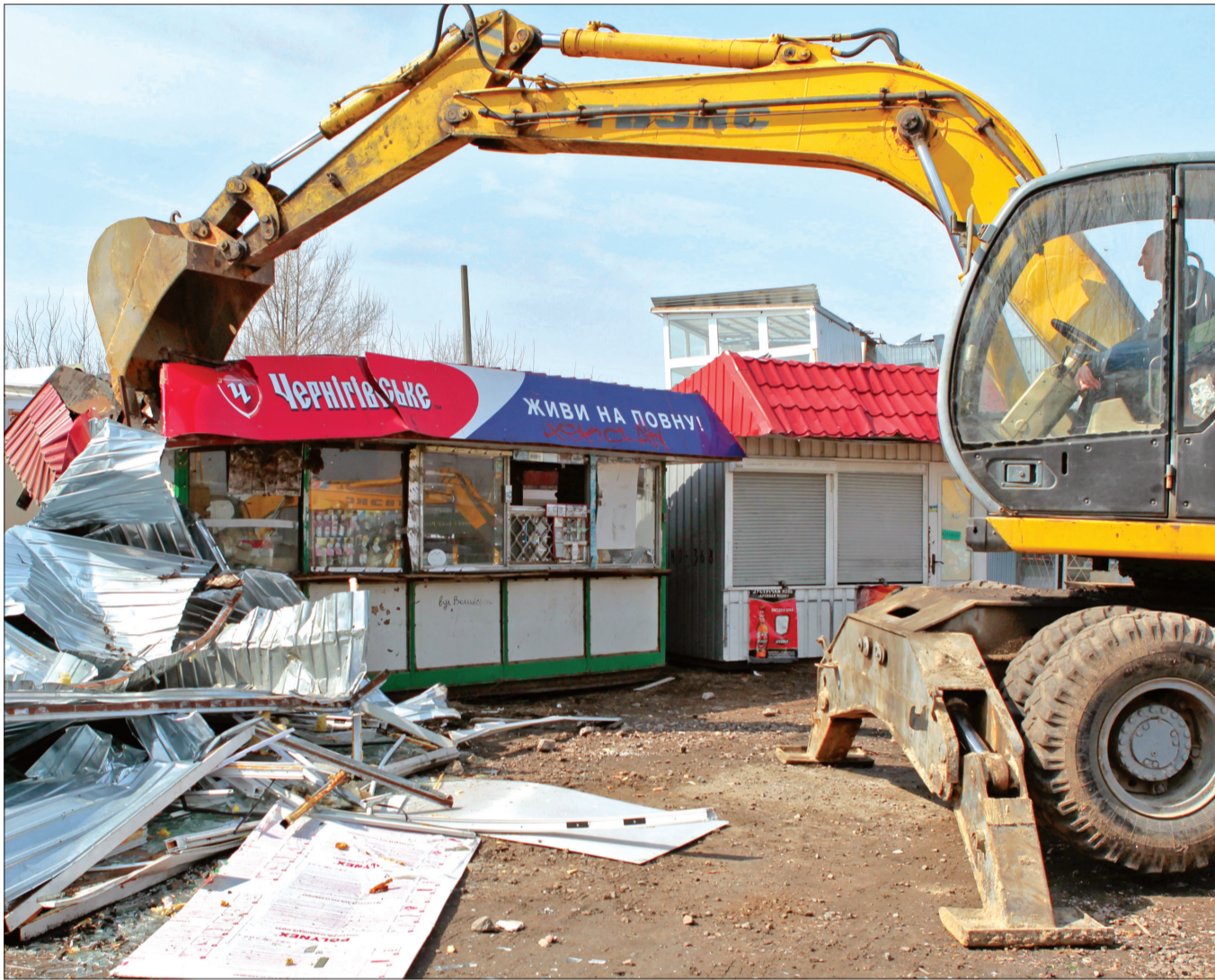
З початку року працівники КП "Київблагоустрій" демонтували 400 незаконно встановлених кіосків

Київська влада знову спробує навести лад з кіосками, розпочавши з яток біля станцій метро