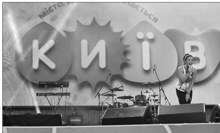
Традиційно своє свято столиця зустрічатиме численними мистецькими, культурними та спортивними заходами