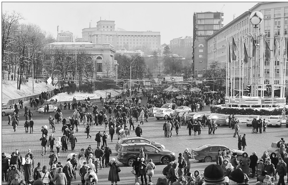
Учасники першої лекцій-екскурсії почули чимало нового про Європейську площу та навколишні будівлі

Пізнавальний і соціальний проект став ще однією доброю ініціативою столичних активістів. "Київське благодійне товариство" існувало з 1834 року до революції, і за цей час воно зробило в місті набагато більше, ніж було зроблено за бюджетні кошти, — розповіла "Хрещатику" виконавчий ди-