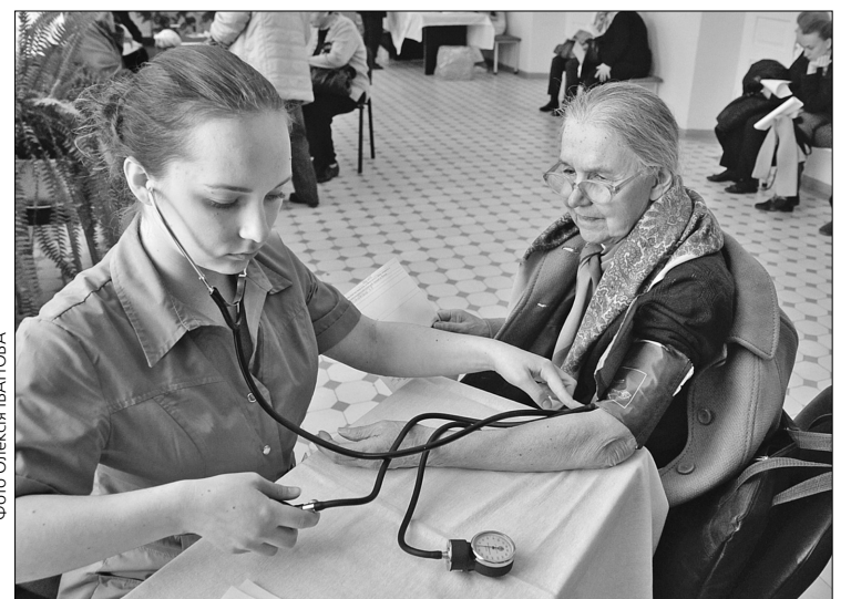
У "День здоров'я" в Олександрівській лікарні прямо посеред коридору всім бажаючим вимірювали тиск, пригощали чаєм із печивом

Найбільші черги були до невролога, ендокринолога, терапевта, ЛОР та офтальмолога. І це попри те, що одночасно приймали близько 20-ти лікарів-офтальмологів. На жаль, лікарня не має сучасного приладу для вимірювання очного тиску — комп'ютерного пневмотонометра. Лікарі консультували, надавали рекомендації, за потреби — направляли на стаціонарне лікування, вмовляли й переконували пацієнтів лікуватися. Кожен спеціаліст розповідав, що під час обстежень пацієнтів нерідко виявлялися серйозні патології, які потребують лікування, а то й операції. Але люди здебільшого не дуже хочуть лікуватися. Більшість з них давно знає про своє захворювання й спокійно з ним живе, рятуючись засобами невідкладної