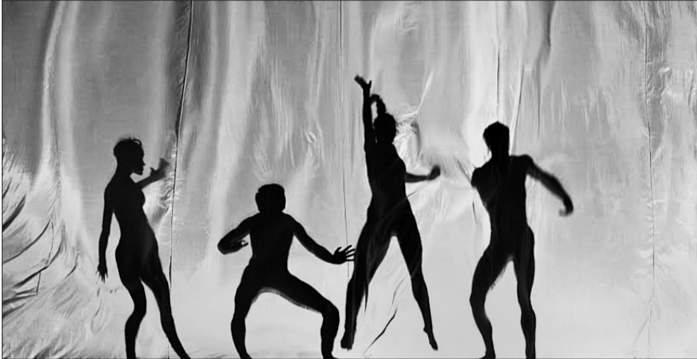
В рамках фестивалю на сцені покажуть кращі здобутки сучасної хореографії: як репертуарні вистави театру, так і прем'єри

З 7 по 12 квітня в Київському муніципальному академічному театрі опери і балету для дітей та юнацтва триватиме перший фестиваль хореографічного мистецтва "КМАТОБ-FEST-2014". Для тих, хто займається танцями, влаштують майстер-класи з класичної і сучасної хореографії. А глядачів запрошують на концерти, на яких будуть і цікаві прем'єри.