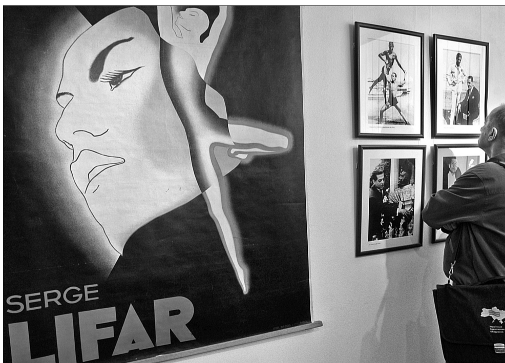
Експонати проекту розповідають про життєвий і творчий шлях видатного митця

Світлини, які зібрали у Київській муніципальній академії танцю ім. Сержа Лифаря, показують його широке коло спілкування та головні ролі Лифаря-танцівника. На одній з фотографій поруч з Лифарем — видатний педагог балету Енріке Чікетті, в якого навчалися всі видатні зірки російського балету кінця XIX століття. "Після революції він не працював в Росії, але Дягілев залучав Чікетті для роботи зі своєю трупою, — зауважує пан Лягушенко. — Він особисто просив Енріке, щоб той приватно займався з Лифарем, якому не вистачало повноцінної базової хореографічної освіти. Саме Чікетті зробив величезний прорив у підготовці Лифаря, який невдовзі засяяв у трупі Дягілева". На інших знімках — Серж Лифар з зірками російського балету, які емігрували з Росії після революції