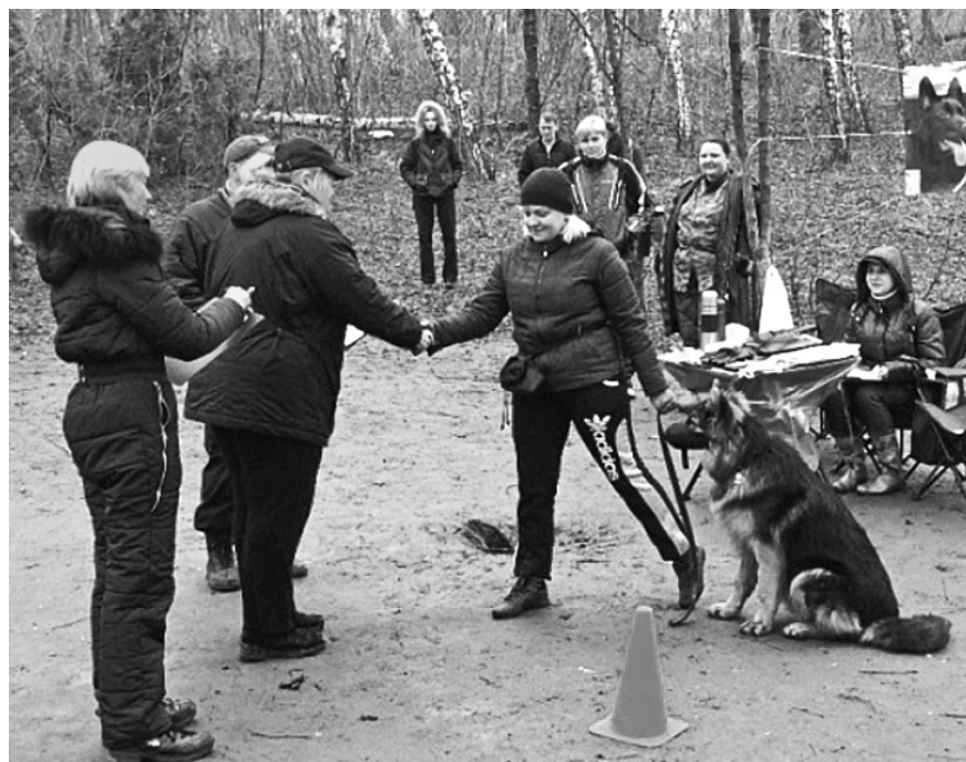
Суддівська комісія відзначила високий рівень підготовки чотирилапих, їх слухняність та керованість в умовах міста

ранньому віці — це відпрацювання основних команд слухняності: ставлення до намордника; ходіння "поруч" на повідку; команди "сидіти", "лежати", "стояти"; підкликання собаки — команда "до мене"; припинення небажаних дій.