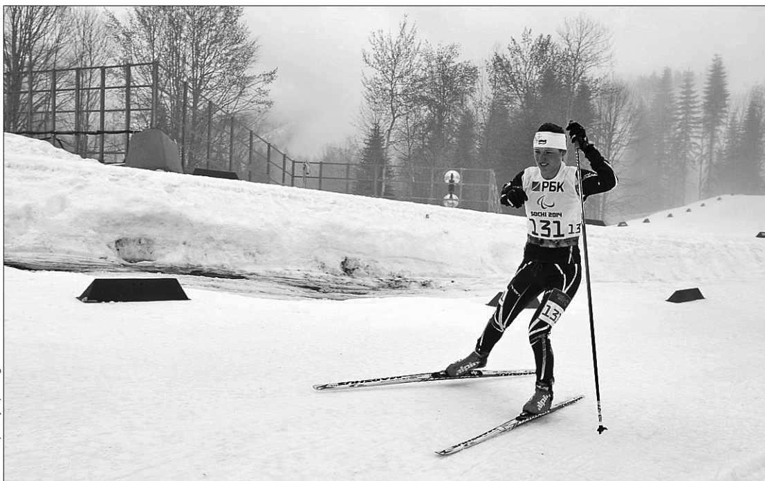
Всі нагороди збірній України принесли представники лижного спорту

Таким чином, завоювавши 3 золоті, 4 срібні та 7 бронзових медалей, наша національна команда розташувалася у загальному заліку змагань на третьому місці. Випереджають українців лише Німеччина, у її спортсменів всі п'ять завойовані нагороди є золотими, а також Росія. В активі останньої — 47 медалей (16, 18, 13). Паралімпіада в Сочі триватиме до 16 березня ●