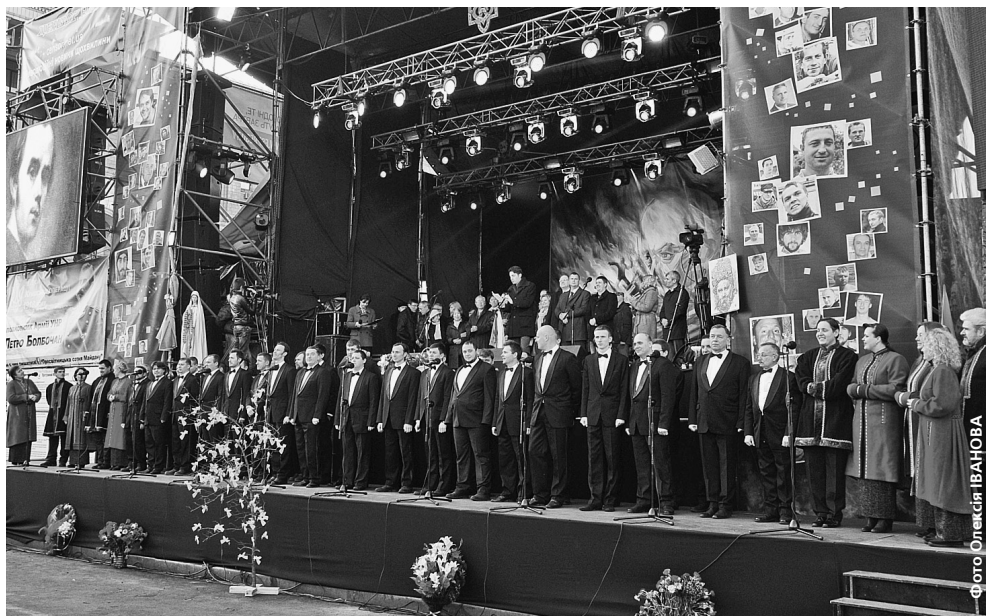
Зі сцени Майдану лунали твори Тараса Шевченка, які читали перекладачі та послі іноземних держав, покладені на музику вірші Кобзаря виконували відомі співаки та хорові колективи

Подбали в оновленому музеї і про доступність до нього людей з обмеженими фізичними можливостями. Тут обладнали спеціальні пандуси та ліфти ●