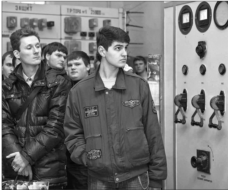
У рамках кампанії по залученню молоді фахівці ПАТ "АК "Київводоканал" влаштували студентам Вищого професійного училища ім. Драгоманова екскурсію на Дніпровську станцію водопідготовки

Ч имало вітчизняних компаній відчують справжній дефіцит кваліфікованих працівників, тож серед поважних підприємств стало своєрідним трендом готувати фахівців мало не зі шкільної лави. Зокрема постійно таку роботу проводить "Київводоканал", де звичними стали ознайомчі навчальні екскурсії на виробничі об'єкти, а також "круглі столи" для учнів профільних коледжів та інститутів.