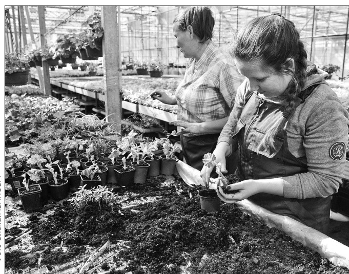
Печерські озеленювачі вирощують мільйон квітів за сезон: 600 тисяч однолітників і приблизно 400 тисяч багаторічників чи дворічників

"Перші квіти — це чорнобривці, петунії, агератум — будуть готові до висадки на клумби, як тільки минуть перші приморозки. Наші дівчата уже розпикували та розсадили рослини по окремих горщиках", —