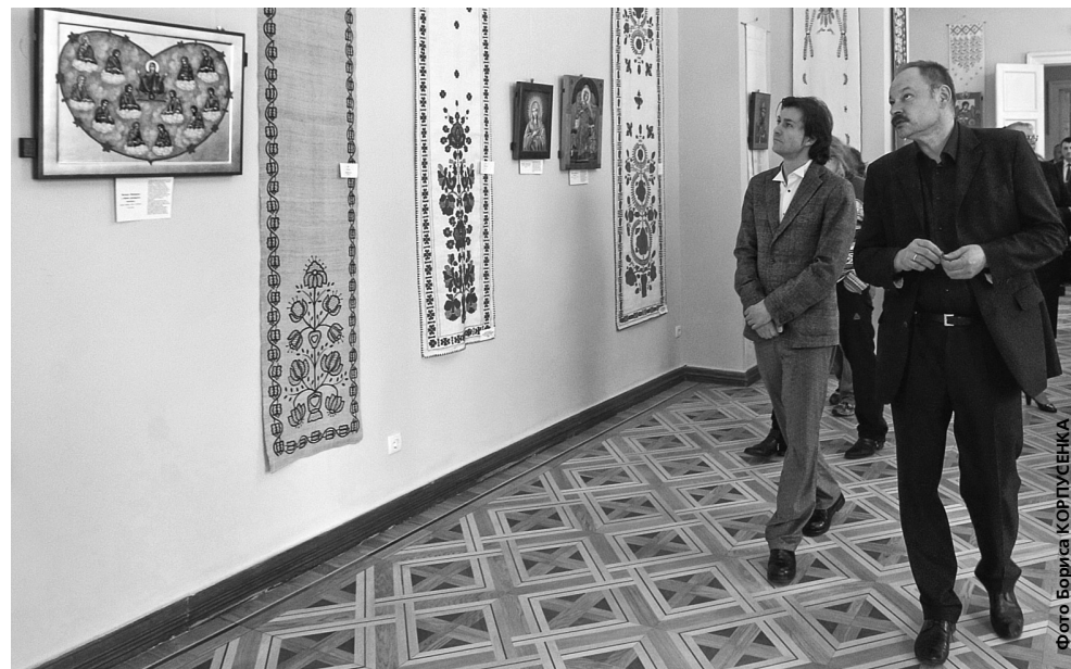
До ювілею Тараса Шевченка зазнав оновлення і Національний музей, присвячений його життю та творчості