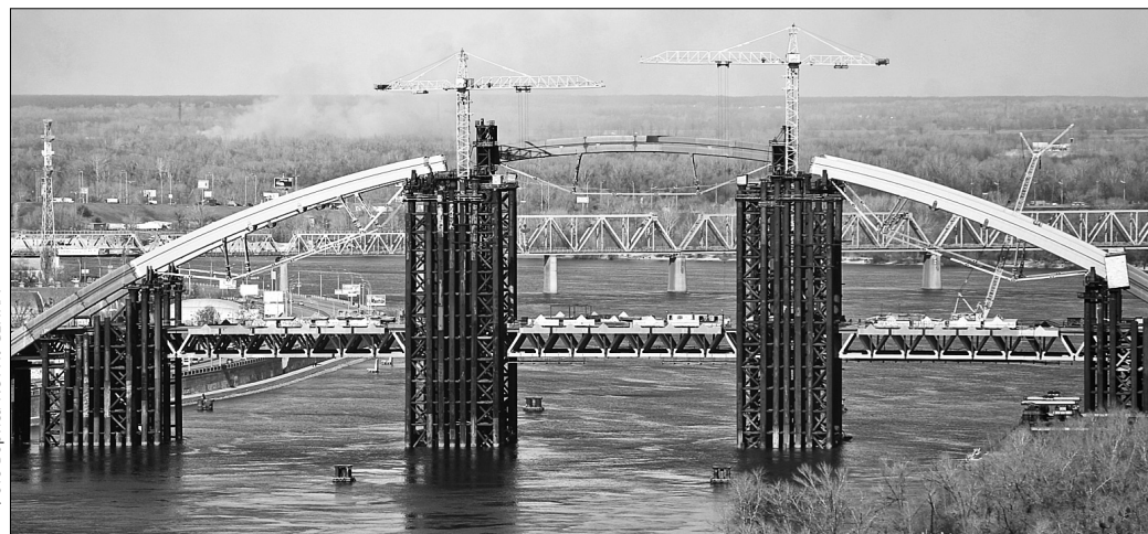
На будівництві Подільсько-Воскресенського мостового переходу нещодавно підняли 650-тонний п'ятий сегмент із шести спроектованих

Після тривалої вимушеної перерви на Подільсько-Воскресенському мостовому переході відновилися масштабні будівельні роботи. Так, днями підняли 650-тонний п'ятий сегмент із шести. Процес тривав 7,5 годин, оскільки конструкцію підіймали зі швидкістю 10 метрів на годину. Для того, щоб виконати роботу, елемент переправили із суші до мосту на спеціально побудований для