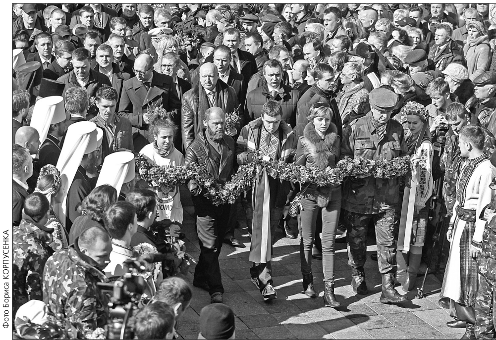
У столиці урочистості розпочалися з покладання квітів до пам'ятника Кобзарю у парку імені Тараса Шевченка

10 березня, у день смерті Тараса Шевченка, на Майдані відбулася панахида за поетом усіх християнських конфесій. Крім того, тут показали відеозапис музичного твору Євгена Станковича “Страсті за Тарасом”, “Наш Шевченко”, документальні фільми “Експеди-