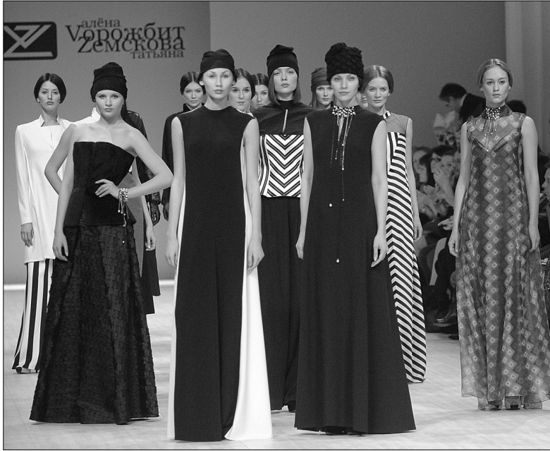
На 34-му Українському тижні моди покажуть колекції сезону осінь—зима 2014/2015 46-ти дизайнерів

Дизайнери не стояли осторонь подій в Україні — приходили на Майдан, чергували, записувалися у волонтери. Проте не забували і про основне заняття, готуючи нові колекції. "Вже 17 років ми є невід'ємною складовою не тільки побудови модного бізнесу в країні, а й позитивного іміджу України, — стверджує голова оргкомітету Україн-