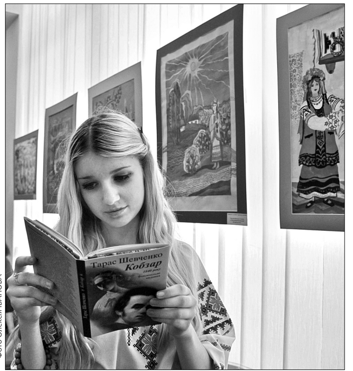
Школярі різного віку і рівня майстерності з усієї України осмислювали у творах образи, створені Шевченком

Вernісаж демонструє різнобарв'я жанрів, сюжетів і технік. Діти різного віку і рівня майстерності на свій манер осмислювали шевченкові образи. На картинах оживають сторінки біографії Шевченка: його навчання, період заслання, численні портрети, а також образи