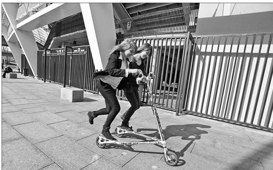
Для дітей-сиріт зі спеціалізованої школи-інтернату №14 міста Києва провели ознайомлювальний тур НСК "Олімпійський"

Н апередодні Міжнародного жіночого свята Київське міське відділення НОК України та Державний Концерт "Спортивні арени України" організували тур для дітей сиріт зі спеціалізованої школи-інтернату № 14 міста Києва. В цей день відбулась знакова подія для міста та всіх шанувальників спорту. Голова Київського міського відділення Національного олімпійського комітету України Павло Костенко та генеральний директор Державного концерну "Спортивні арени України" Сергій Симак підписали Меморандум про співпрацю.