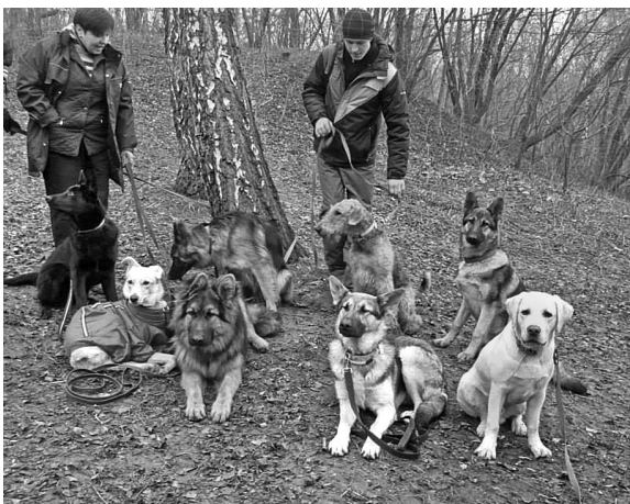
У заході прийняло участь 14 власників собак зі своїми улюбленими

Н ещодавно в зоні виховання собак Солом'янського ландшафтного парку кінологічне об'єднання "ель Карін" спільно з комунальним підприємством "Центр ідентифікації тварин" провели тестування по програмі слухняності молодих собак (ПКД — початковий курс дресирування). У заході взяли участь 14 киян разом зі своїми чотирилапими друзями. Всі вони успішно склали свій перший в житті іспит. Суддівська комісія відзначила високий рівень підготовки чотирилапих, їх слухняність та керованість в умовах міста.