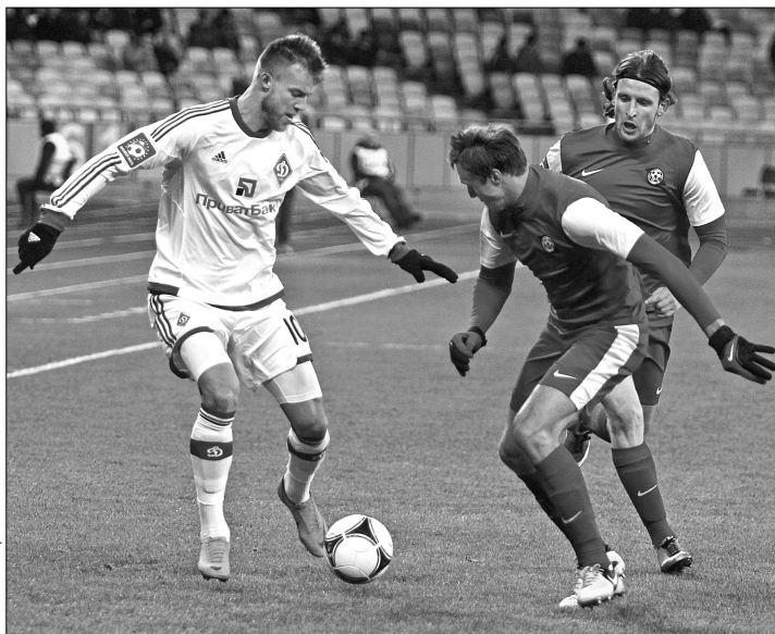
Наразі ківське "Динамо" займає третю позицію у чемпіонаті України

У четвер на нараді в Будинку футболу за участю представників ФФУ, МВС, СБУ, Міністерства молоді та спорту, Прем'єр-ліги і клубів елітного дивізіону вирішили відновити національну першість 15 березня. Але остаточний вердикт про розклад матчів так і не винесли. Увечері того ж дня клуби отримали два варіанти календаря, кожен з яких передбачав відновлення чемпіонату з 19-го туру, тобто з моменту, на якому турнір був перерваний через зимову паузу. Відмінність була лише в тому, на які дати призначити резервні дні посеред тижня — в березні і квітні або двічі зіграти у другому весняному місяці.