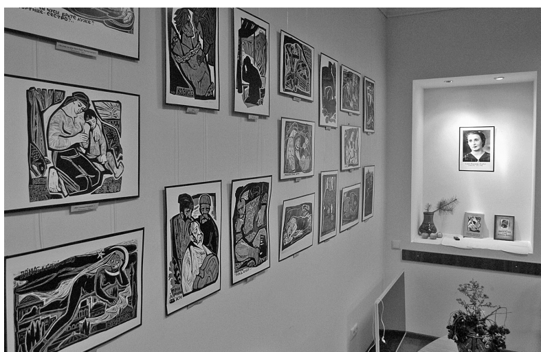
В експозиції представлені понад 70 факсиміле на шевченківську тематику, зроблених з оригінальних кольорових і чорно-білих ліногравюр

У 1980-1990-х роках Софія Караффа-Корбут створює нові шедеври — ілюстрації до поеми “Іван Вишеньський” Івана Франка та драматичної “Лісова пісня” Лесі Українки. Усього художниця проілюструвала 57 книжок українських авторів, що вийшли загальним тиражем близько 6 мільйонів примірників. Хоча її роботами милувалися мільйони людей, Софія Караффа-Корбут не одержала жодної урядової нагороди, премії чи звання. Проте її образи і досі промовляють до глядачів ●