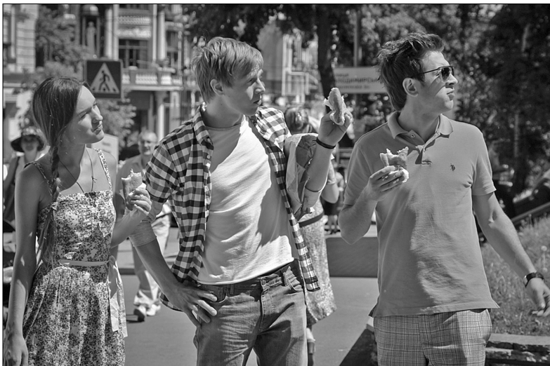
Дівчині-провінціалці Лізі пощастило зустріти двох хлопців, які залюбки знайомлять її з Києвом

В столиці презентували нову стрічку, присвячену романтичним пригодам в нашому місті. За сюжетом, проїздом у Києві опиняється молода дівчина з Гайсина, яка прямує до Америки. Тут вона знайомиться з двома хлопцями, знаходить звідну сестру і замислюється, чи варто їй їхати взагалі. У картині зіграли і чимало відомих українців: Ольга Сумська, Наталія Могилевська, Андре Тан та інші.