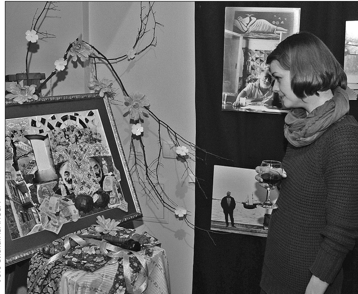
В музеї представлені роботи митців, які надихалися творчістю Сергія Параджанова

М узей Сновидінь представив власну інтерпретацію творчості великого майстра. Експозиція "Сергій Параджанов — сновидіння XXI століття" — колаж, що об'єднує весь простір музею і являє відображення міфів, рефлексій і спогадів про режисера, якому цього року виповнилося 690 років.