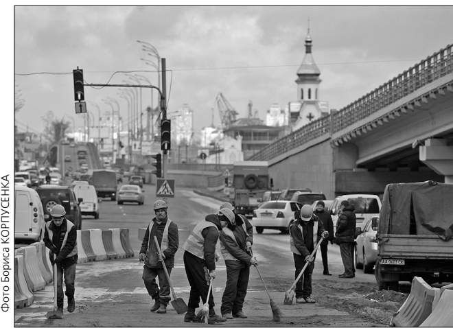
Цьогоріч київавтодорівці планують завершити будівництво транспортної розв'язки на Поштової площі

Київські дороги стануть кращими. На реконструкцію, капітальний, поточний ремонт та утримання вулично-шляхової мережі міста у бюджеті Києва на 2014 рік закладено 746,1 млн грн. За ці гроші планують завершити ряд стратегічних об'єктів, роботи на яких почали торік і розпочинають нові.