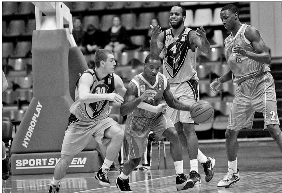
Чинний чемпіон країни столичний “Будівельник” виборов непросту перемогу над “Ферро-ЗНТУ” з рахунком 89:80

На початку третьої чверті “Будівельник” спромігся підібратися до суперника на 9 очок. Гравці “Ферро-ЗНТУ” дещо зменши-