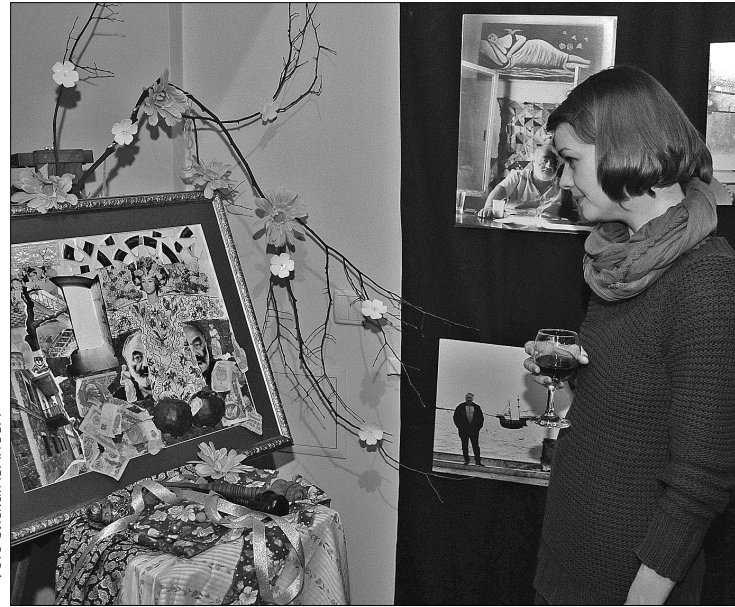
В музеї представлені роботи митців, які надихалися творчістю Сергія Параджанова

М узей Сновидінь представив власну інтерпретацію творчості великого майстра. Експозиція "Сергій Параджанов — сновидіння XXI століття" — колаж, що об'єднує весь простір музею і являє відображення міфів, рефлексій і спогадів про режисера, якому цього року виповнилося 690 років.