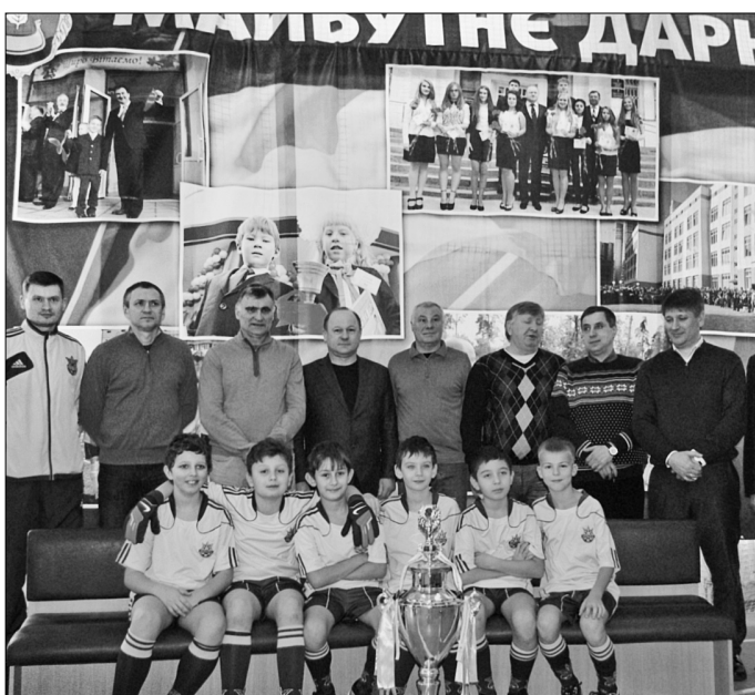
На урочистому відкритті футбольного турніру юним спортсменам було представлено "Кубок співдружності", який нещодавно здобула українська молодь

Аби надихнути юних футболістів на нові звершення, на відкриття завітали легенди вітчизняного футболу. Зокрема Анатолій Дем'яненко. Колишній тренер і гравець ФК "Динамо" (Київ) зазначив: "Побільше б таких турнірів, щоб діти відчували дух змагання. Тоді б із них вирости великі майстри, які б грали не тільки у "Динамо", а й в інших командах України та за кордоном".