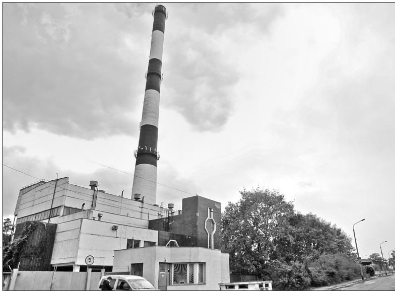
За словами фахівців, нинішній опалювальний сезон в столиці проходить стабільно

Вже цього року місто візьметься за владнання ще однієї проблеми. А саме — циркуляції гарячої води у висотках. Аби налагодити нормальний тиск подачі води, з міського бюджету планують витратити 30