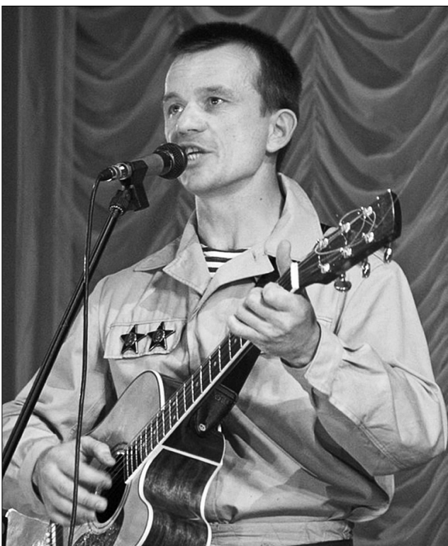
Автор-виконавець, розвідник, командир групи спецназу, кавалер двох орденів Червоної Зірки В'ячеслав Купрієнко

“Вже за півроку до випуску нас розподіляли у війська спеціального призначення, хоча готували як офіцерів військової розвідки. Але вже йшла “неоголошена війна”, й було негласне розпорядження “перереграти” усіх офіцерів-спецназівців через Афган для придбання бойового досвіду. Задача спецназу полягала у запобіганні доставці в Афганістан із суміжних територій зброї, наркотиків, боеприпасів, тобто в перекритті караванних маршрутів, знищенні бандформвань, які дуже активізувалися у прикордонних районах. У нас був достатньо високий професійний рівень і, що головне, сформований абсолютний спеціалістський, особливий дух розвідки, в основі якого лежали самостійність в ухваленні рішень, готовність узяти відповідальність на себе, сміливість, перехідна в зухвалість, без якої у спецназі взагалі робити нічого, авантюризм, якість... нехлійство, чи що (як це не дивно, в найкращому значенні цього слова). Все це повною мірою могло виявитися саме на війні, тому що війна — це завжди нестандартні рішення, нестандартні ходи. Тому іноді просто смішно виглядає війна в кіно, коли все просто і зрозуміло. В бою навпаки все не просто і все незрозуміло, і го-