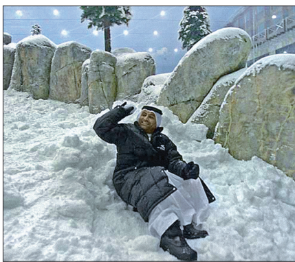
повітряним повідомленням, пише svit24.net.

Нагадаємо: найбільший у світі штучний архіпелаг The World розташований в декількох кілометрах від берегової лінії Дубая, він складається з 300 островів загальною площею 55 квадратних кілометрів. Формою він нагадує континенти Землі, а з материком пов'язаний водним і