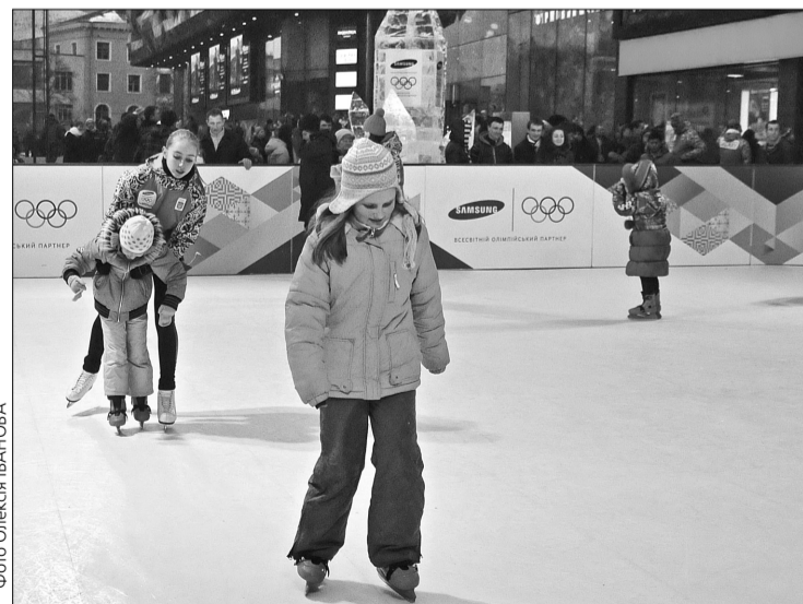
Ковзанка стала чудовим доповненням до зони підтримки нашої Олімпійської збірної

У важливості такої підтримки переконана багаторазова чемпіонка світу та Європи з художньої