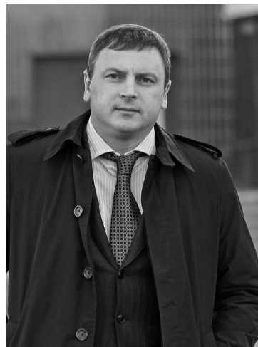
Голова Деснянської РДА Станіслав Прокопенко проти незаконного встановлення МАФів на території району

За словами Станіслава Прокопенка, на сьогодні Департаментом містобудування та архітектури КМДА вже розпочато прийом заяв щодо встановлення тимчасових споруд у відповідності до Комплексної схеми. Заявки підприємців надходять до спеціальної комісії з розгляду заяв про можливість розміщення тимчасових споруд торговельного, побутового, соціально-культурного чи іншого призначення для здійснення підприємницької діяльності на території м. Києва, яка створена розпорядженням КМДА від 30.12.2013 № 2354. Для зручного та швидкого оформлення заяв створено спеціальний веб-портал розміщення