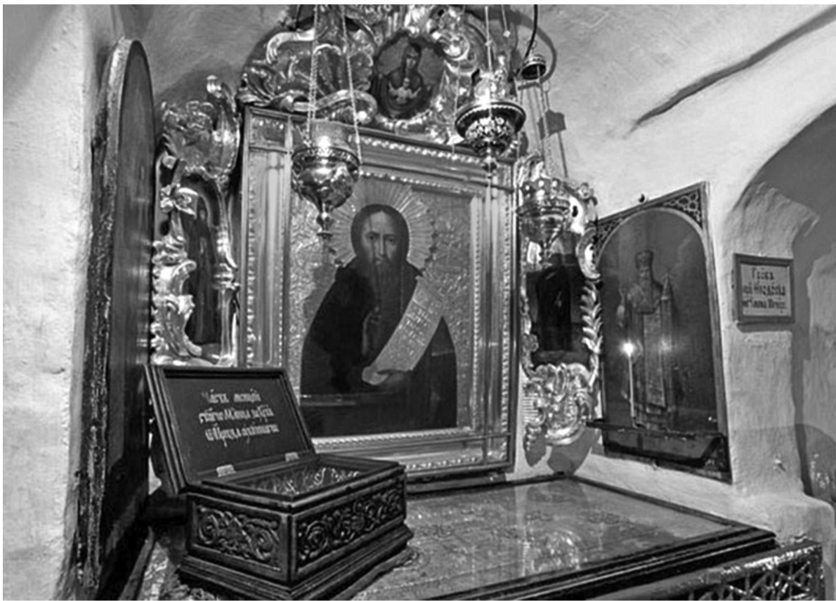
Символічний кенотаф Феодосія Печерського

Будучи сам аскетом-подвижником, Феодосій Печерський прагнув до того, щоб і у світському житті ідея широго служіння Господу стала панівною. Саме тому він виступав за необхідність духовного контролю церкви над світською владою. У своїх листах до князя Ізяслава Ярославича ігумен Феодосій постійно підкреслює, що є духовним наставником і керівником світського правителя. Більше того, князь, якщо хоче заслужити порятунок, зобов'язаний служити перш за все справи