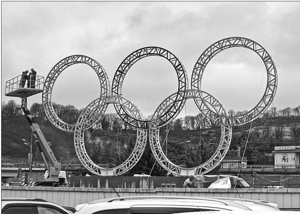
Спортивне "золото" конвертували у ділове

Найпоказовіший приклад помилки у прорахунках — Греція. Афіни у 2004 році приймали Літні Олімпійські ігри. Планували витратити спочатку 1,6 млрд євро, потім 4,5 млрд, підсумковий кошторис склав майже 10 млрд євро. Економіка Греції не отримала очікуваних зисків, хоча уряд наслідував успішну бізнес-модель проведення Ігор у Лос-Анджелесі. Неправильна оцінка витрат призвела до того, що "діри" затакалися бюджетним коштом. Саме Олімпійські ігри сприяли занепаду грецької економіки, а потім сталося те, що для її порятунку решта країн Єврозоюзу змушені були "трусонутися" гаманцями на сотні мільярдів євро. Іронія долі була у тому, що Олімпійські ігри походять з Греції. Так відновлена історична традиція мало не згубила країну, котра її породила.