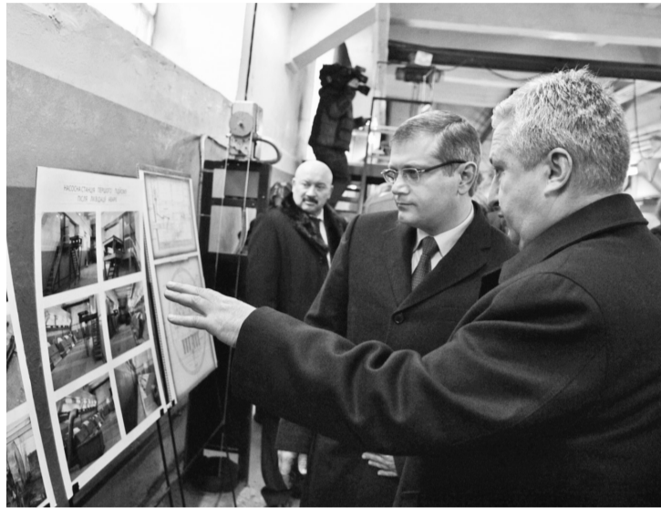
Під час інспекції на Бортницьку станцію аерації в. о. віцепрем'єр-міністра Олександр Вілкул ознайомився з виконанням робіт із реконструкції важливого для міста об'єкта

Під час інспекції на Бортницьку станцію аерації керівництво столиці доповіло в. о. віцепрем'єр-міністра Олександру Вілкулу про хід виконання робіт з реконструкції цього важливого для міста об'єкта. Під час візної наради також йшлося про забезпечення якісного очищення стічних вод. БСА є комунальною власністю Києва, проте, враховуючи складність об'єкту та його важливість для Києва, уряд надає допомогу у вирішенні актуальних проблем підприємства.