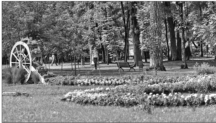
Цьогоріч у планах “київзеленбудівців” акцент зроблений саме на квітково оформлення парків, скверів та навіть автомобільних розв'язок

Формування комфортного простору для кожної людини у парках та скверах є пріоритетом роботи КО “Київзеленбуд” ось уже кілька років. Не стане винятком і 2014-й. Дитячі та спортивні майданчики, тематичні сади та етно-куточки, а також своєрідна візитівка міста — виставки квітів на Співочому полі — головні напрямки роботи на поточний рік.