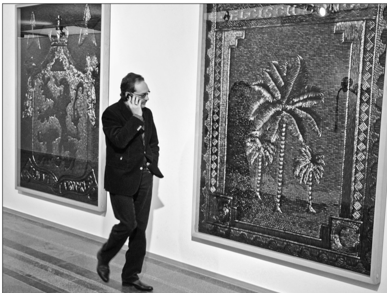
Мозаїки Яна Фабра, що оповідають про колонізацію Конго, вражають своїми розмірами та незвичним матеріалом

В PinchukArtCentre митець представив проекти "Данина Бельгійському Конго" і "Данина Ієроніму Босху в Конго", в яких досліджує історію колонізаторської політики своєї батьківщини. Захоплення викликає матеріал, з якого зроблені масштабні мозаїки, — крильця жуків сімейства златки, що виблискують усіма відтінками зелено-синього. Також в арт-центрі показують три відеоінсталяції, що занурюють відвідувачів у перехресний вогонь, чорнобильську зону та паризький перформанс.