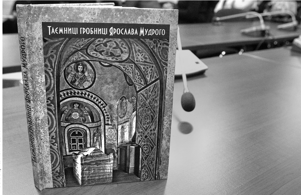
З останніми дослідженнями, присвяченими саркофагу Ярослава Мудрого, читачі можуть познайомитися у науковій монографії

Коли ж рештки Ярослава Мудрого зникли з "Софії Київської" та де вони зараз? Спочатку науковці шукали у Петербурзі — можливо, кістяк Ярослава залишили на дослідження. Але знайшли документ, що всі кістки (до одної) повернули. Кілька ниточок