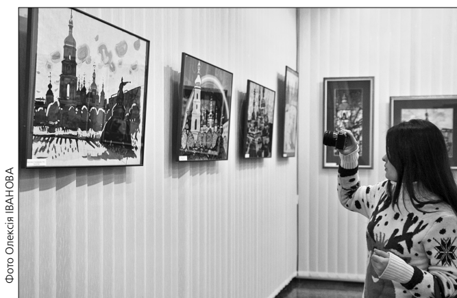
Найбільше Юрій Хімич малював Софію Київську, яку вважав шедевром українського бароко та втіленням могутнього потенціалу нашого народу

Юрій Хімич був надзвичайно працюючим, малював де завгодно й на чому завгодно. А головним девізом його життя став вислів: "щоб робота виходила, необхідно без смутку відмовлятися від