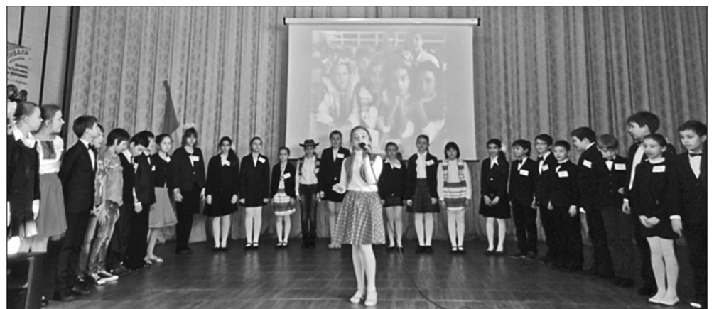
Школярі продемонстрували свої таланти і вміння: декламували вірші, грали на музичних інструментах, співали, танцювали, переконавши присутніх у тому, що гідні носити почесне звання гімназиста

Яскравою подією для учнів 5-х класів є традиційна урочиста церемонія "Посвята в гімназисти", що днями відбулася у стінах рідного навчального закладу. На святі були присутні адміністрація гімназії, вчителі, батьки, учні. До гімназійної родини приєдналося ще 136 п'ятикласників. Вони разом з класними керів-