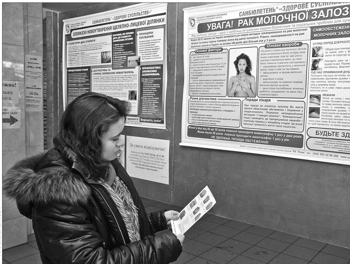
Вчасна профілактика та здоровий спосіб життя знижують на третину вірогідність захворіти на рак

Це однією важливою умовою розвитку захворювання є бідність та соціальна нерівність в суспільстві. Так, у 2010 році близько 70% всіх випадків смертей від раку сталися в країнах із низьким і середнім рівнем доходу. Якщо у людини не вистачає коштів на здорове харчування чи вона змушена працювати по 12-14 годин на добу, навряд чи така людина здатна буде дотримуватись здорового способу життя. Тим більше, коли якісна медична допомога в країні — привілеї заможної частини суспільства. Якщо ж додати до цього переліку причин поширення раку такі, як старіння населення та урбанізація, поширення стресів та екологічна криза і ще безліч факторів, то може виникнути враження, що сучасний світ не залишає майже жодного шансу людині на здорове повноцінне життя. Стає зрозумілим те, що поширення раку сьогодні, як і інших неінфекційних захворювань, становить не тільки суто медичну, а соціальну проблему, від вирішення якої багато в чому