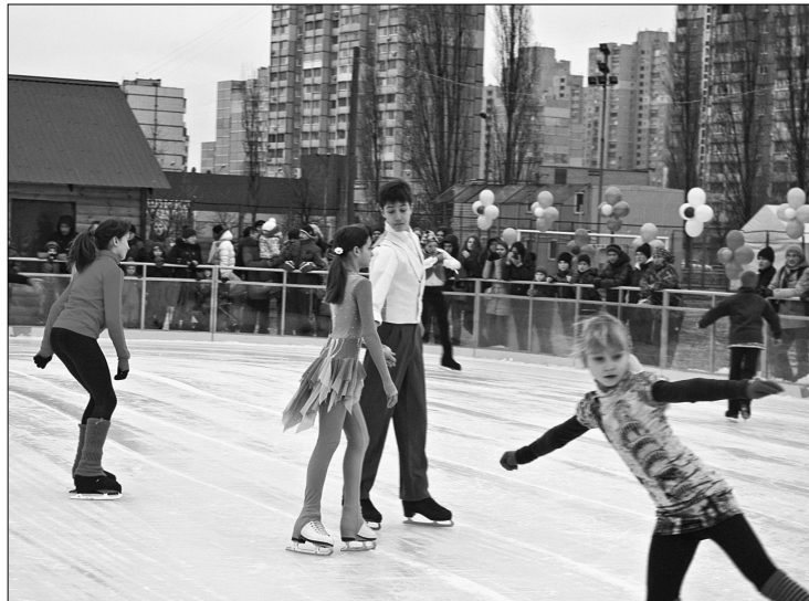
Здебільшого льодові майданчики обладнали поблизу навчальних закладів та в парках

мовий період в районі створено всі умови для того, щоб максимальна кількість дарниччан — і дітей, і дорослих — мала змогу займатися улюбленим видом спорту. Для цього разом з управлінням освіти заплановано облаштувати близько 40 ковзанок при загальноосвітніх закладах району.