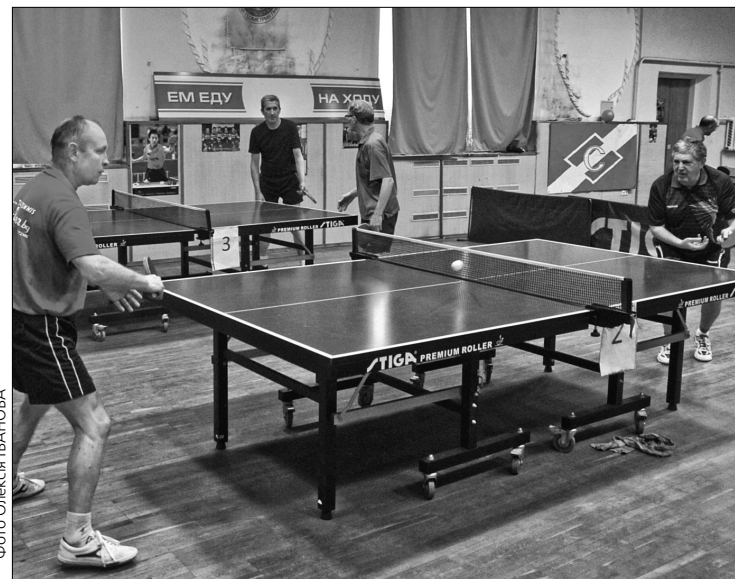
У турнірі з тенісу взяли участь понад 100 спортсменів з різних куточків України

Значимо, що конкуренція у командних змаганнях була дуже високою. Учасники боролися самовіддано, тому до останнього неможливо було визначити, хто ж стане переможцем. Все вирішили лічені бали. Отже, за підсумками турніру найкращою