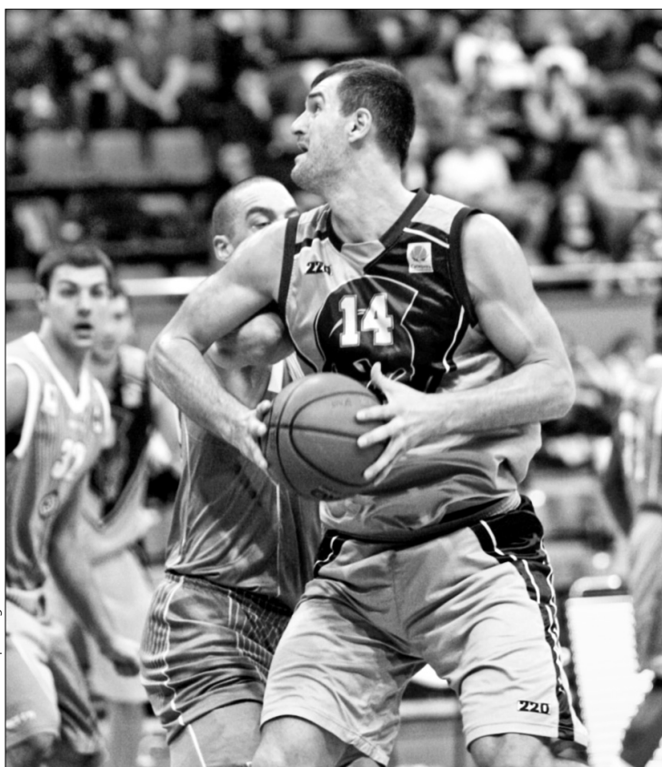
"Будівельник" перервав неприємну серію програвів проти БК "Одеса"

Три до ряду далеких в ціль від господарів вже на перших двох хвилинах другої половини остаточно позбавили матч інтриги. Господарі майданчика відірали-