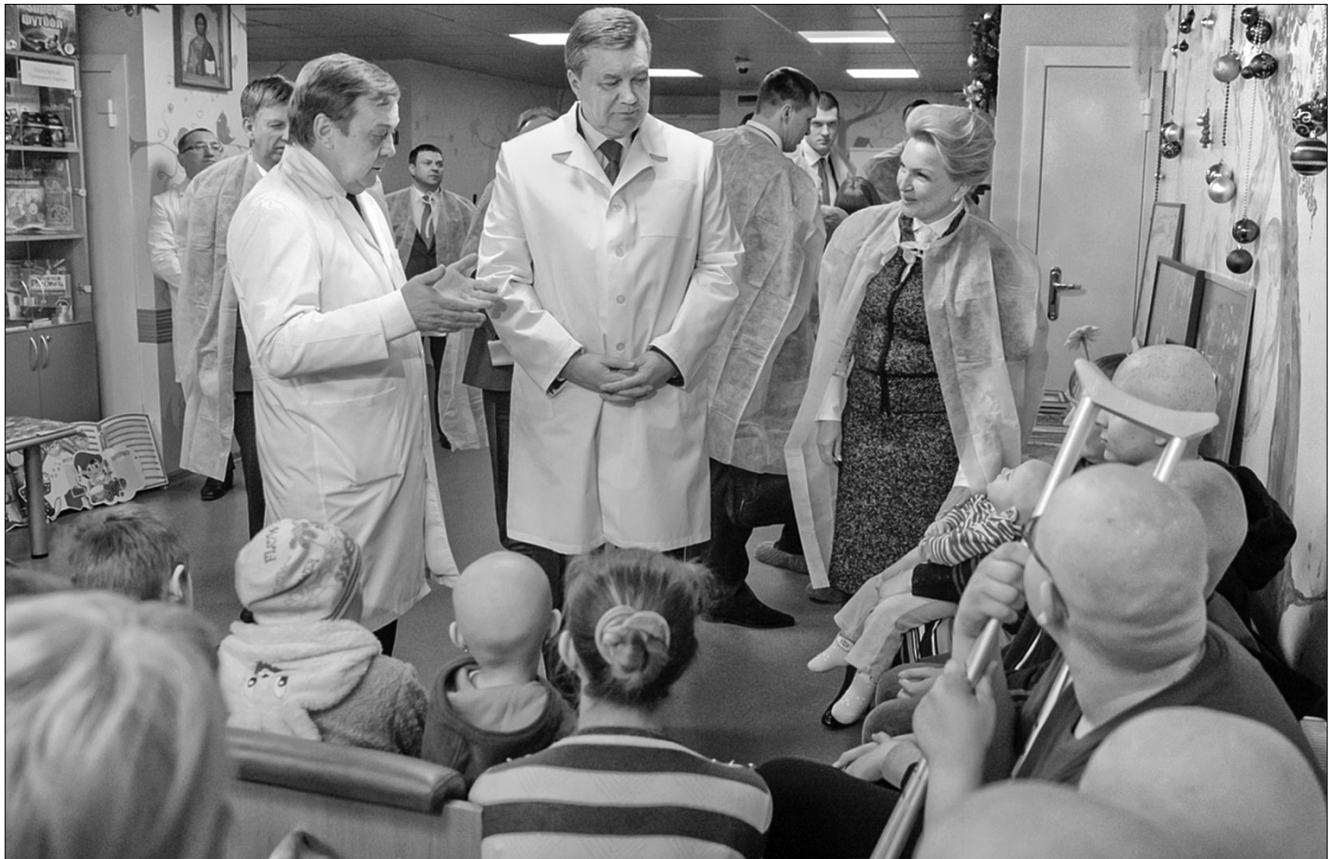
Президент України Віктор Янукович відвідав відділення дитячої онкології Національного інституту раку, де зустрівся з хворими дітьми, їхніми батьками та лікарями

"Усе лікування в онкоцентрі безкоштовно для дітей і фінансується з бюджету, за деякими виключеннями підключаються меценатські ресурси, проте сім'ї дітей не платять жодної копійки. Співробітники Інституту раку є одними із провідних спеціалістів з онкології у світі, ми робимо багато унікальних речей, і наші ко-