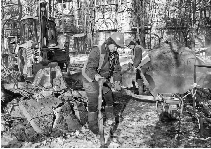
Взимку аварійні бригади намагаються у встановлені терміни ліквідувати пориви на теплотрасах

О палювальний сезон 2013-2014 років, напевне, надовго запам'ятається комунальникам. Різе похолодання наприкінці вересня та тріскучі морози у січні були своєрідним іспитом для енергетиків, який вони, схоже, достойно складають. І хоча щодоби у Києві виникає від 10-ти до 30-ти пошкоджень теплових мереж, статистика свідчить, що у січні, у порівнянні з аналогічним періодом минулого року, кількість аварій зменшилася.