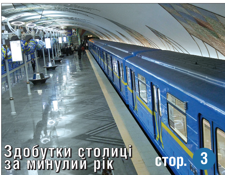
Здобутки столиці за минулий рік стор. 3

З Новим роком та Різдвом Христовим! Веселих свят!