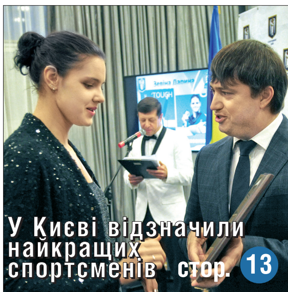
У Києві відзначили найкращих спортсменів стор. 13