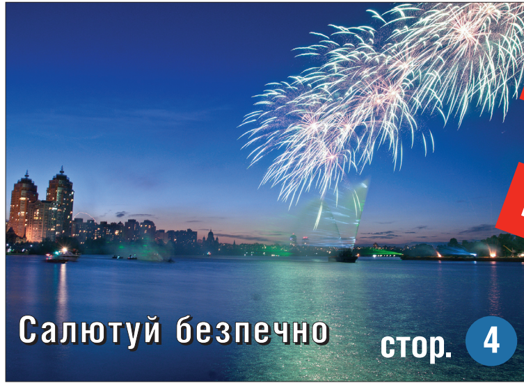
Салютуй безпечно стор. 4