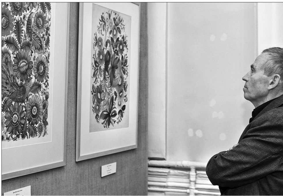
Творчість чотирьох поколінь майстринь яскраво ілюструє розвиток Петриківського розпису

Петриківський розпис — українське декоративно-орнаментальне народне малярство, яке сформувалося на Дніпропетровщині в Петриківці. Селище заснував у 1772 році останній кошовий отаман Запорізької Січі Петро Калнишевський. Світові "Петриківку" відкрив у ХІХ столітті історик та етнограф Дмитро Яворницький, а офіційне визнання розпис отримав у 1936 році, вразивши уяву тисяч людей на першій великій виставці народної творчості у Києві. Останні три роки масштабну роботу з просування Петриківського розпису здійснює віцепрем'єр України Олександр Вілкул. Виставки народного розпису побували в багатьох країнах світу. Зокрема твори презентували в посольствах України країн Євросоюзу, в Європейському Парламенті в Брюсселі, в музеї сучасного