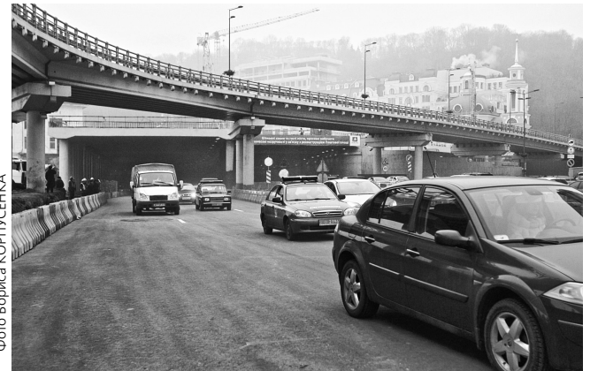
Після відкриття другого дорожнього переходу автомобільні потоки розвели — одним тунелем автівки рухаються у бік Оболони, іншим — до мосту Метро

А от щоб Поштова площа була зручною не лише для автомобілістів, а й милувала око киян та гостей міста, як тільки дозволить погода, розпочнуться роботи з облаштування її зовнішнього простору.