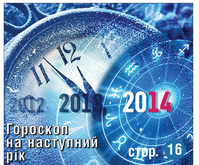
Гороскоп на наступний рік стор. 16