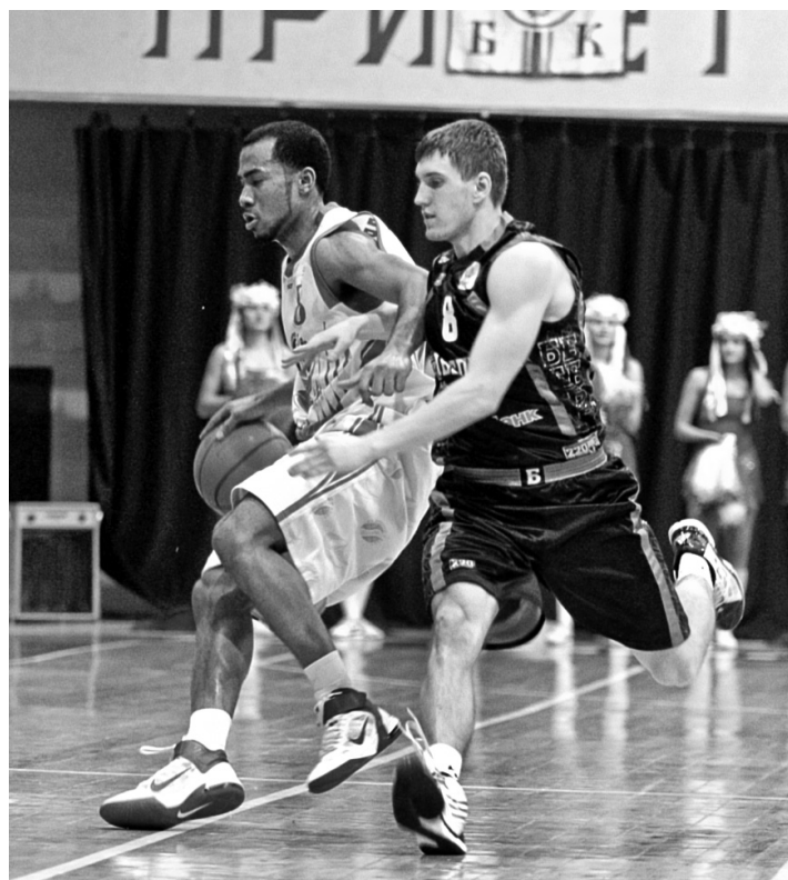
"Будівельник" (в чорній формі) здобув нелегку перемогу, обігравши на виїзді непоступливий "ДніпроАзот" з рахунком 75:70

На початку заключного відрізка "Будівельник" підібрався на відстань 10 очок, що після "мінус 22" (усього кількома хвилинами раніше) вселило серйоз-