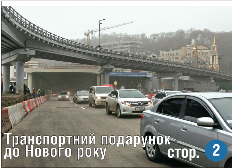
Транспортний подарунок до Нового року стор. 2