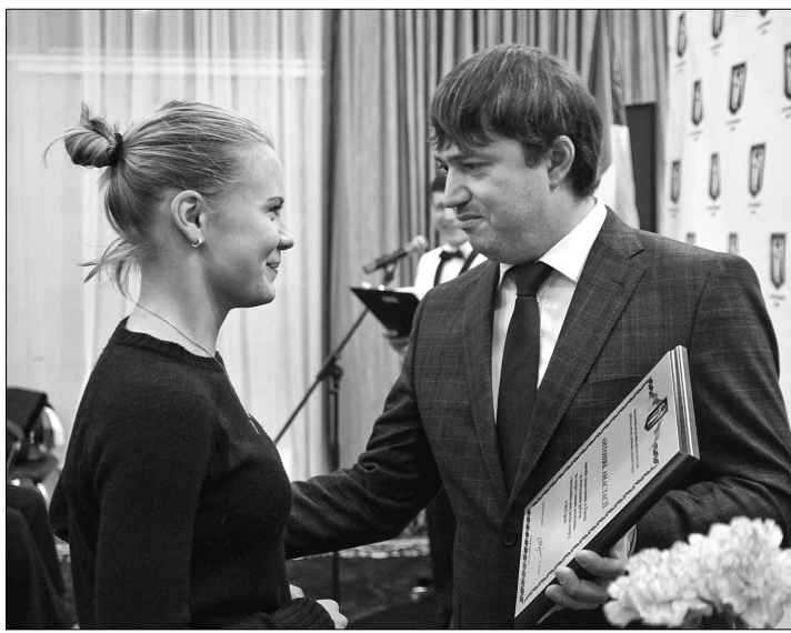
У 2013 році спортсменами міста Києва з олімпійських видів спорту на чемпіонатах світу здобуто 5 перших, 7 других та 13 третіх місць, а на чемпіонатах Європи — 4 перших, 3 других та 7 третіх місць