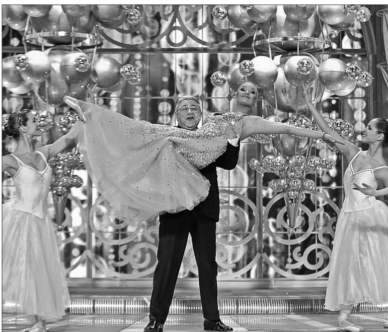
У "Блакитному вогнику-2013" Євген Петросян та Анастасія Волочкова ставитимуть балетний номер

У новорічному "вогнику" власного продакшну "Ніч великих очікувань" (31 грудня о 23.00) візьмуть участь зірки української, російської і зарубіжної естради. Це Філіп Кіркоров, Софія Ротару, Крістіна Орбакайте, Валерій Меладзе, Таїсія Повалій, Ірина Білик, Наталія Моги-