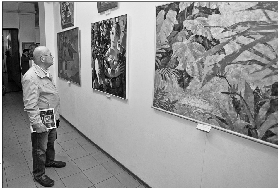
Роботи сучасних майстрів представляють усю географію і напрями українського мистецтва

Частиною експозиції є проект Slava Frolova Group. Роботи молодих талановитих художників знаходяться в залах на мольбертах. Картини цього мистецького марафону