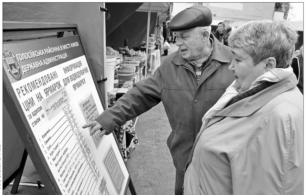
Відвідавна по вулиці Саксаганського, 71 розпочав свою роботу новий постійно діючий ярмарок

Робити покупки на ярмарках — це дуже зручно й вигідно для мешканців, у тому числі й для пен-