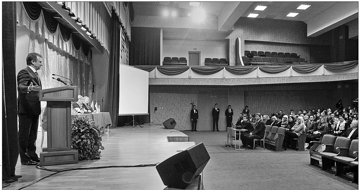
У рамках проведення тижня Європейської хартії місцевого самоврядування голова КМДА Олександр Попов зустрівся зі студентами та викладачами Київського міжнародного університету

Київ має давню історію місцевого самоврядування, й міська влада планує активно продовжувати ці добрі традиції. Зокрема шляхом збільшення самостійності та посилення самоврядування на місцях, залучення молоді до нових перспективних для столиці проектів тощо. Тож у рамках проведення тижня Європейської хартії місцевого самоврядування голова КМДА Олександр Попов учора зустрівся зі студентами та викладачами Київського міжнародного університету.