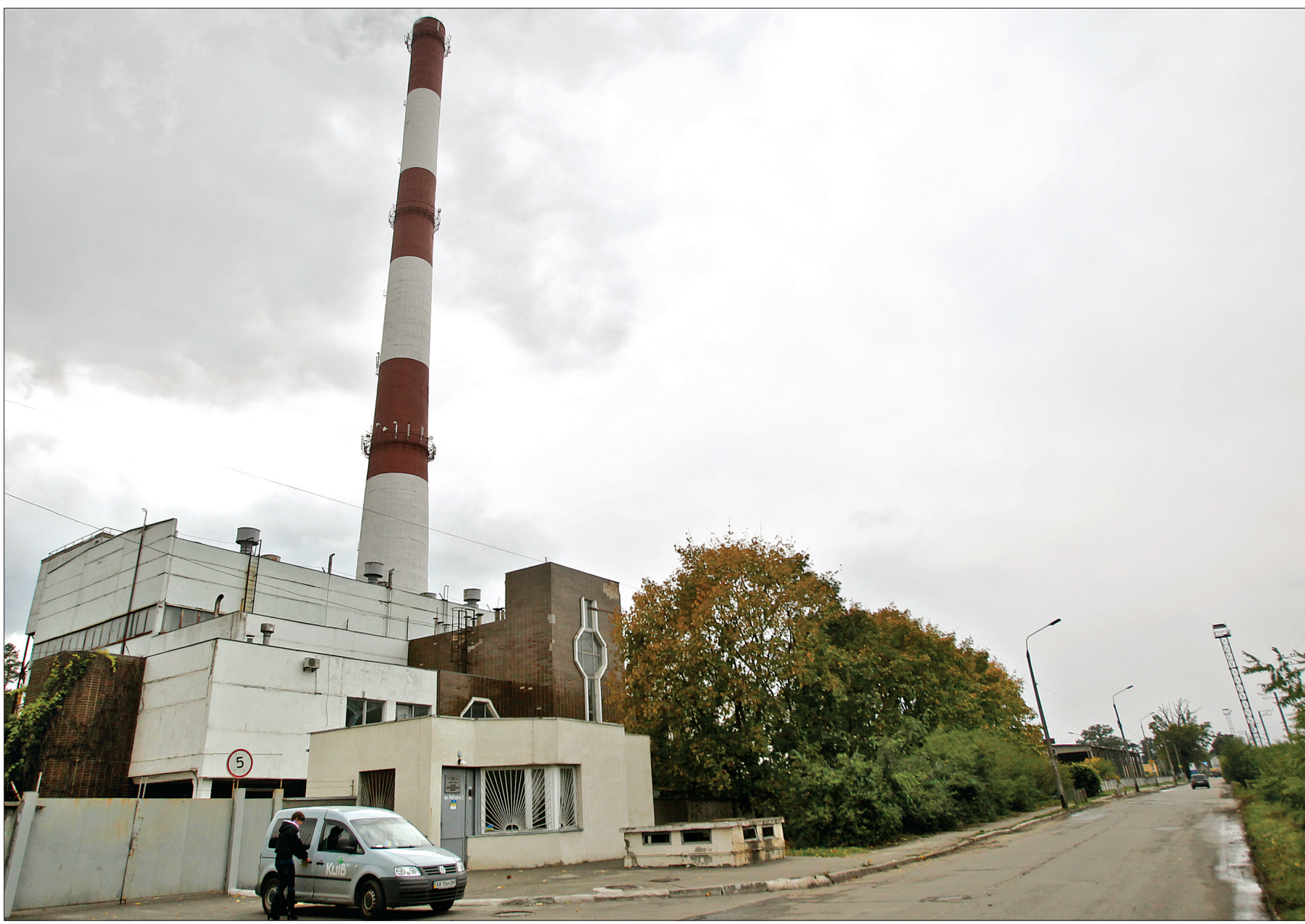
Цьогоріч столичним енергетикам довелося вперше за останні роки практично одночасно підключати до опалення житлові будинки та об'єкти соціальної сфери

Місто успішно увійшло в опалювальний період