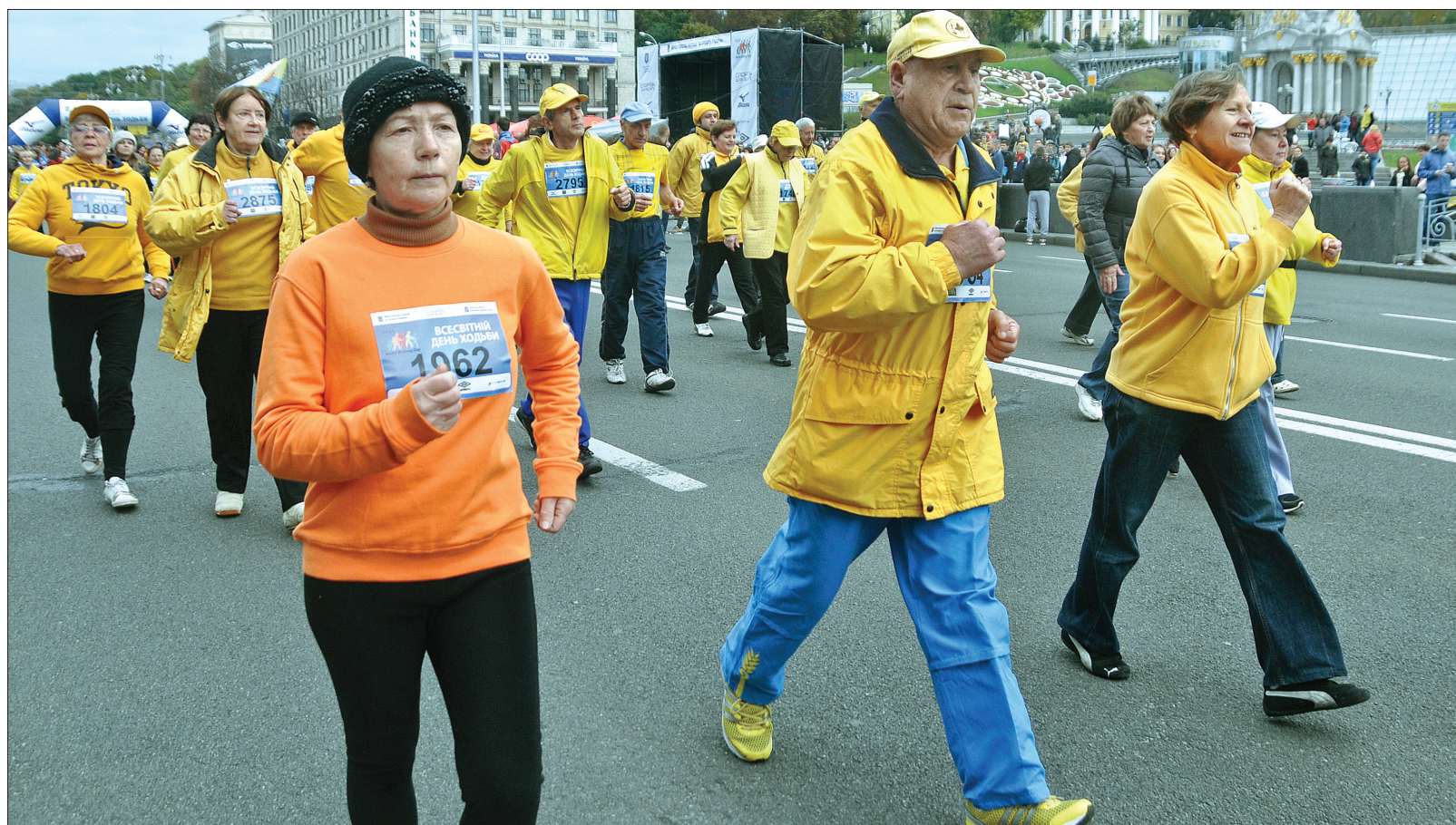
Вперше проведений День ходьби в Україні зібрав понад 3000 учасників

В рамках заходу близько 3 000 киян пройшли центральною вулицею міста