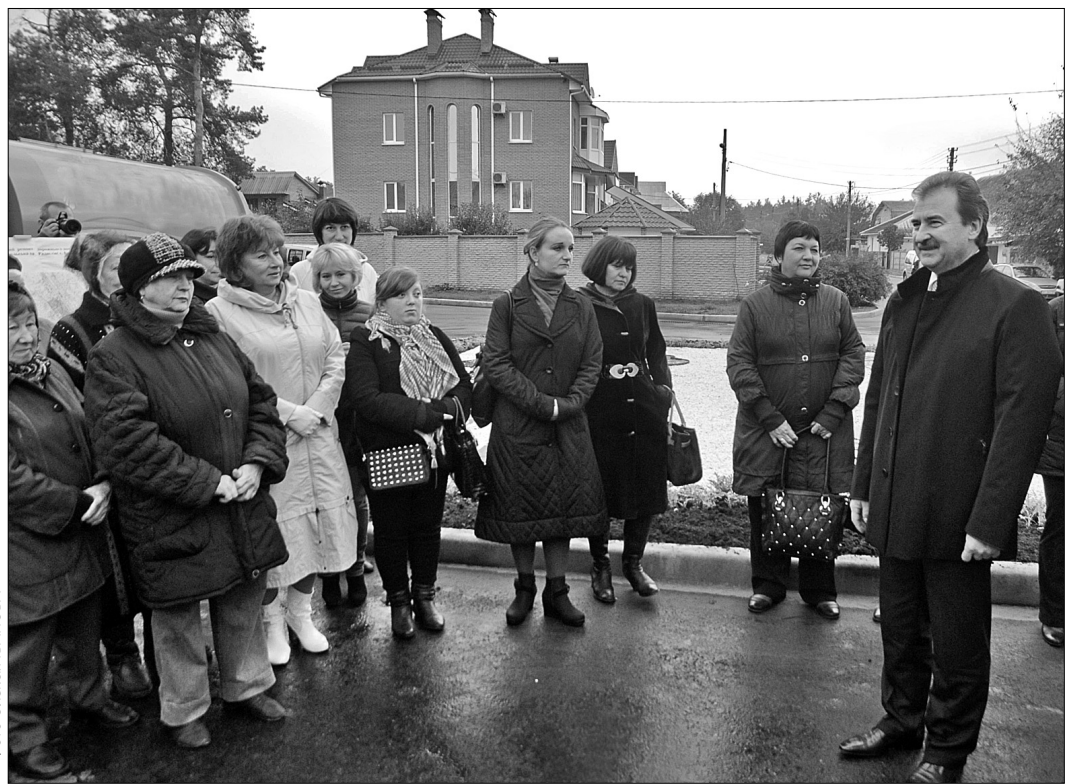
Голова КМДА Олександр Попов проінспектував якість інфраструктури у селищі Биківня та поспілкувався з місцевими жителями про перспективи розвитку території

"Завдяки реалізації ініціатив Президента України щодо розвитку транспортної галузі впродовж останніх кількох місяців нам вдалося швидко і якісно провести капітальний ремонт двох найважливіших транспортних артерій Биківні. Відремонтовані вулиці Путівльська та Радистів, адже саме цими магістралями пролягають маршрути громадського транспорту", — відзначив голова КМДА Олександр Попов.