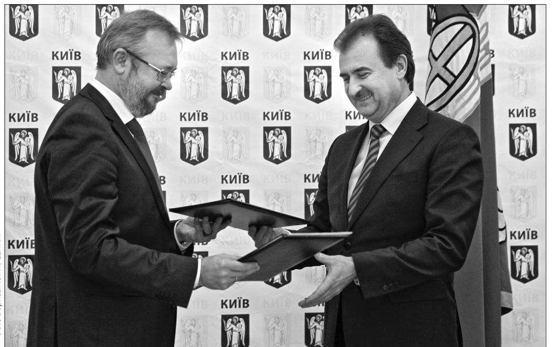
Голова КМДА Олександр Попов підписав меморандум про поглиблення співпраці з директором Національного інституту стратегічних досліджень Андрієм Єрмолаєвим

"На нашу думку, ще велику увагу варто приділити розвитку культури та туристичної інфраструктури, адже столиця — це центр української нації, де багато сакральних об'єктів, тому потрібно навчитися їх підтримувати та використовувати по-справжньому — створити свою сакральну мапу Києва. Це нам цікаво й корисно в практичній ро-