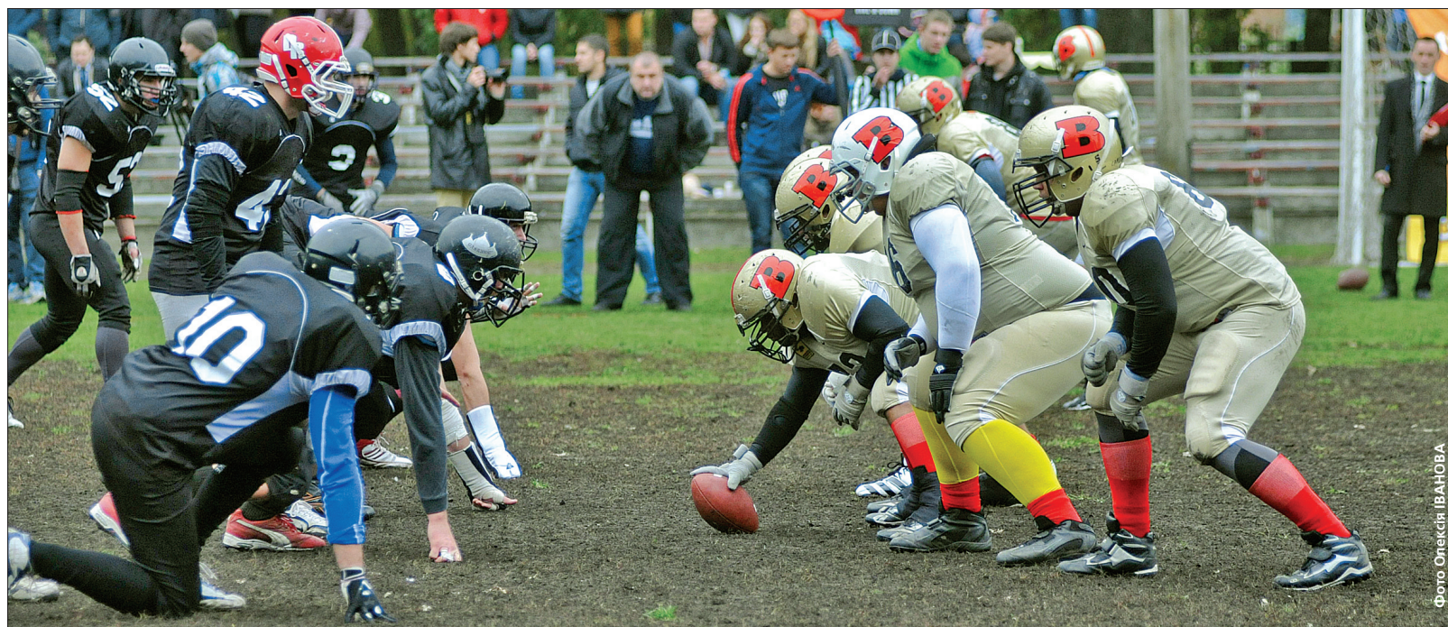
У півфінальному поєдинку Кубка України з американського футболу киявські "Слов'яни" (у чорній формі) поступилися "Kiev Bandits" з рахунком 0:28

В столиці відбулося принципове протистояння з американського футболу