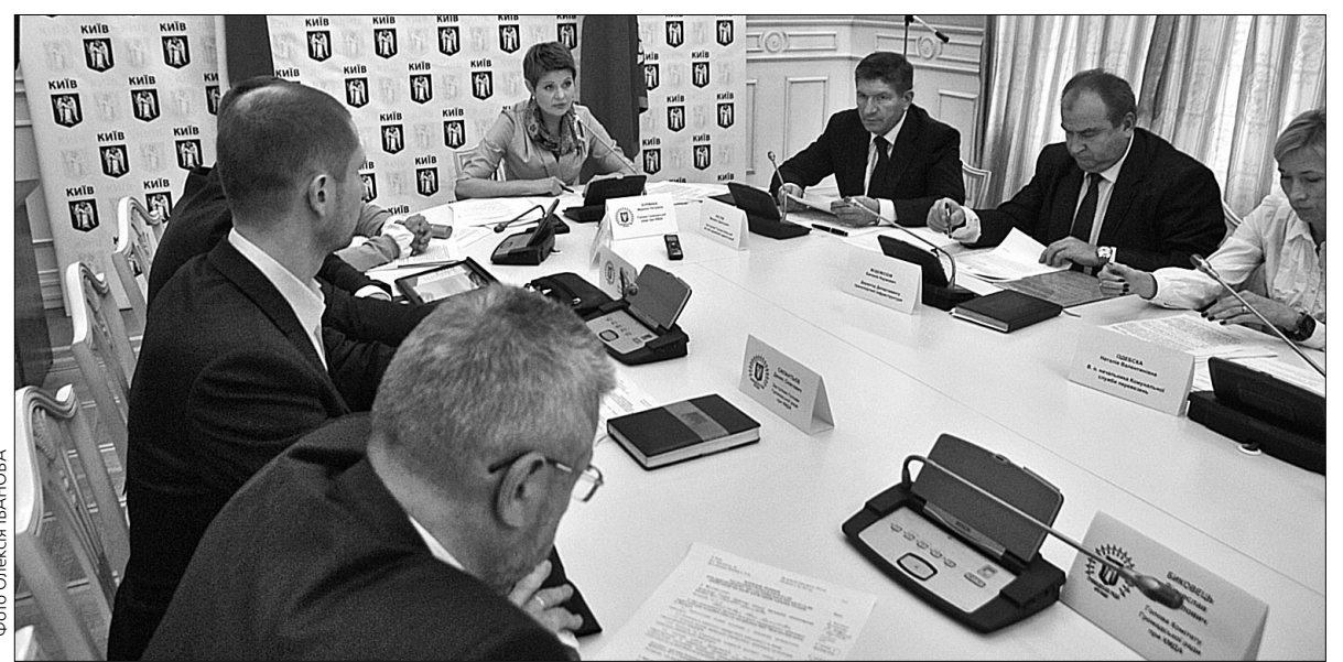
Під час засідання Громадської ради при Київській міській державній адміністрації йшлося про стан громадського транспорту в столиці

"За останні роки, завдяки підтримці Президента України, чимало було зроблено в частині оновлення рухомого складу всіх видів транспорту. Сьогодні ми бачимо на дорогах Києва громадський транспорт сучасного рівня, який, здебільшого, є українським продуктом. Утім, міський транспорт вимагає подальшого вдосконалення, зокрема необхідно, аби були чіткі графіки руху. У наших реаліях виникає питання впливу затворів на роботу громадського транспорту, взаємодії на дорозі з іншими авто. У контексті цього виникає