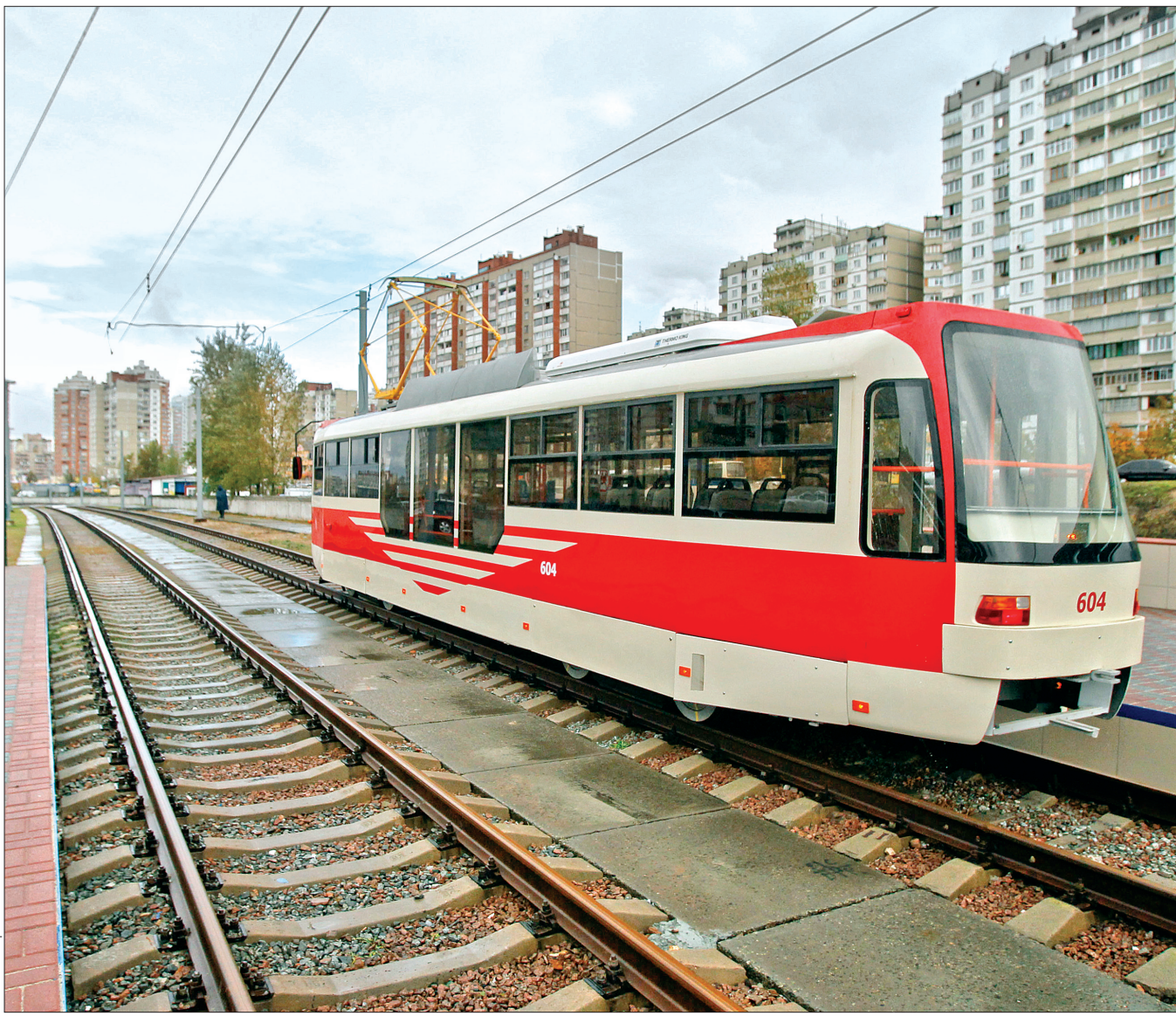
Для потреб міста в цьому році було закуплено дванадцять трамвайних потягів, окрім того, на базі КП "Київпастранс" розроблені та випущені односекційні вагони "Каштан"

Протягом останніх трьох років усі сфери дорожньо-транспортного господарства міста зазнали суттєвих змін. Знаково, що набрані темпи оновлення не лише не спадають, а навпаки — зростають. Так, цього року у Києві завершать реконструкцію кількох важливих транспортних артерій, закінчать будівництво Куренівсько-Червоноармійської лінії метрополітену та розпочнуть зведення четвертої гілки — на житловий масив Вигурівщина-Троєщина. Разом з тим оновлюється і парк громадського транспорту, а вже наступного року за проїзд кияни платитимуть за новою схемою. Яким стане транспортний рік 2014-го, вчора в міськадміністрації обговорили фахівці галузі.