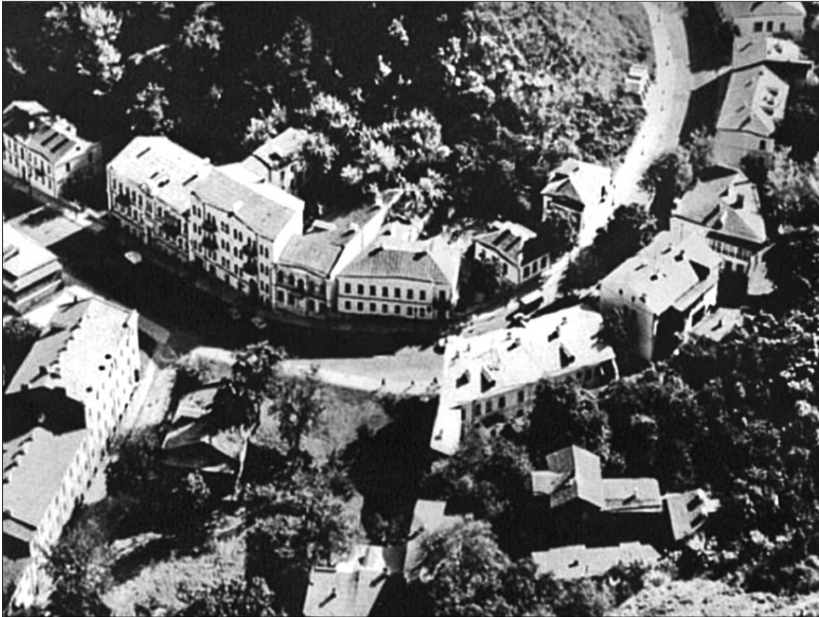
Фото садиби ювеліра минулого століття

У будинку відомого ювеліра на Андріївському узвозі пропонують створити тематичний музей