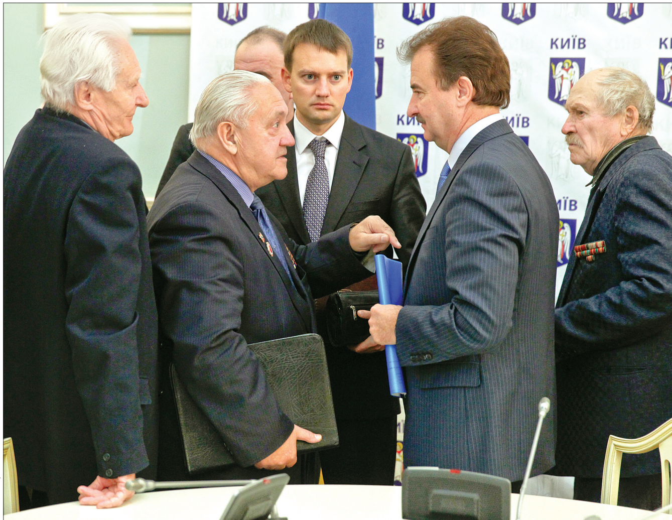
Під час круглого столу активісти ветеранських організацій столиці спілкувалися з головою КМДА Олександром Поповим та обговорили програму святкування ювілейної дати — 70-річчя визволення Києва від фашистських загарбників

Майже 70 років тому, 6 листопада, Київ героїчними зусиллями був звільнений від німецько-фашистських окупантів. Наразі влада готується відзначити цю непересічну для столиці дату та вже підготувала цікаву і різноманітну програму. Тематичні заходи охоплюють усі райони міста, і жоден ветеран не залишиться поза увагою. Подбають і про матеріальну підтримку визволителів столиці — виплати ветерани отримають не лише зі скарбниці міста, а й з позабюджетного фонду.