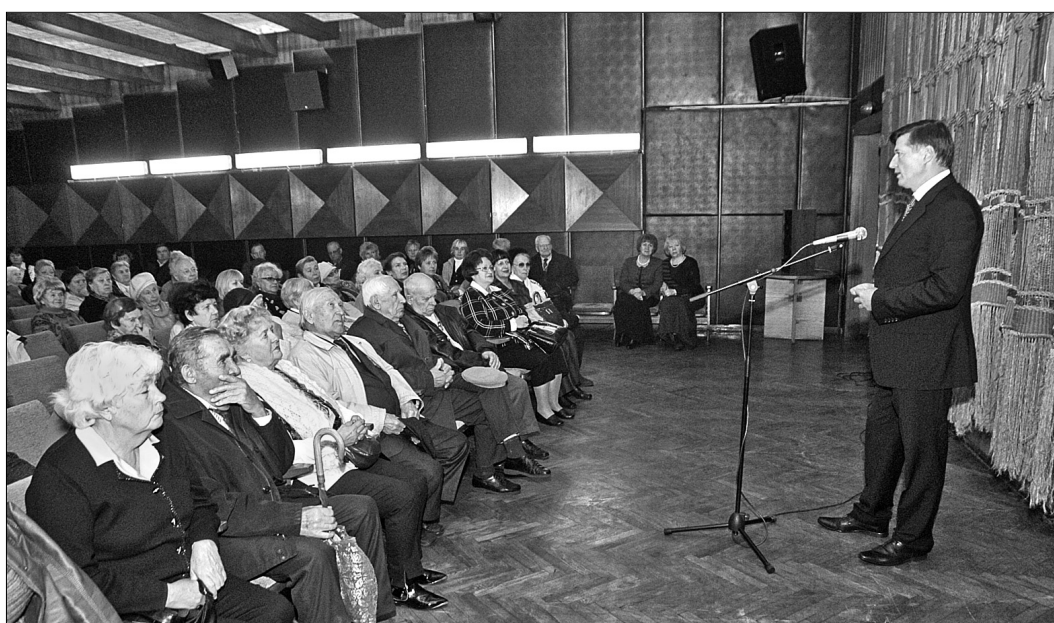
З нагоди відзначення в Києві Дня людей похилого віку та Дня ветерана учасників святкових заходів привітає заступник голови КМДА Віктор Корж

"Сьогодні ми дуже ретельно готуємося до 70-ї річниці визволення Києва, — розповів Віктор Корж. — Ми хочемо не просто вручити грошову допомогу, до речі, вона буде суттєва, як ніколи,