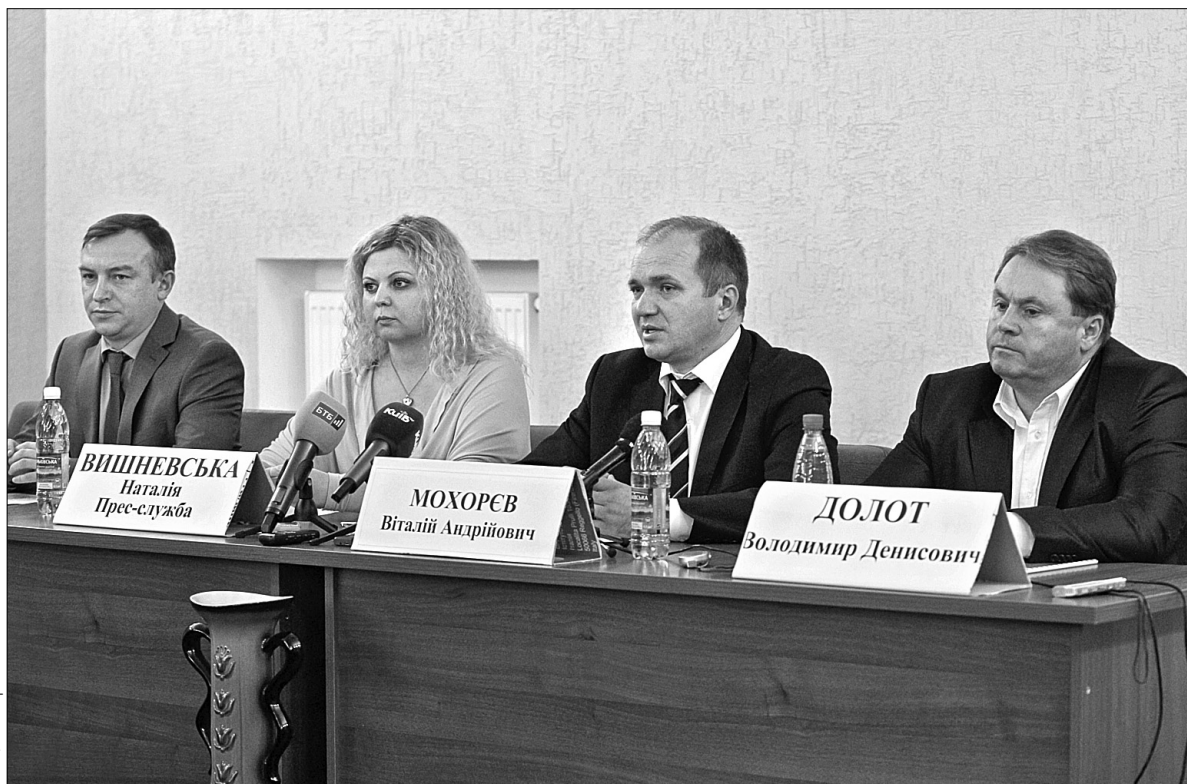
Під час брифінгу йшлося про плани міської влади щодо покращення соціального захисту малозахищених верств населення за рахунок Муніципальної лікарняної каси

Нагадаємо, Муніципальна лікарняна каса працює уже понад два роки. Так, уже проліковано близько