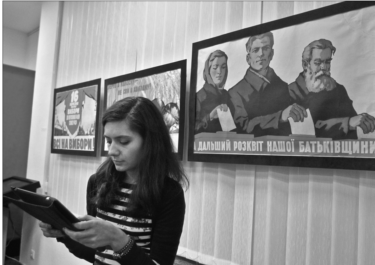
Яким чином формувалася світогляд радянської людини, демонструють тогочасні плакати