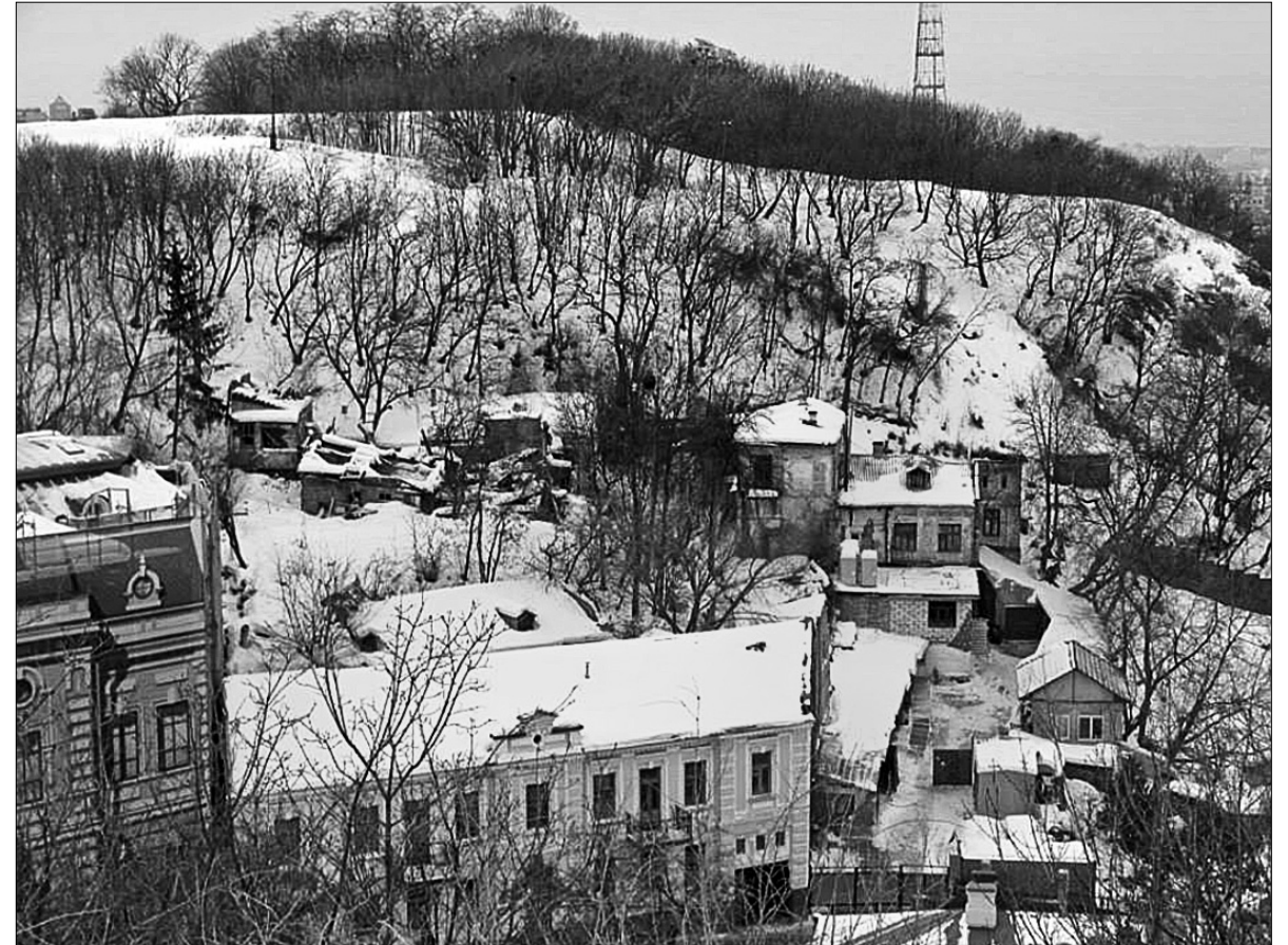
Фото садиби з боку Андріївського узвозу, 2013 рік

У сучасні часи будинки садиби під літерами А-Д було приватизовано ТОВ "Авіантбуд" за умов їх реконструкції за 170 грн за будівлю. Хоча реконструкція флігелів не проводилась, будівля під літерою "Е" також була викуплена цим ТОВ за 222 600 грн, без проведення кон-