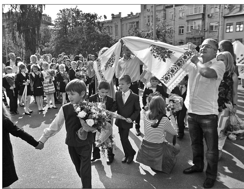
У школу першачки заходили під українськими вишитими рушниками, які на щастя, на долю подарували їм найрідніші для них люди