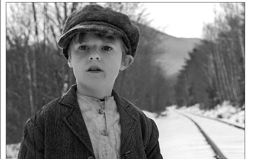
Переглянувши 10 фіналістів — короткометражних стрічок з різних країн світу — глядачі мають змогу проголосувати за найцікавішу

Документальний мультфільм "Народні ірландські меблі" присвячений старовинним меблям, "Обличчя світу" показує красиви Москви, Пакистану та Квебека очима мандрівного ілюстратора зі смаком до пригод. Американський фільм "Смуга осілости" заснований на реальних подіях із сімейної історії режисера. Це розповідь про десятирічного єврейського хлопчика, який намагається уникнути примусового призову в російську армію в період Кримської війни. У картині "П'ятниця" молодий чоловік готується помститися за смерть своєї матері, яка загинула рік тому під час теракту в Лондоні, а в короткометражці "Я — великий клубок смутку" під час шикарної вечірки на даху в Нью-Йорку троє гостей виходять за рамки звичайної світської бесіди. Дивимося і голосуємо ●