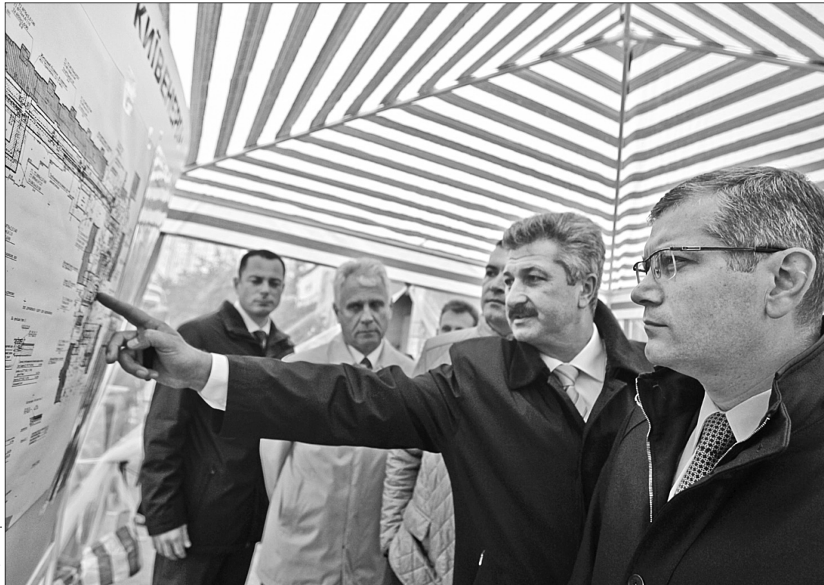
Візну нараду на столичні об'єкти реконструкції здійснив і віце-прем'єр-міністр України Олександр Вілкул

Серед них і ділянка від центрального теплового пункту, що розташований по вул. Приозерній, 2-6, що в Оболонському районі міста. Тут проводиться реконструкція розподільчих тепломереж центрального опалення та гарячого водопостачання. Тривають роботи із реконструкції магістральної теплової мережі по вул. Попова. ПАТ "Київенерго" повідомляє, що ці мережі експлуатуються з 80-х років минулого сторіччя та давно відпрацювали свій нормативний ресурс. Так, за останні п'ять років фахівці підприємства