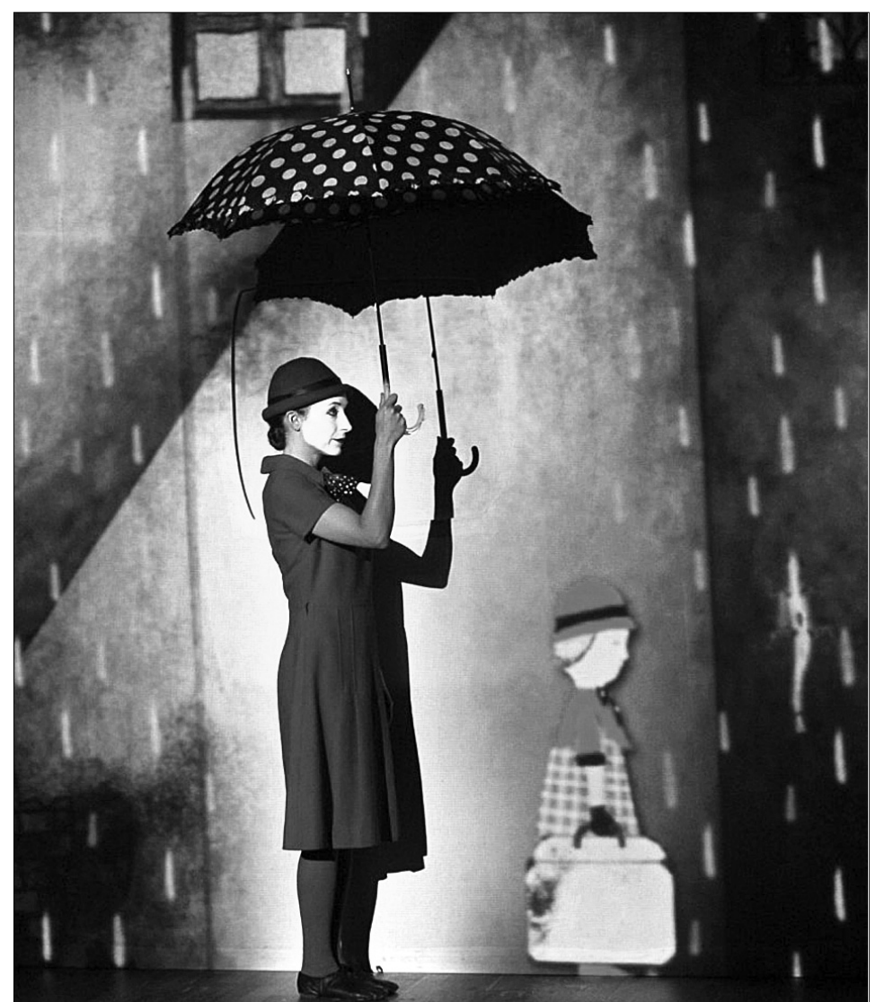
У музичній виставі багато елементів анімації, чорного гумору та сюрреалістичних сцен

Вартість квитків: 100-250 грн на вечірні покази, 80-200 грн на денний показ.