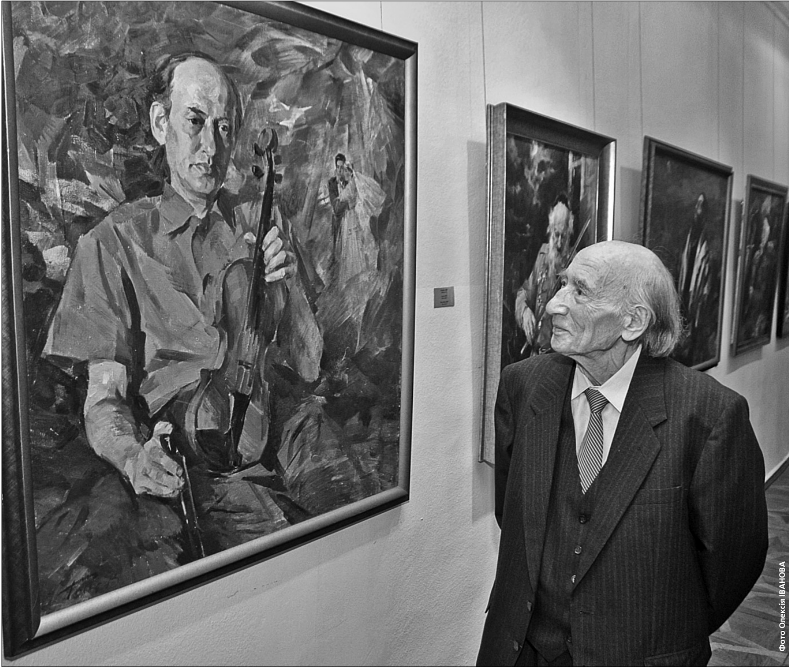
Художник завжди був затребуваний як класичний портретист і має в своєму доробку чимало чудових робіт

До 80-річчя художника триває ретроспектива його робіт