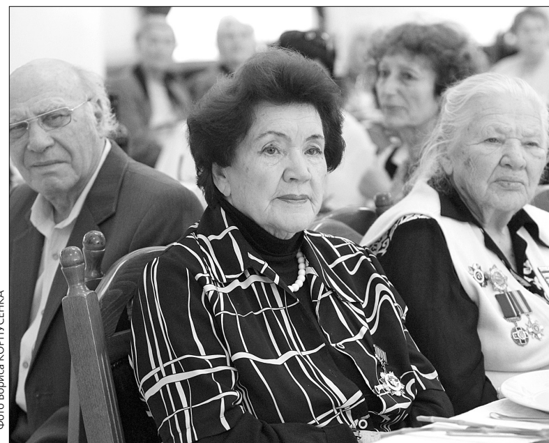
Традиційно у другій половині вересня в столичній мерії відбувається урочистий прийом на честь Праведників Бабиного Яру

"Для мене Праведники Бабиного Яру справжні герої, — розповів "Хрещатику" президент єврейської ради