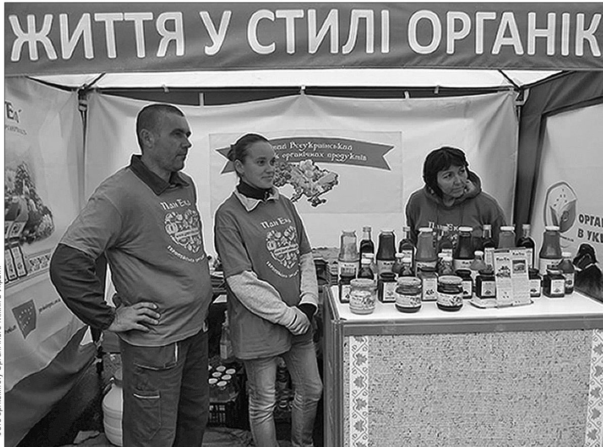
Фото: оргпримету. Органічного тижня в Україні

"Посмакувати" органічним розмаїттям містяни мали можливість у суботу, 7 вересня, відвідавши П'ятий всеукраїнський ярмарок орга-