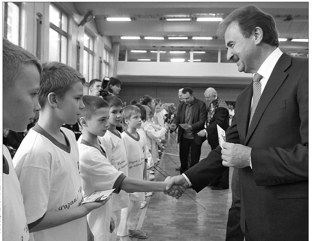
Членські квитки юним динамівцям особисто вручив голова КМДА Олександр Попов

Тепер ФСТ "Динамо" чекає на поповнення й із радістю відкриє свої двері для всіх охочих. Молоді спортсмени, які нещодавно влилися в динамівську родину, отримали членські квитки з рук голови КМДА Олександра Попова. Загалом до лав міського товариства приєднається майже 450 юних спортсменів-динамівців.