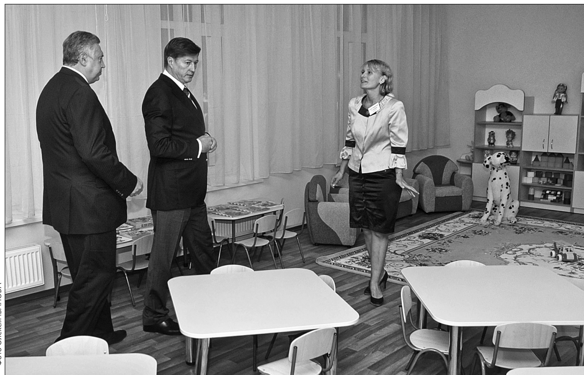
Особисто завітав на відкриття оновленого дошкільного закладу заступник голови КМДА Віктор Корж

Так, у садочку капітально відремонтували всі приміщення, утепили фасад, замінили вікна та батареї — тепер малеча не буде мерзнути в холодну пору року. З’явився тут і сучасний харчблок та — що не менш важливо для здоров’я дітей — сучасний басейн, а також ігровий та спортивний майданчик. Крім того, наразі групові приміщення забезпечені сучасними дитячими меблями, іг-