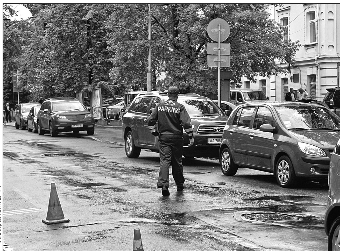
Часто нелегальні паркувальні майданчики коштують для водіїв дорожче, ніж місця, які обслуговує комунальне підприємство