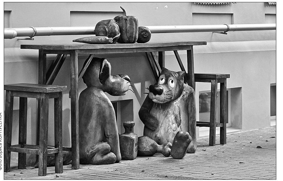
Герої улюбленого мультфільму "Жив-був пес" відпочивають після ситного обіду під столом в центрі міста