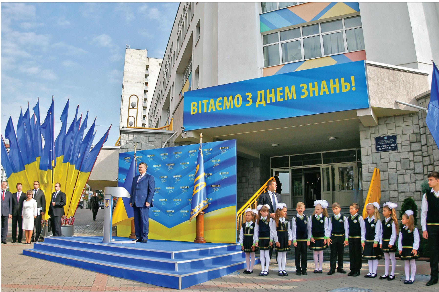
Першого вересня Президент України Віктор Янукович взяв участь в урочистостях з нагоди Дня знань в столичній ЗСШ №78

Новий навчальний рік місто розпочало на найвищому рівні