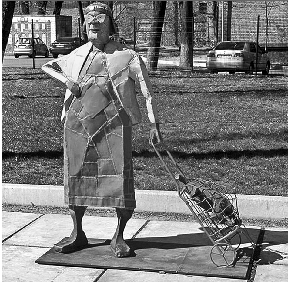
На Русанівській набережній "оселилися" нова бабця - войовнича, із візком-кравчучкою у руці