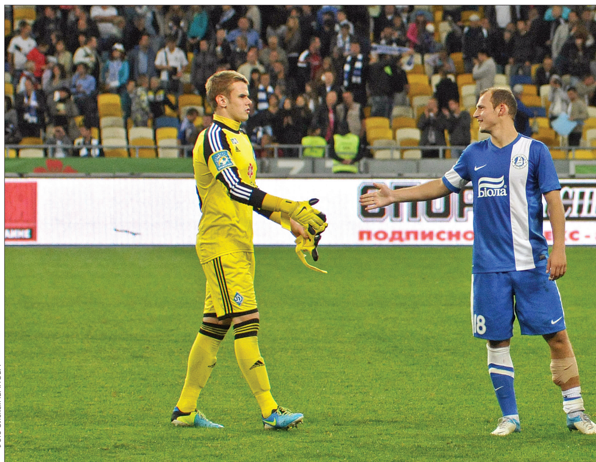
Нічийним результатом були задоволені футболісти обох команд

В цілому за рівної боротьби відкрити рахунок вдалося "Дніпру". Трапилося це на 22-й хвилині. Дніпропетровці здобули право на штрафний удар і вдало реалізували це стандартне положення. Пішов навіс у воротарський майданчик "Динамо", де першим на добиванні