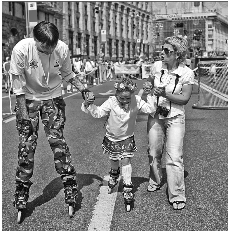
На День Незалежності кожен охочий зможе взяти участь у III Київському спортивному фестивалі "Веселі старты на роликах"

У місті підготували широкомасштабну програму відзначення Дня Незалежності. Про розмаїття святкувань та підготовку до них розповіла директор Департаменту суспільних комунікацій Марина Хонда під час розширеної апаратної наради КМДА. Зокрема ще відчорна (20 серпня) на території Національного комплексу "Експоцентр України" стартувала шорічна загальнодержавна виставка "Барвіста Україна", на якій досягнення міста представлятимуть 22 кращих київських промислових підприємств та установ. Наша експозиція представлена у центральному — 7-му павільйоні. Однією з центральних подій у культурному житті столиці стане відкриття 22 серпня виставки живопису Івана Марчука "Нерозгадані тайни". Захід присвячено першій річниці відкрит-