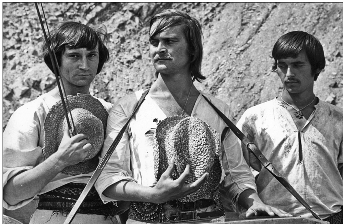
На великому екрані демонструватимуть картини, присвячені історичним подіям, видатним особистостям та простим українським рідинам

Відкриватиме проект 22 серпня історико-патріотичний фільм Ігоря Савченка "Богдан Хмельницький", який вийшов на екрани у березні 1941 року. У центрі оповіді — перші етапи повстання Богдана Хмельницького, в тому числі битва при Жовтих Водах і взяття Корсуня у 1648 році. В основу фільму була покладена однойменна драма Олександра Корнійчука 1938 року. А історико-біографічна стрічка Ігоря Савченка 1951 року "Тарас Шевченко" (26 серпня) покаже життя великого українського поета і художника,