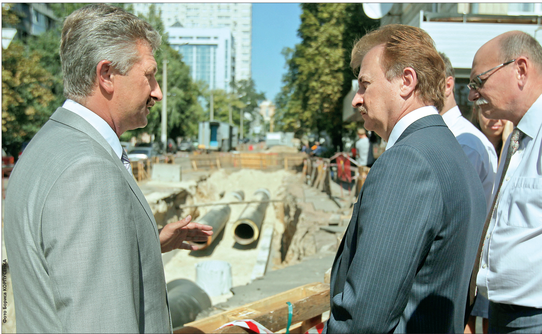
Під час огляду ходу реконструкції тепломережі на вул. Анрі Барбюса голова КМДА Олександр Попов заявив, що такої масштабної підготовки до опалювального сезону в Києві вже не було кілька десятиліть

У місті триває підготовка до нового опалювального сезону, зокрема на завершальному етапі — перекладка трубопроводів