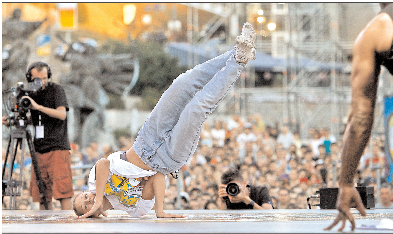
Дівчата нічим не поступалися у своїй майстерності з брейк-дансу хлопцям

У столиці відбувся міжнародний чемпіонат Burn Battle School 2013