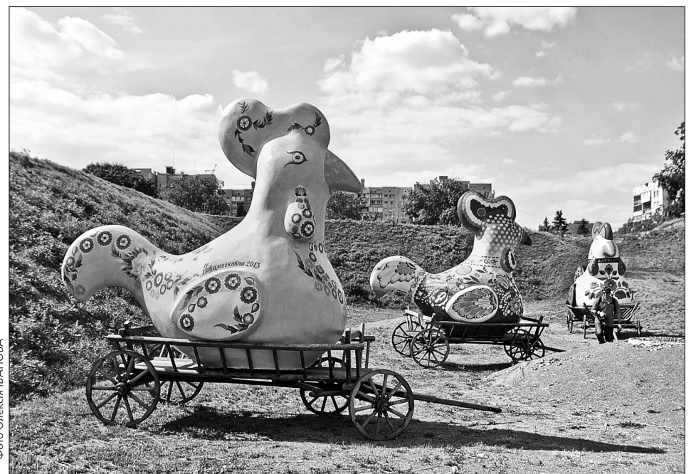
Зграя велетенських диво-птахів з різних регіонів країни дивуватиме глядачів своїм колоритом та енергетикою

Кульмінація дійства відбудеться на сцені на Майдані Незалежності. Тут пройде конкурс вишиванок серед чоловіків, жінок та дітей, концерт акапельного співу учасників параду на звання "Золотого голосу" та флеш-моб "Вишиванка dance". Далі на учасників параду, приблизно о 15.30, чекатиме нагородження цінними подарунками у номінаціях. Гран-прі фестивалю — вишуканий кубок із золота, срібла і платини, прикрашений 32-ма діамантами і покритий вісьмома різнокольоровими емалями — дістанеться місту, що найяскравіше презентує себе під