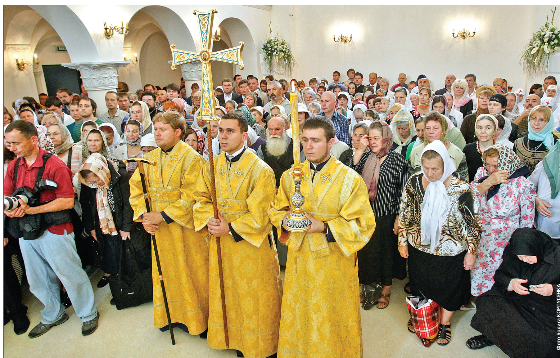
У столиці з нагоди 1025-річчя Хрещення Київської Русі на місці Воскресенського Кафедрального собору, у новому (нижньому) Андріє-Володимирському храмі, відбулося мале освячення храму та пройшла перша Божественна Літургія

Блаженніший Митрополит Київський і всієї України Володимир здійснив чин освячення Андріє-Володимирського храму